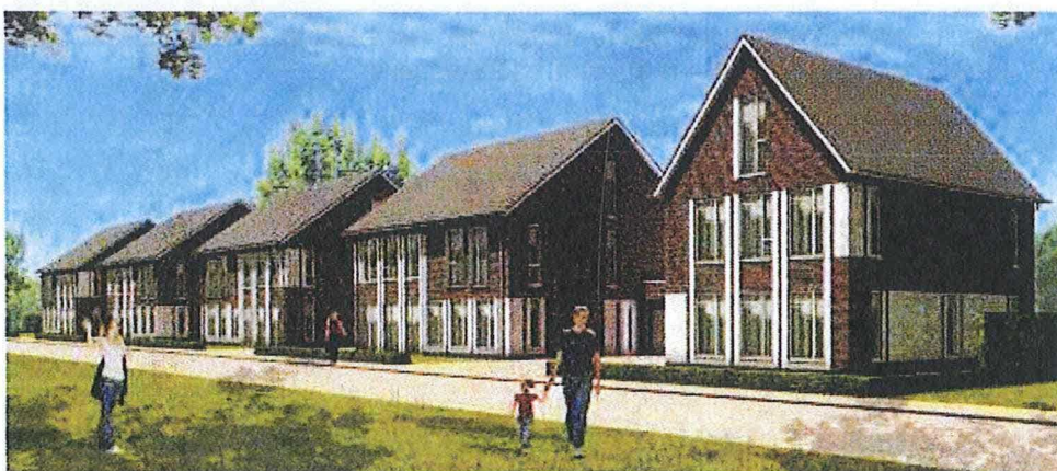
Aanzicht vanaf de Samuel van Haringhouckstraat