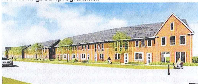
Aanzicht vanaf de Franekeerstraat

Het plangebied is momenteel geregeld in het bestemmingsplan Bolsward-Kom, dat is vastgesteld op 16 september 2008. Het is hierin bestemd als 'Maatschappelijk-1'. Binnen deze bestemming zijn 'lichte' maatschappelijke functies toegestaan. Woningbouw is binnen de bestemming niet mogelijk. Er ligt nu een bestemmingsplan voor de bouw van 26 rijwoningen en twee keer acht onder één kapwoningen en één geschakelde woning. In totaal gaat het dus om 35 woningen met parkeervoorzieningen. Achter de woningen ligt een ruimte groenzone. Het plan is opgenomen in het Woningbouwprogramma.