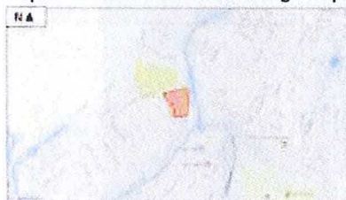
Globale locatie Bolsward-Franekestraet

In de Structuurvisie Bolsward 2010 is de voormalige schoollocatie als woongebied aangewezen. Op basis hiervan is een bestemmingsplan opgesteld. De kenmerken van de omgeving vormen een belangrijk uitgangspunt voor het stedenbouwkundig plan. Hierbij is extra aandacht gegeven aan de vormgeving van de woningen aan de Franekerstraet. Omdat het plangebied is gelegen in een wederopbouwwijk, is gekozen om hierbij aan te sluiten. Dit resulteert in een compositie die wordt bepaald door een eenvoudige repeterende opzet in rijenwoningen.