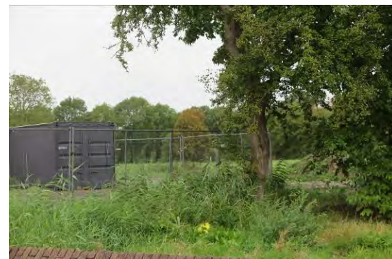
Vervolg figuur 2. Foto-impressie van het plangebied aan de Woningbouwlocatie Franekerstraat te Bolsward (bomen).