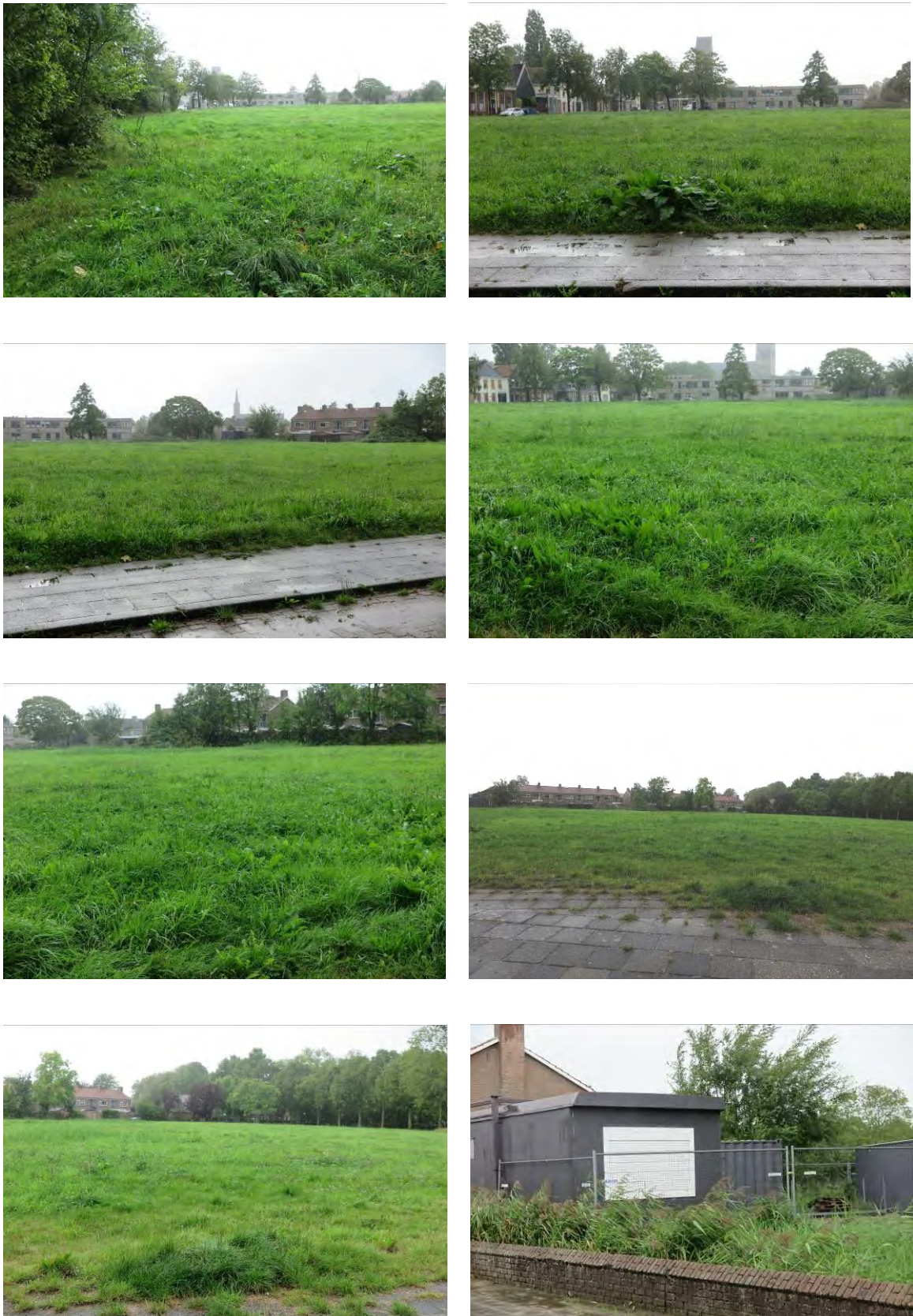
Figuur 2. Foto-impressie van het plangebied aan de Woningbouwlocatie Franekerstraat te Bolsward.