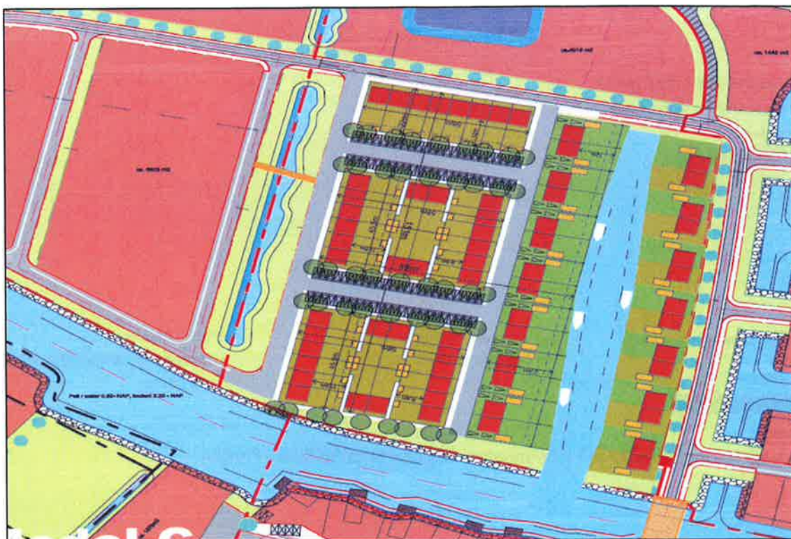
Figuur 2, inrichting fase E