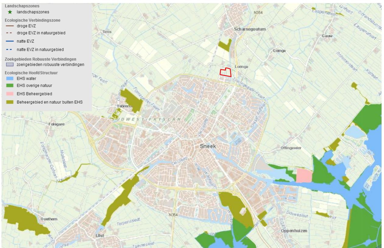
Figuur 10 EHS gebieden rond het plangebied