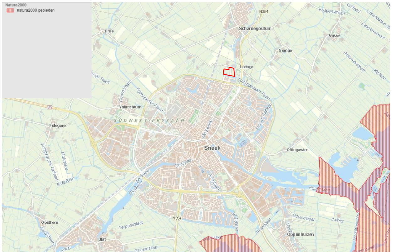
Figuur 9 Natura 2000 gebied in het rood gearceerd