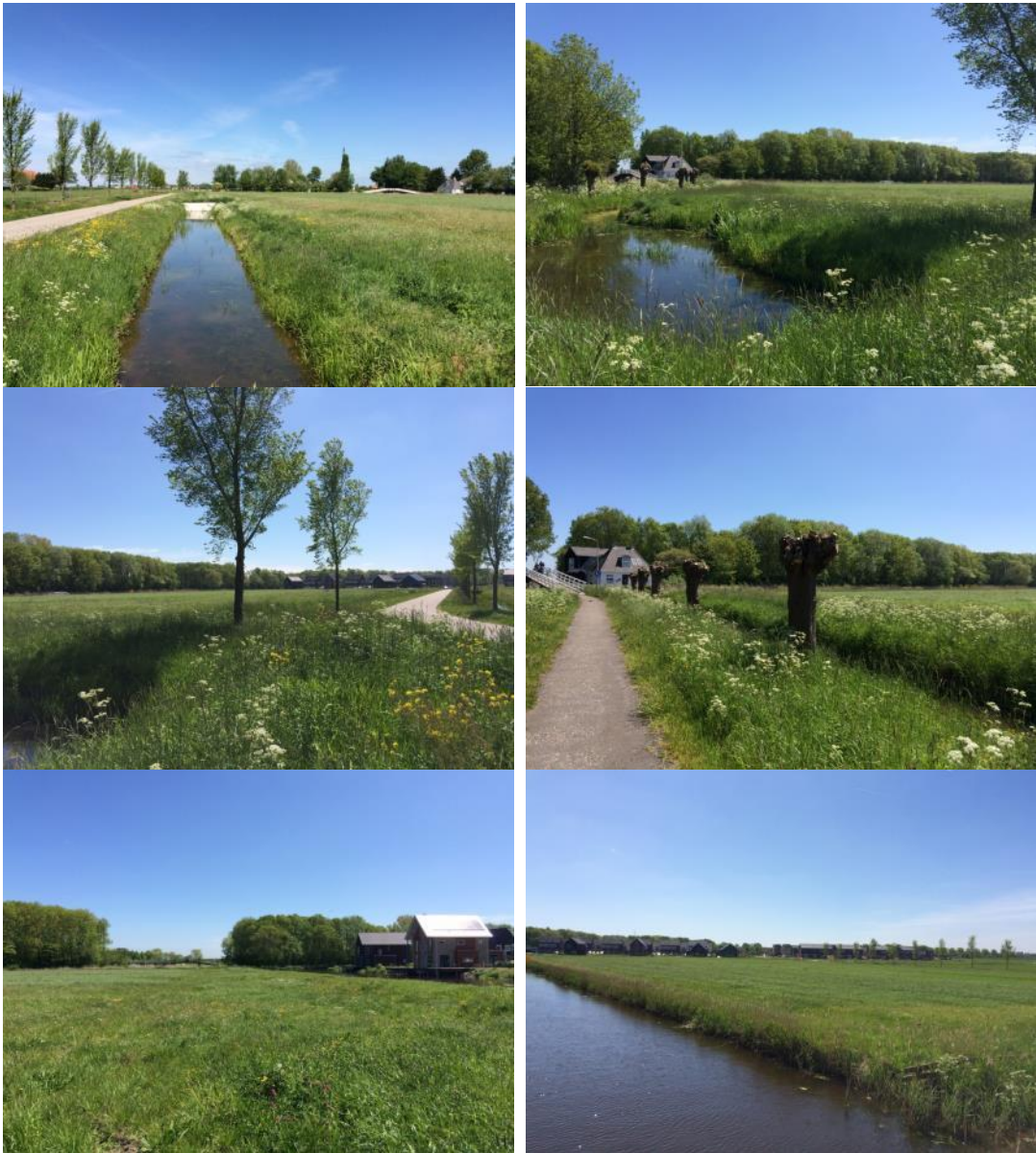
Figuur 2 t/m 7 Impressie van het gebied.