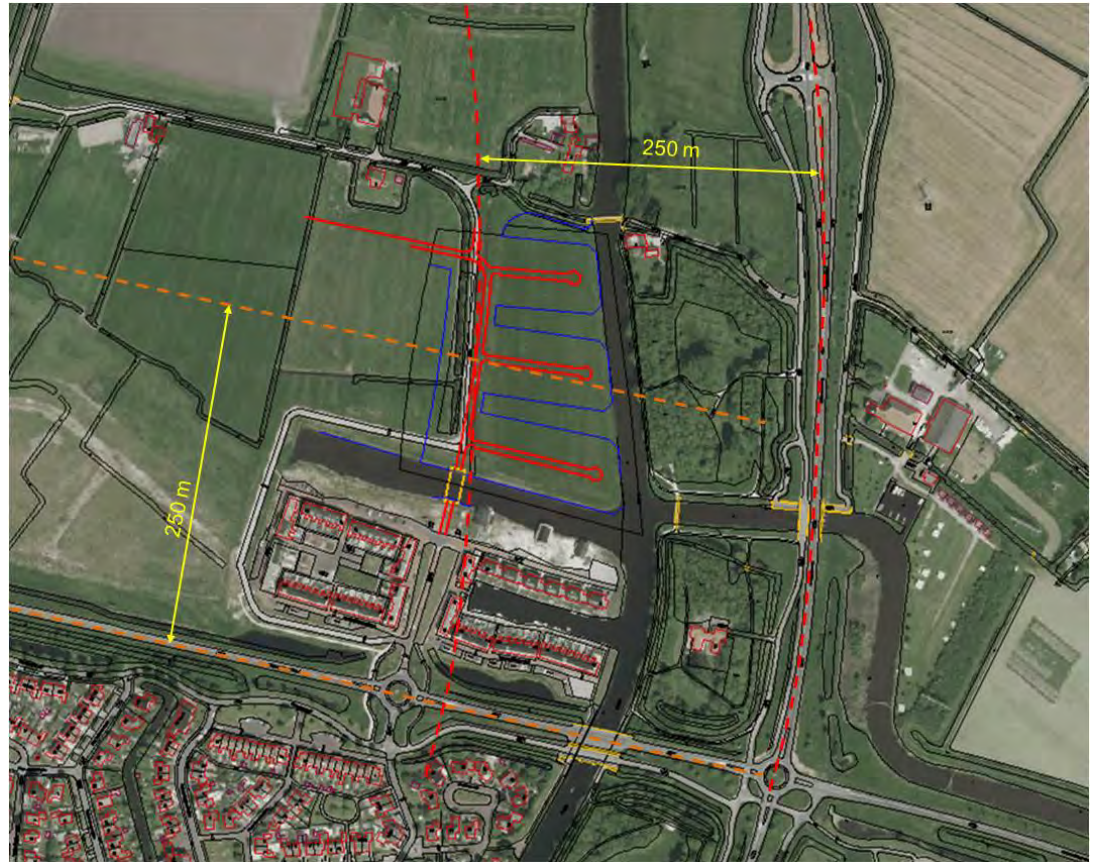
Afbeelding 1: Ligging geluidszones