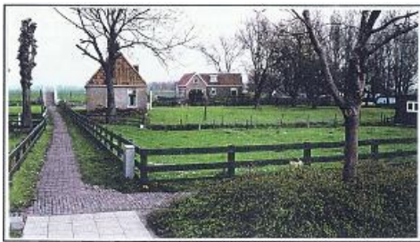
Een pôle met een eind 17 eeuwse karakteristieke woning op Eesterich nummer 8.

Het bestemmingsplan van 1998 gaf op blz. 8 een foto die in alle facetten typerend is voor het dorp. Deze foto met aangepaste vermelding behoort in het bestemmingsplan Molkwerum .