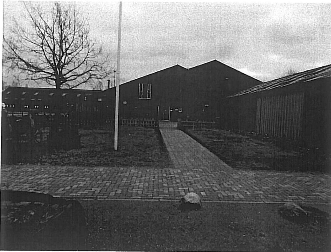
Betreffende locatie welke in aanmerking zou komen voor een showterrein