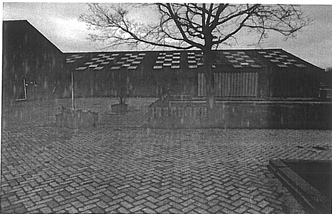
Het zicht vanaf de snelweg wordt weggenomen door de loods.