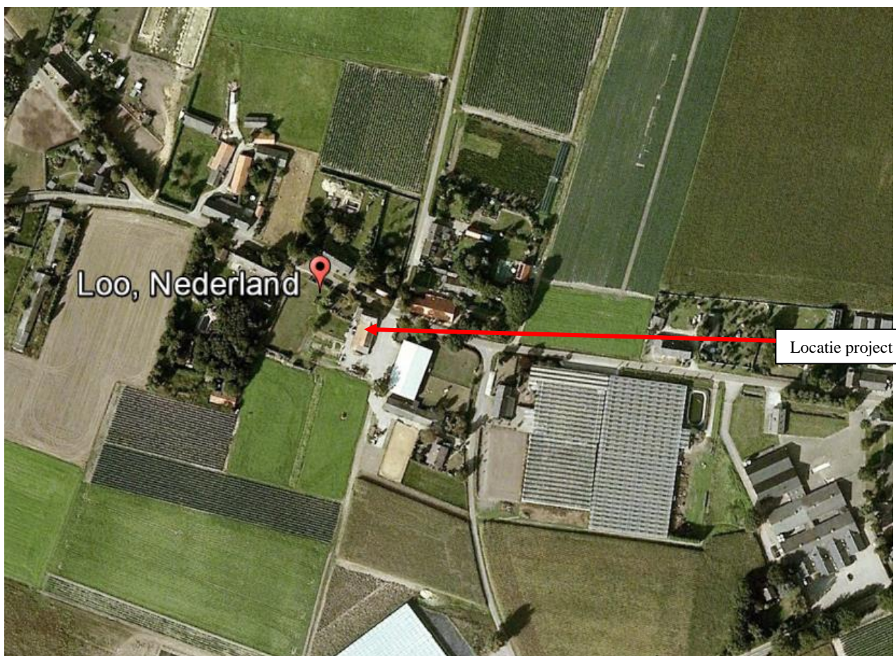
Figuur 1.1 De locatie voor de huisvesting

Vandaar is vanuit het Gemeentelijk Kwaliteitskader de noodzaak van 10 % beplanting benoemd wordt die het project landschappelijk integreren. Het dient een landschappelijke meerwaarde te geven.