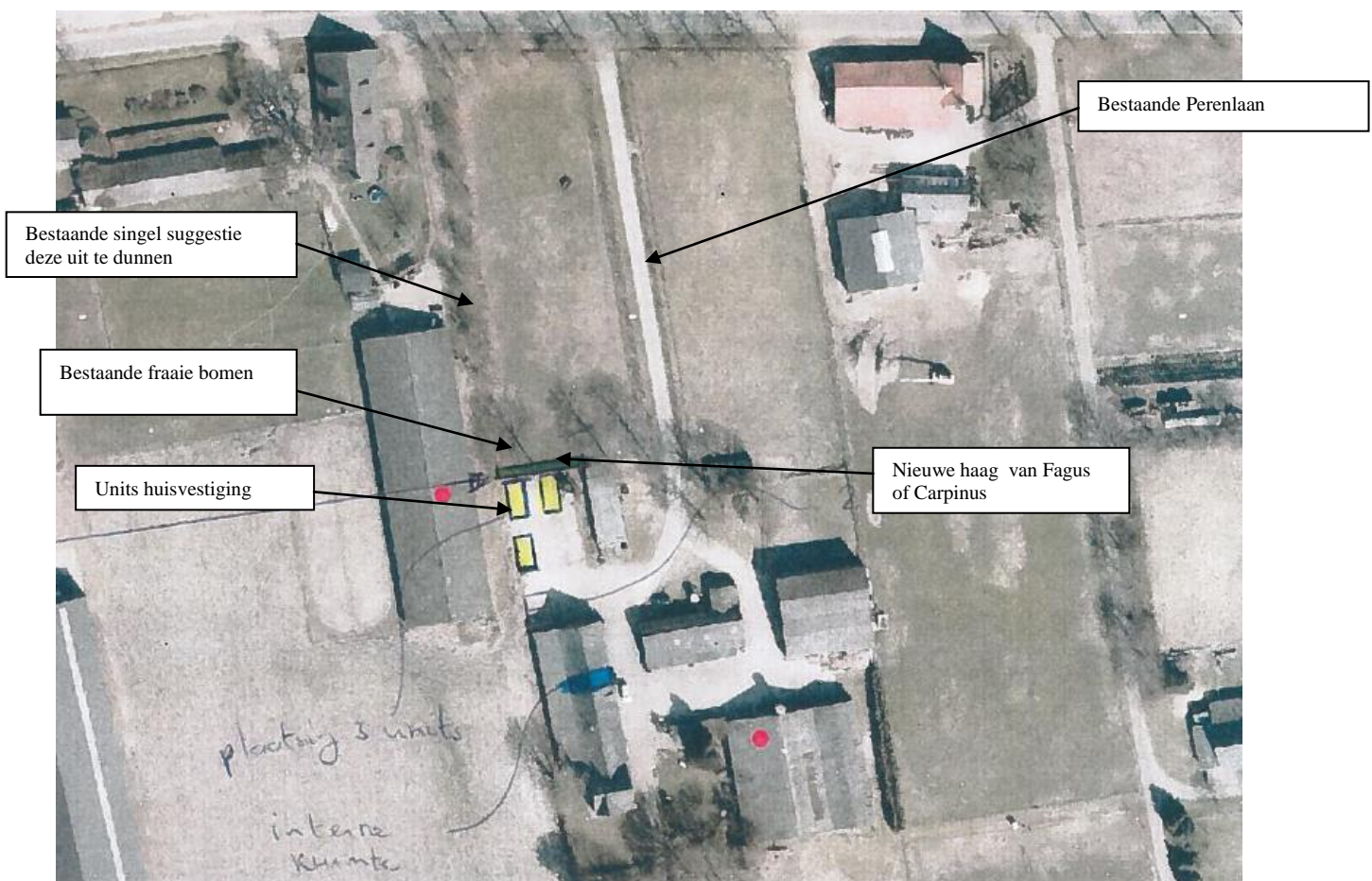
Figuur 2.1 De locatie met bestaand groen en nieuwe haag

Onderstaande schets geeft de locatie en het nieuwe groen weer.