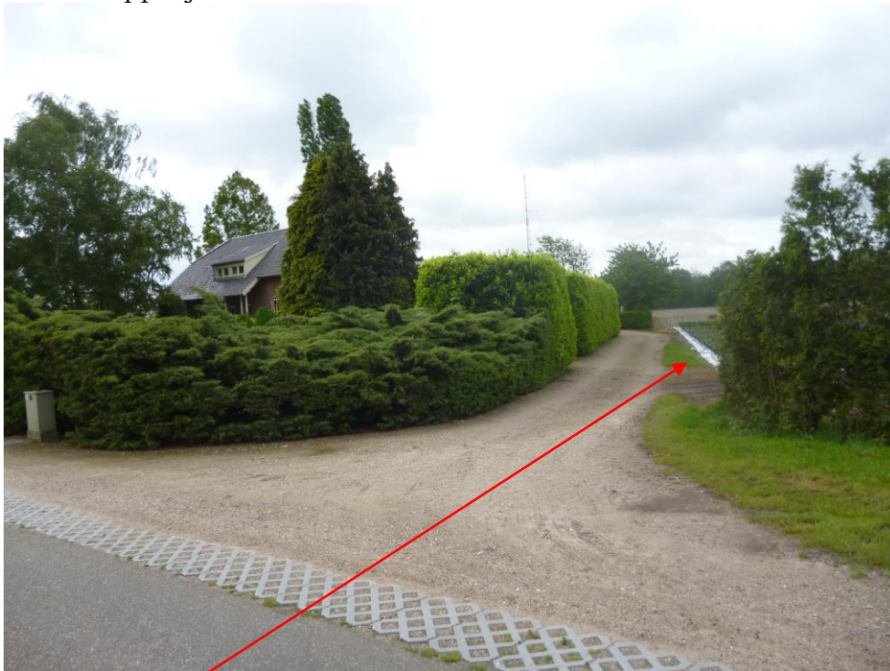
Locatie aanvullende beukenhaag