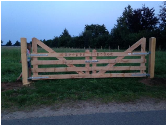
Aanvullende suggestie ter inspiratie..

De suggestie van bomen en een poort zou het geheel nog mooier maken, maar dit is aan de ondernemer om vrijwillig op te pakken.