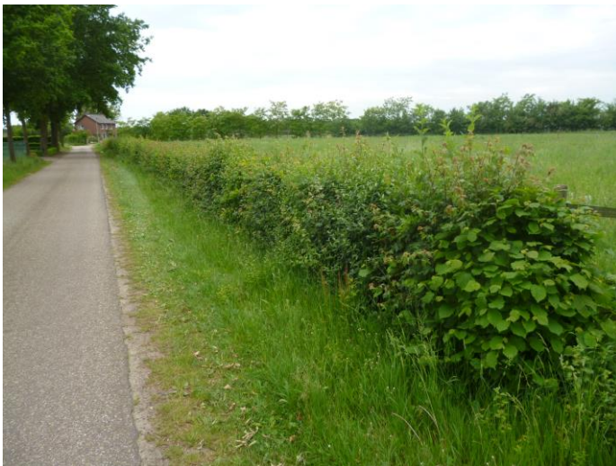
Gemengde haag elders

Bovenstaande foto geeft sfeer haag weer net voor de snoei rond St. Jan.