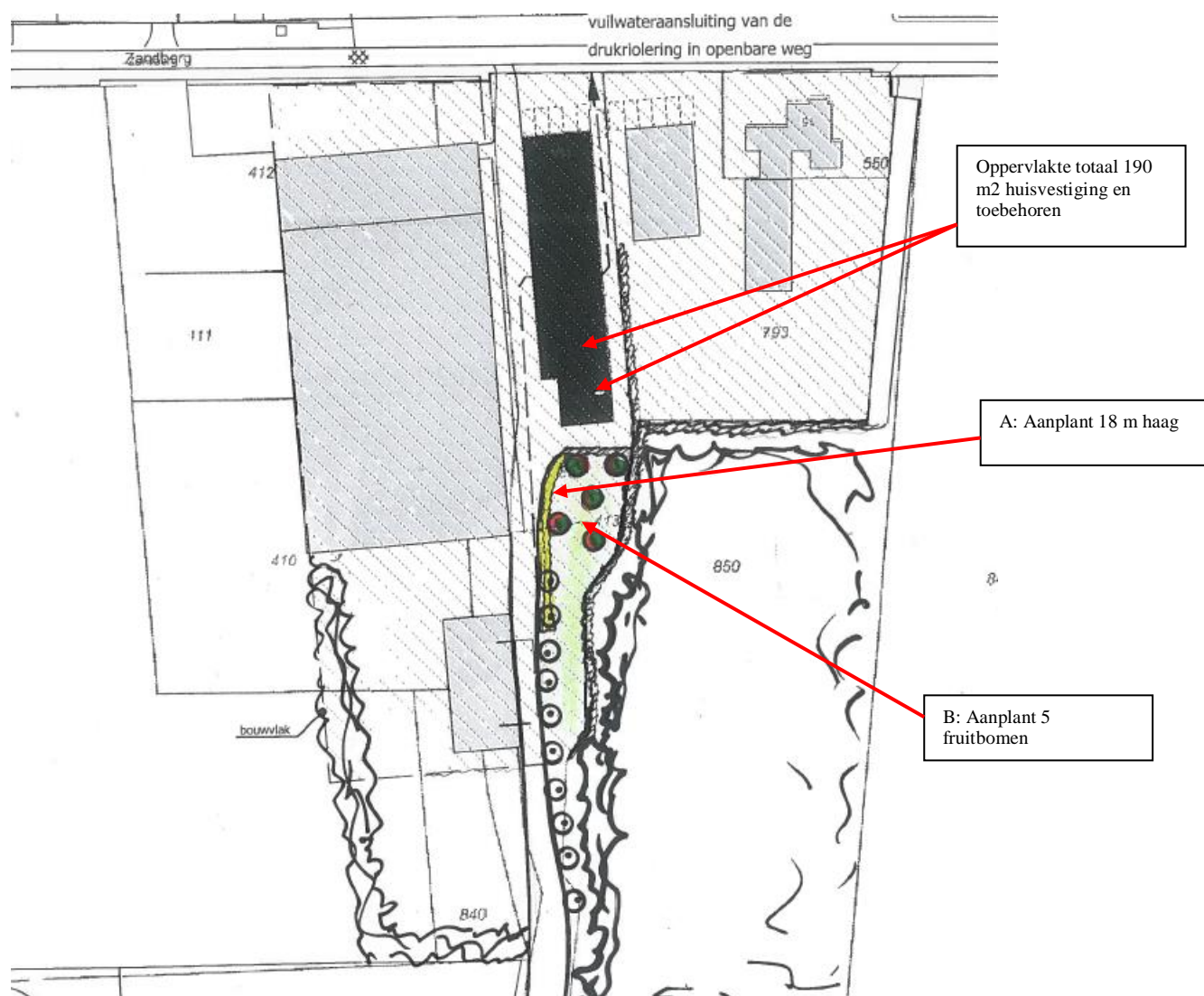
Figuur 3.1 Definitieve landschapsplan

Het definitieve plan neemt het bestaande groen als basis en zorgt voor een begeleiding van de inrit en een rustieke plek voor de mensen. De hoogstambomen geven hier extra beschutting. Wellicht vormt de ondernemer nu ook de coniferenhaag aan de achterzijde van laatste gebouw om of geheel verwijderen, zodat vanuit de keuken en gebouw er direct zicht en contact is met het mooie perceeltje.