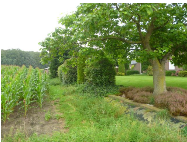
Foto's locatie en omgeving

Bedrijf Nouwen-Buitendijk De Koningstraat 14 5984 NJ Koningslust 077-4652598