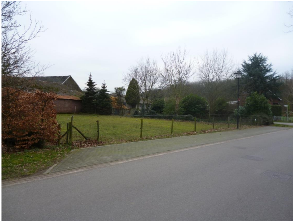
Figuur 10: De groenstrook op de zuid west zijde, met op de voorgrond de drie bomen welke behouden blijven en omkadert met gemengde haag.