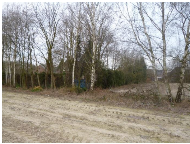
Figuur 14: Kwaliteitsimpuls singel en omvorming coniferenhaag