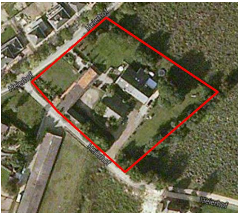
Figuur 1: Plangebied gehele complex (Google maps)