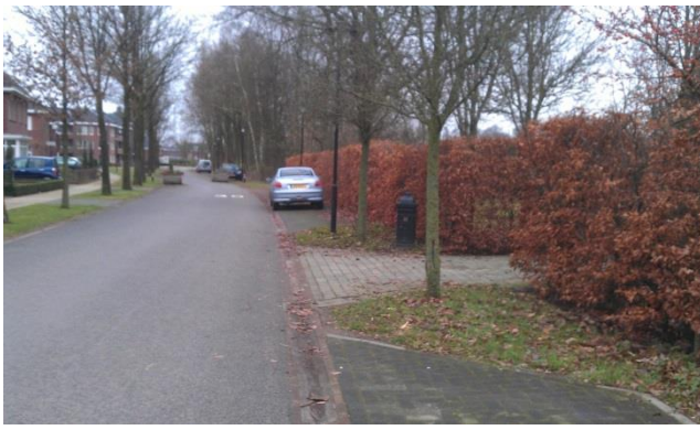
Figuur 7: Aanzicht noordelijk gedeelte van de westkant

De oostzijde van de wooneenheid wordt ingekleed met opgaande bomen en struweel van coniferenachtigen. Onlangs is de entree van deze wooneenheid begeleid door een nieuwe Beukenhaag. Hier stond een verwildert struweel.