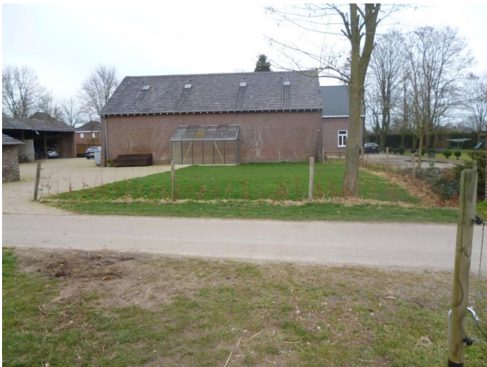
Figuur 13: Aan te planten hoogstam