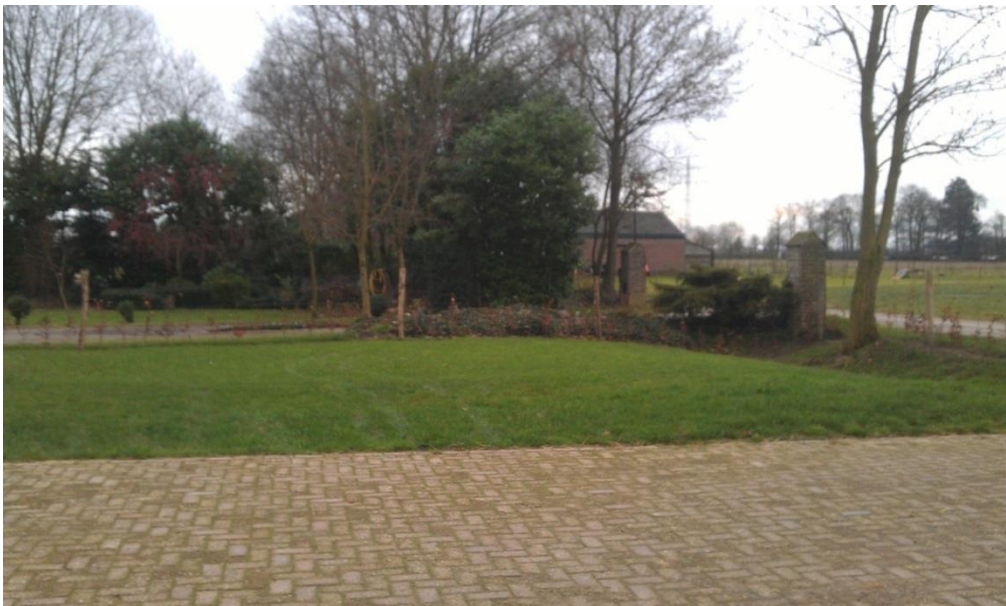
Figuur 7: De nieuwe beukenhaag op de zuidzijde en de verharde oprit, op de achtergrond de verwaarloosde singel (met laurier)

Tevens is de oprit beklinkerd tegelijkertijd met de verharding van de binnenplaats.