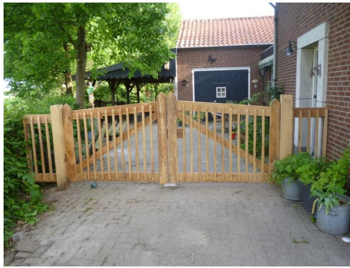
Figuur 8: Voorbeeld poort opritten zuidzijde

Onderstaande plaatjes geven een beeld van de huidige situatie met beoogde kwaliteitsimpuls