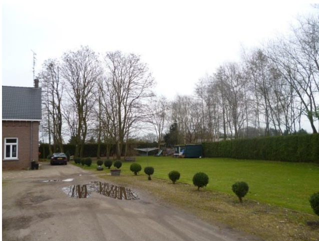
Figuur 16: Begeleiden inrit met haag en lindebomen