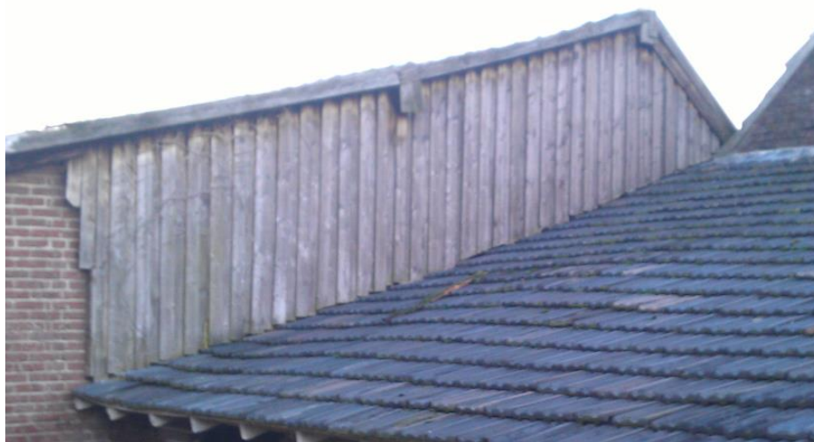
Figuur 5: Houtwerk zuidelijke kopgevel

sterk verbeterd is. De dakconstructie is in prima staat. Wel is zaak, gezien de ouderdom van de dakpannen, om jaarlijks een inspectie te doen op lekkages en dan de pannen die lekken te vervangen. De oostzijde kent geen goot en heeft deze ook nooit (nodig) gehad. De afwatering loopt via de binnenplaats die zoals al aangegeven aanmerkelijk is verbeterd in 2013. De westzijde zal in 2015 nog gedeeltelijk van een goot moeten worden voorzien. Oorspronkelijk stak het dak daar ver over, maar dat is door een ongeluk met een boom in 1992 letterlijk weggevaagd en is toen korter gemaakt. Daardoor kan er bij hevige regenval wel eens water aan de achter kant in beperkte mate naar binnen lopen. Verlengen van het dak naar de oorspronkelijke lengte zou ook een optie zijn, maar een goot is een betere optie om het water af te voeren. Verder dient in de planperiode het houtwerk op de noordelijke kopgevel vernieuwd te worden (zie foto).