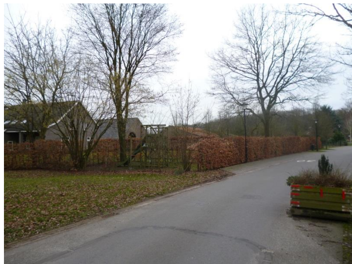
Figuur 9: De Noordzijde van het ensemble met bestaande (uit te breiden) beukenhaag en te vervangen coniferenhaag