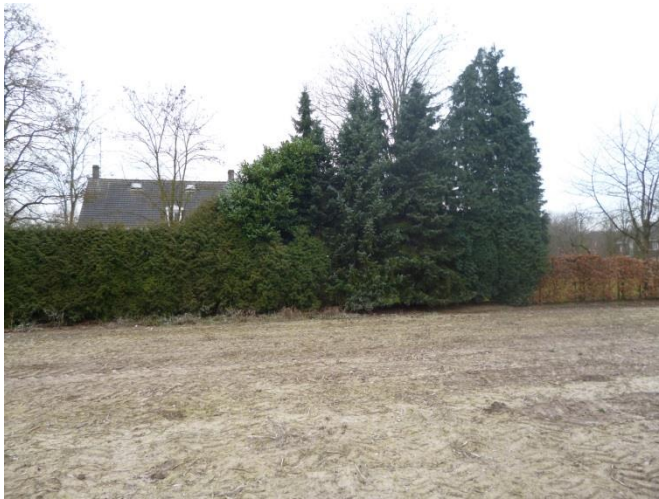
Figuur 15: Omvormen naar Beukenhaag en reduceren coniferen