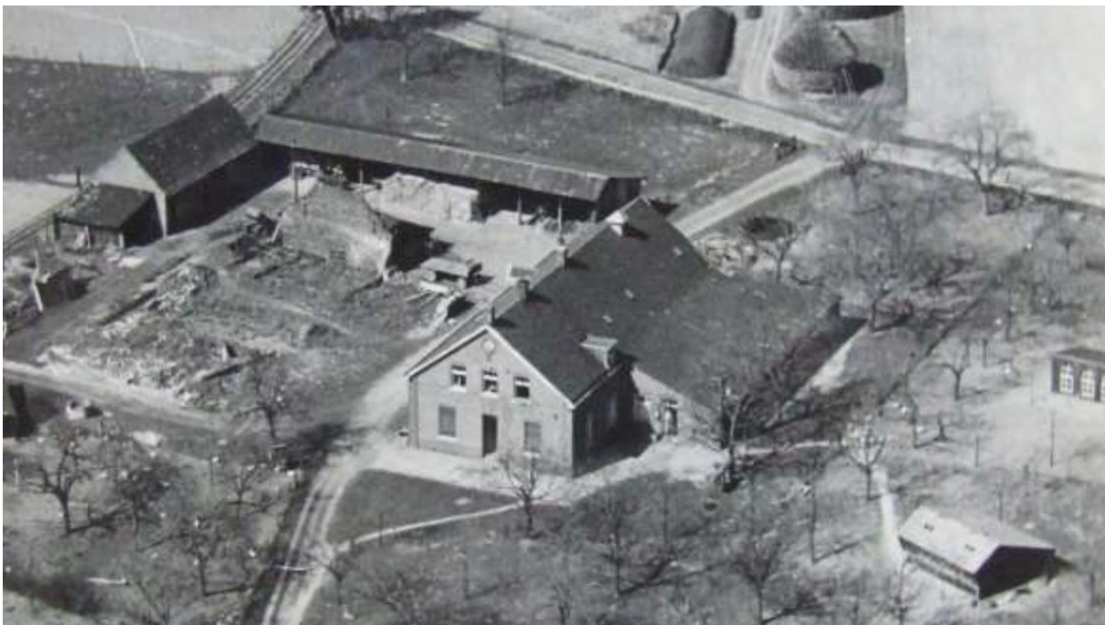
Figuur 4: Luchtfoto omstreeks 1945

De open kapschuur is door de eeuwen heen aan diverse aanpassingen onderhevig geweest, maar heeft zijn oorspronkelijke karakter behouden en heeft in ieder geval nog zijn verschijningsvorm zoals die omstreeks 1945 was (zie onderstaande foto).