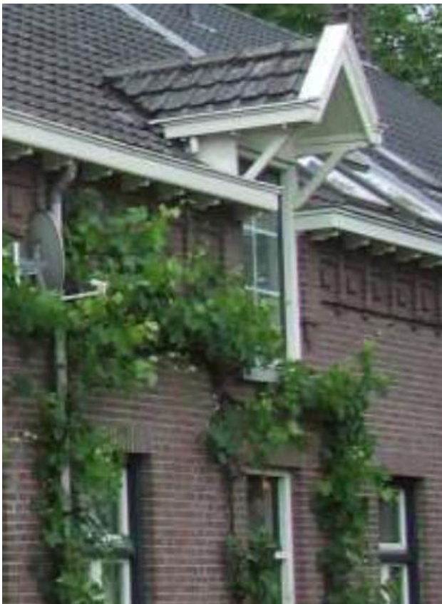
Figur 2: Hooiluik met links de nog niet gerenoveerde bakgoot.

Het dak van Heierhof 25 bevindt zich in prima staat. Dit gedeelte is ook nieuwer dan het al vervangen dak van nummer 27. Dit komt door dat het dak na WOII is vervangen omdat hier brand was geweest (gelijktijdig met het afbranden van de oude boerderij die op de plek van de huidige schuur heeft gestaan). De architect van de verbouwing in 1992 was onder de indruk van de kwaliteit waar dit mee gedaan is, wat in de jaren na WOII zeker geen vanzelfsprekendheid was. De nok van het dak is bij de verbouwing in 1992 vernieuwd. Geïsoleerd is het dak van binnen uit.