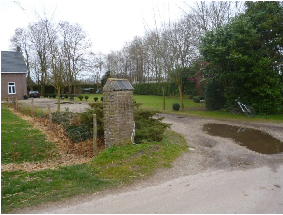
Figuur 12: Begeleiden oprit met haag en lindebomen en verwijderen laurier en mooie poort creëren