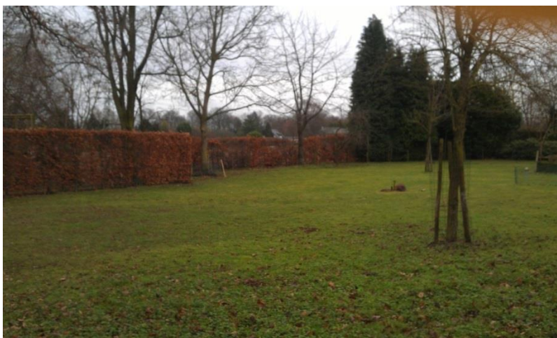
Figuur 11: Aan te vullen hoogstamweide aan de zuid-west zijde