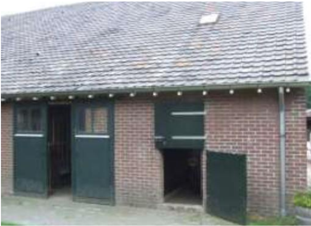
Figuur 3: De noordzijde van de schuur met nieuwe goot en zichtbaar daar onder het houtwerk.