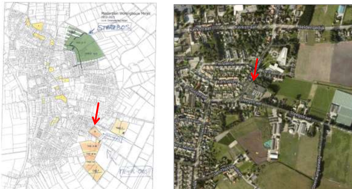
Figuur 1. Het plangebied op de uitsnede van de kadastrale kaart (links) en luchtfoto (rechts). Het plangebied is in beide gevallen met een rode pijl aangeduid.

Aan de oostkant van Meijel is op verschillende locaties woningbouw gepland. Eén van deze locatie is de Steegstraat 15-17 (locatie Beckers). Het plangebied is momenteel bebouwd met een vleeswarenbedrijf welke licht gefundeerd is. De plannen bestaan uit de sloop van de bestaande bebouwing en de inrichting en nieuwbouw van meerdere woningen.