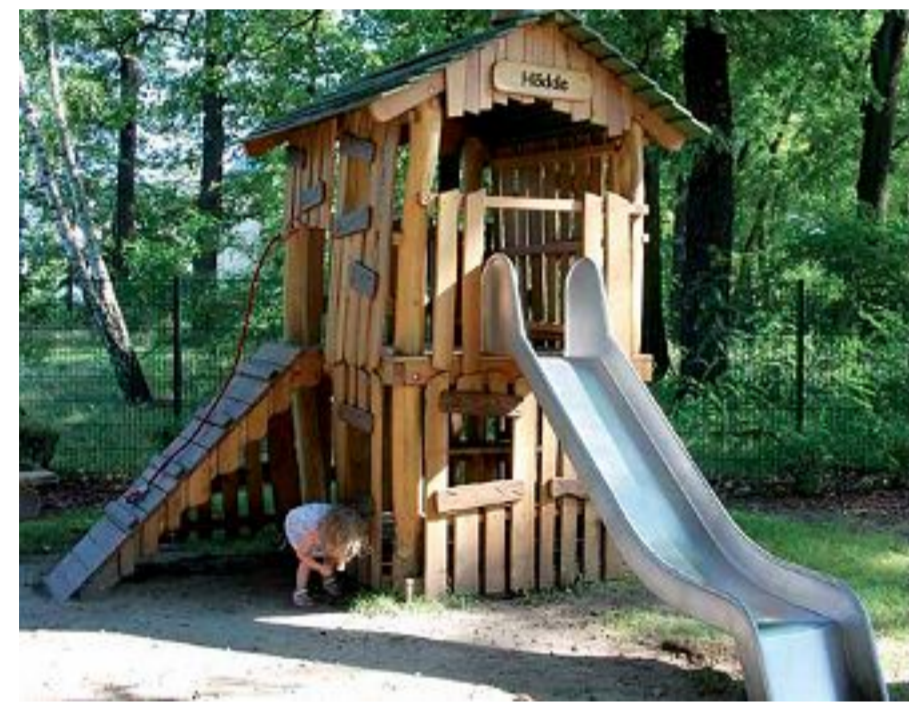
Afb. referentie speeltoestel (glijbaan)