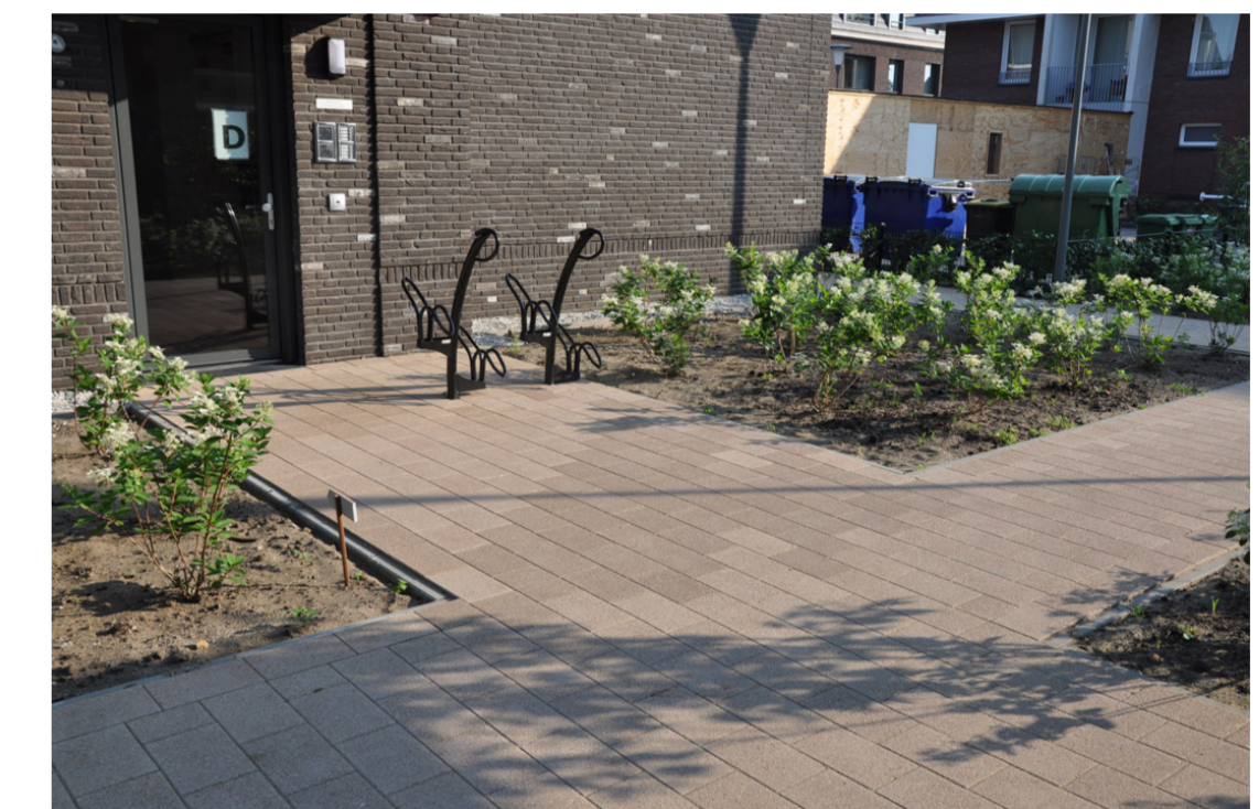
Afb. Referentie rockstone klinker 15x15 cm