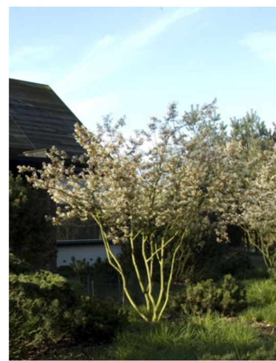
Afb. Solitaire opgeknoorde krenten in blokragen