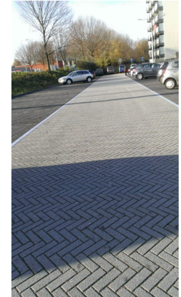
Afb. Referentie rockstone rijweg licht antraciet op parkeerrekken donker antraciet