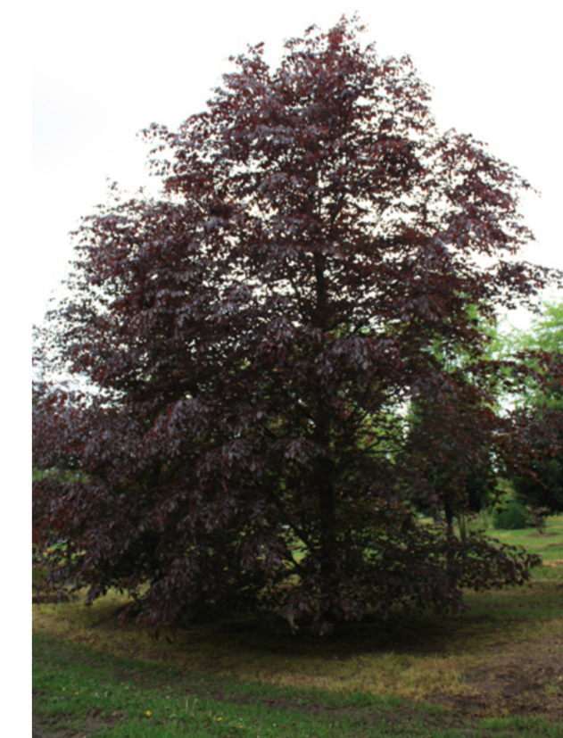
Afb. Referentie rode beuk