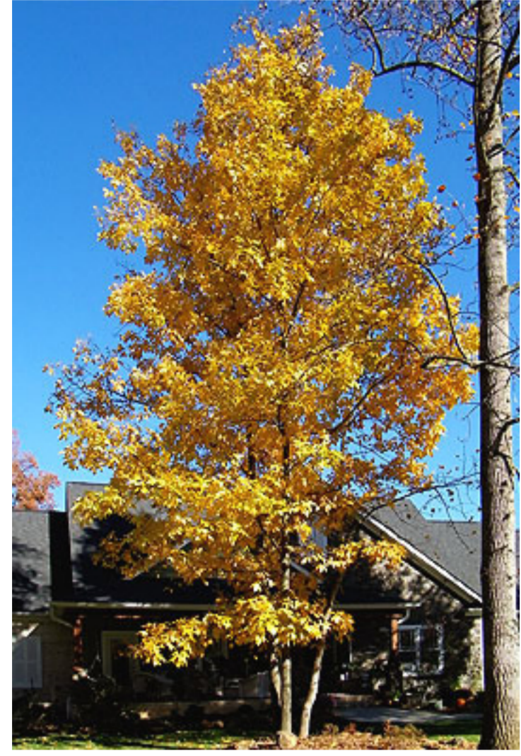
Afb. referentie meestamige boom