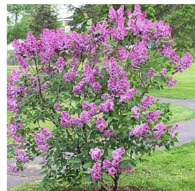
Afb. Referentie solitaire heesters (Kloofje en Spring) tussen heesterrozen