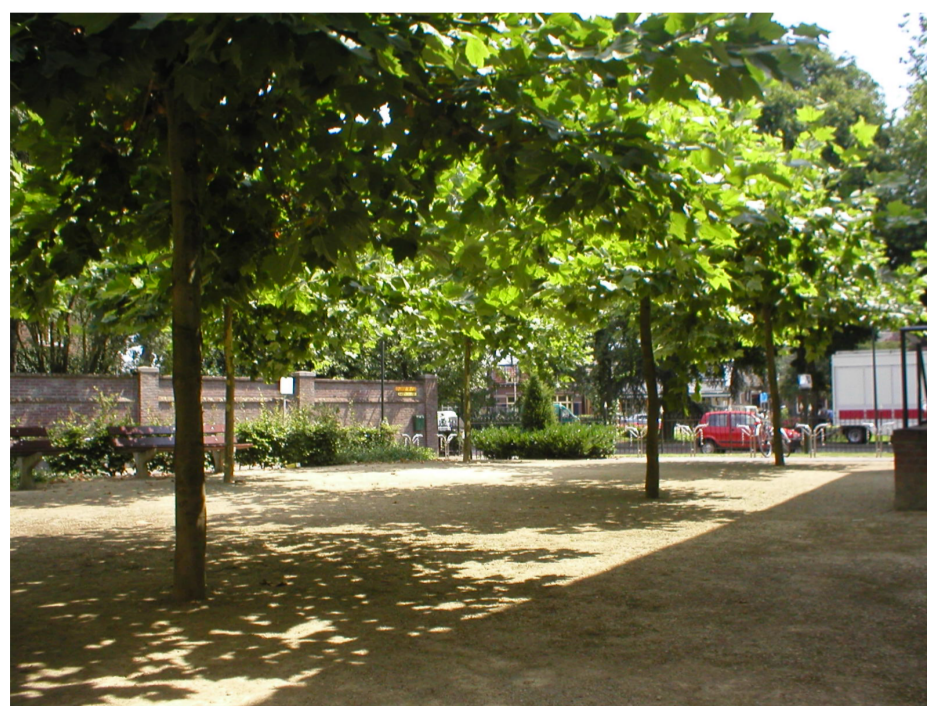
Afb. Referentie halfverhard plein met dakbomen