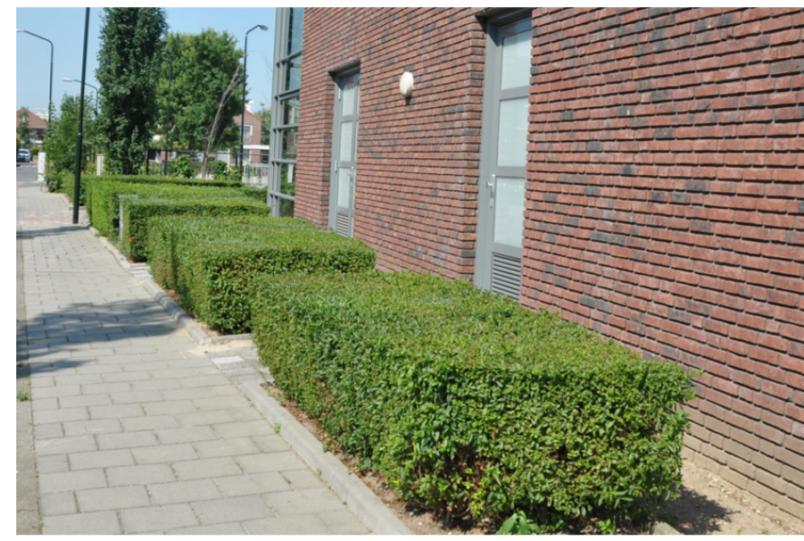
Afb. referentie blokragen van Liguster