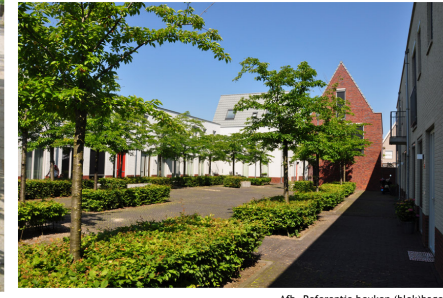
Afb. Referentie beuken (blokragen)