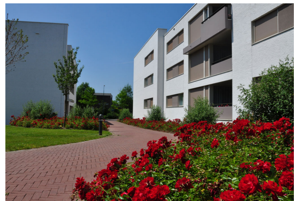
Afb. Referentie heesterrozen