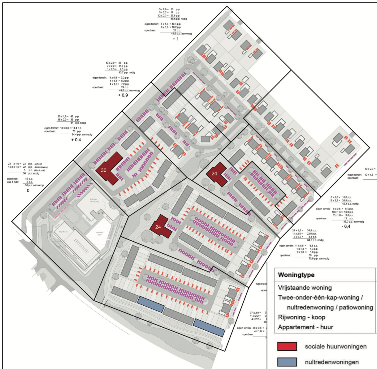
Afbeelding 2: Beoogde toekomstige situatie plangebied fase 8.

Het plangebied betreft fase 8 van de gebiedsontwikkeling 'Zevenhuizen-Zuid'. Het uiteindelijke plan betreft de nieuwbouw van woningen. Momenteel worden hiervoor voorbereidende werkzaamheden uitgevoerd binnen het plangebied. Afbeelding 2 geeft een indruk van de toekomstige situatie van het plangebied.