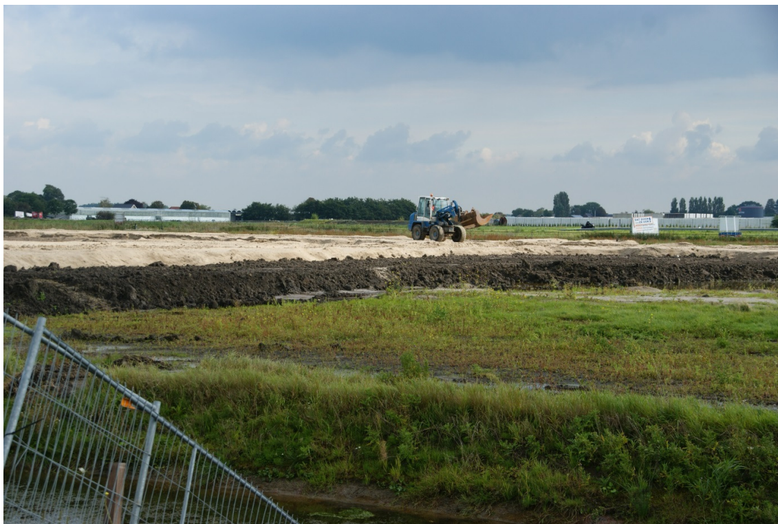
Figuur 2: overzicht plangebied

Hoofdstuk 2 brengt in beeld welke ecologische waarden in en rondom het plangebied aanwezig zijn. In het geval van strikt beschermde soorten, wordt een verkennend onderzoek (ook wel quickscan natuur, natuurtoets en/of flora- en faunatoets genoemd) als onderbouwing bij de aanvraag van een ontheffing door Omgevingsdienst Haaglanden nooit afdoende geacht. Aanvullend veldonderzoek, op die tijdstippen in het seizoen die voor de verscheidene soorten het meest gunstig zijn, is dan noodzakelijk.