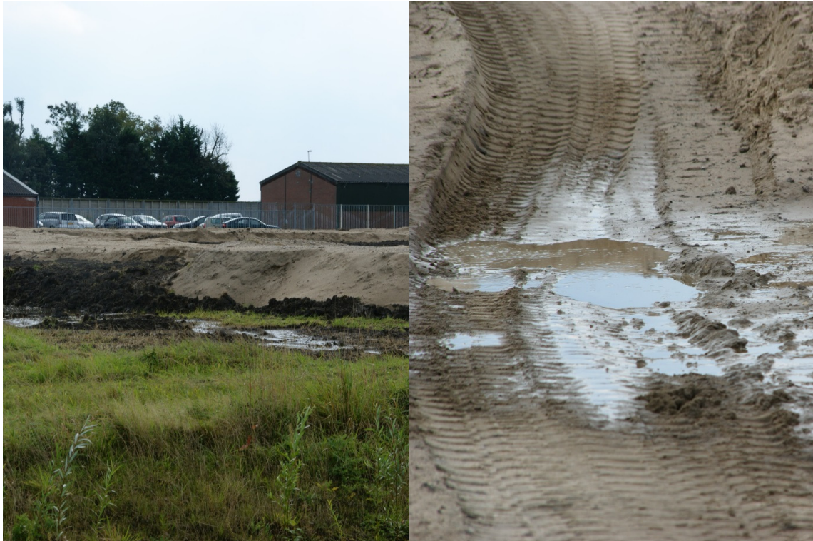
Figuur 3: geschikte voortplantingshabitat voor de rugstreeppad

Het terrein is daarnaast geschikt voor algemeen voorkomende soorten als bruine kikker en pad. Deze algemene soorten behoeven geen extra beschermende maatregelen. Wel dient ten behoeve van die soorten de zorgplicht in acht te worden genomen.