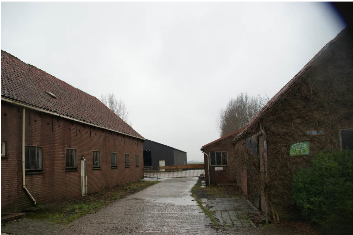
Figuur 5: De aanpandige schuur (links) met diverse schuren eromheen.

Hoogstamfruitbomen bevinden zich in de voortuin van de boerderij langs de oprit naar de provinciale weg. Er zijn ook nog andere grotere bomen aanwezig. Aangenomen wordt dat hier geen ingrepen zullen volgen. Indien het voorerf geheel zal worden heringericht, dient aanvullend onderzoek plaats te vinden naar beschermde natuurwaarden die zich in de daar groeiende bomen ophouden.