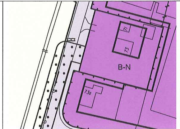
Figuur 2: Uitsnede verbeelding gemeente