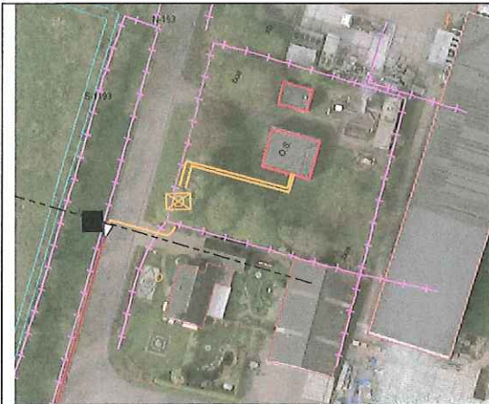
Figuur 1: Ligging volgens Gasunie