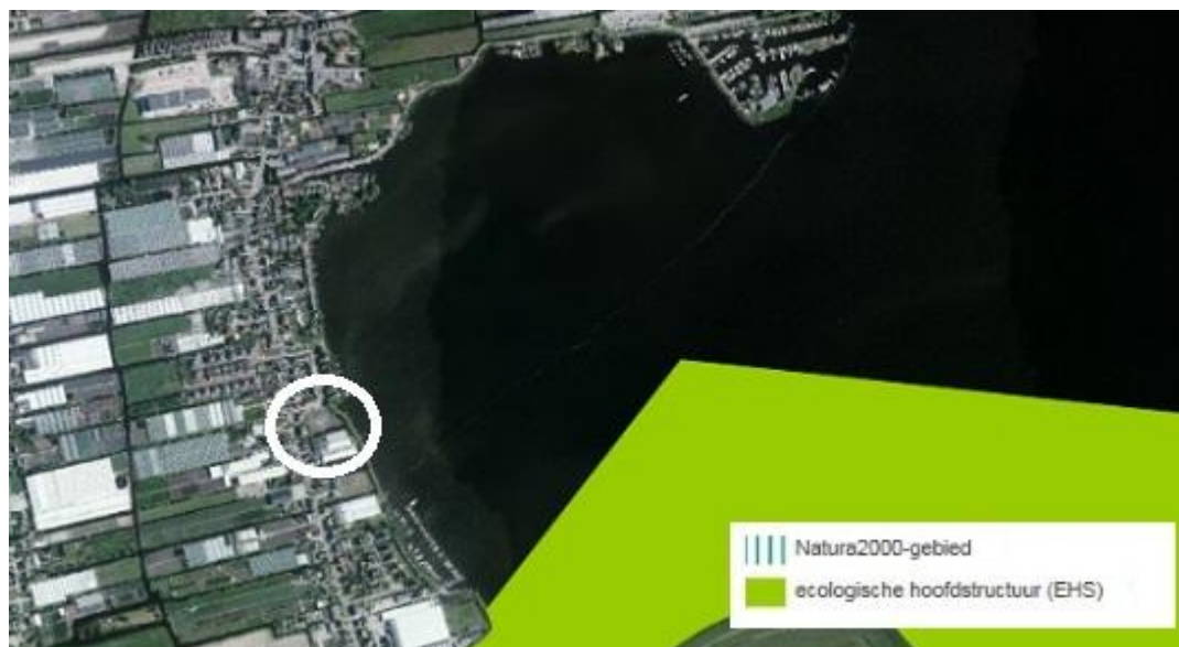
Uitsnede kaart 8: EHS en Natura2000

Zoals onderstaande afbeelding weergeeft is het plangebied gelegen nabij de EHS.