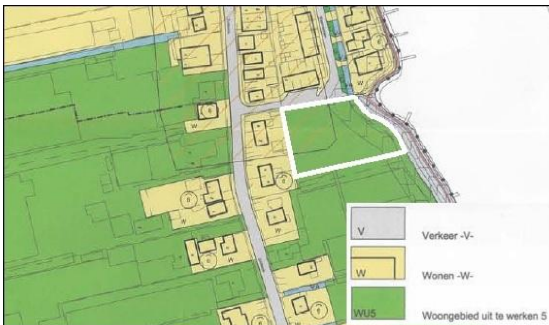
Fragment verbeelding geldend bestemmingsplan 'Braassemerland' (plangebied indicatie binnen wit kader)

In het geldende bestemmingsplan heeft het plangebied de bestemming 'Woongebied uit te werken 5'. De gemeente heeft echter besloten voor het zuidelijk deel van Braassemerland geen uitwerkingen meer te gaan maken en op zoek te gaan naar een passender bestemming voor de gronden. Derhalve kan onderhavig plan niet worden gerealiseerd op basis van de uitwerkingsregels van de bestemming. Daarom is deze ruimtelijke onderbouwning noodzakelijk om het initiatief te kunnen realiseren.