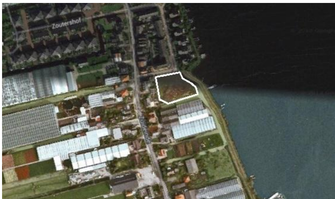
Globale begrenzing plangebied

Het plangebied van voorliggende ruimtelijke onderbouwing bestaat uit een perceel achter het woonperceel Zuideinde 85-89 te Roelofarendsveen, circa 1200 meter ten zuiden van de kern Roelofarendsveen. Het plangebied wordt aan twee zijden omgeven door watergangen en aan de noordzijde ontsloten op de Westmeerlaan. De volgende afbeelding toont de globale begrenzing van het plangebied.