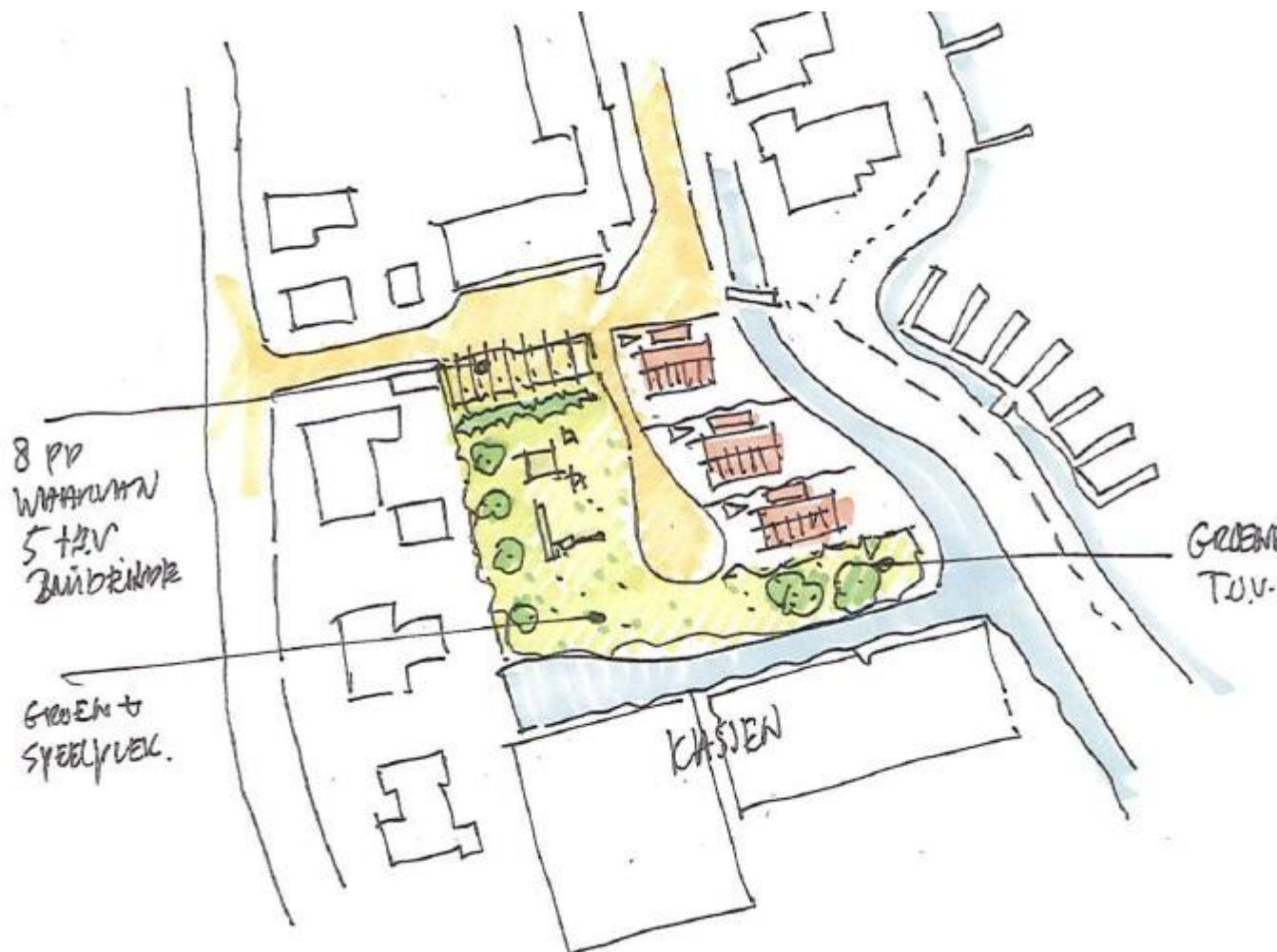
Schets terreinindeling plangebied

Het initiatief gaat uit van drie vrijstaande woningen, acht parkeerplaatsen, een groene speelplek en een groene buffer ten opzichte van de naastgelegen kassen. De woningen zullen via een toegangsweg worden ontsloten op de Westmeerlaan. Van de acht te realiseren parkeerplaatsen zullen er vier ten behoeve van de nieuwe ontwikkeling nodig zijn. De overige parkeerplaatsen zijn nodig ter vervanging van de bestaande langparkeerplaatsen.