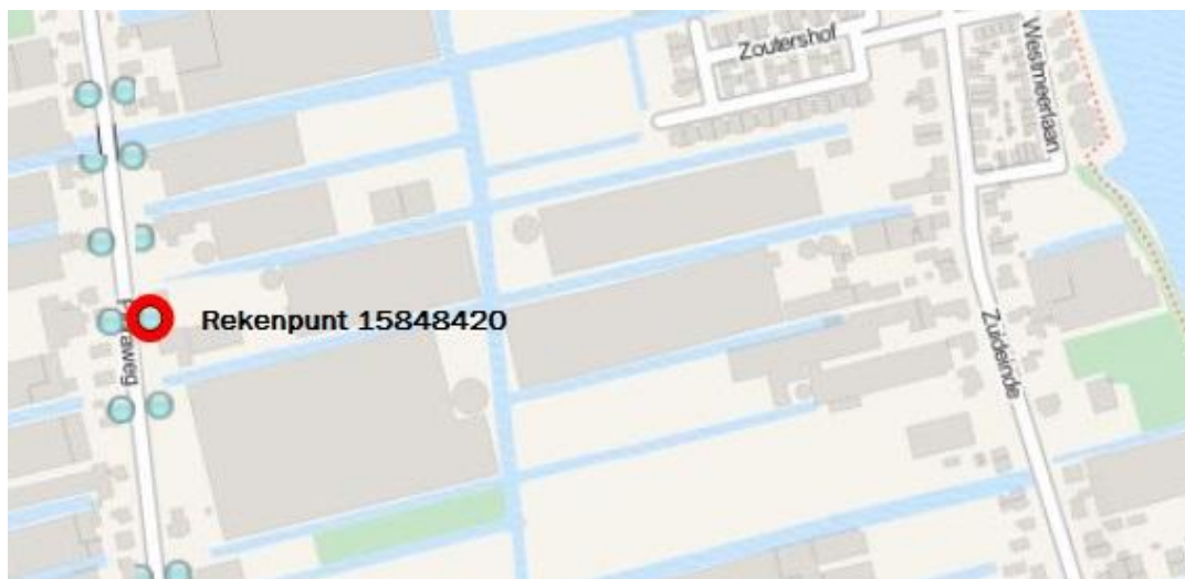
Uitsnede NSL-kaart (ligging rekenpunt)