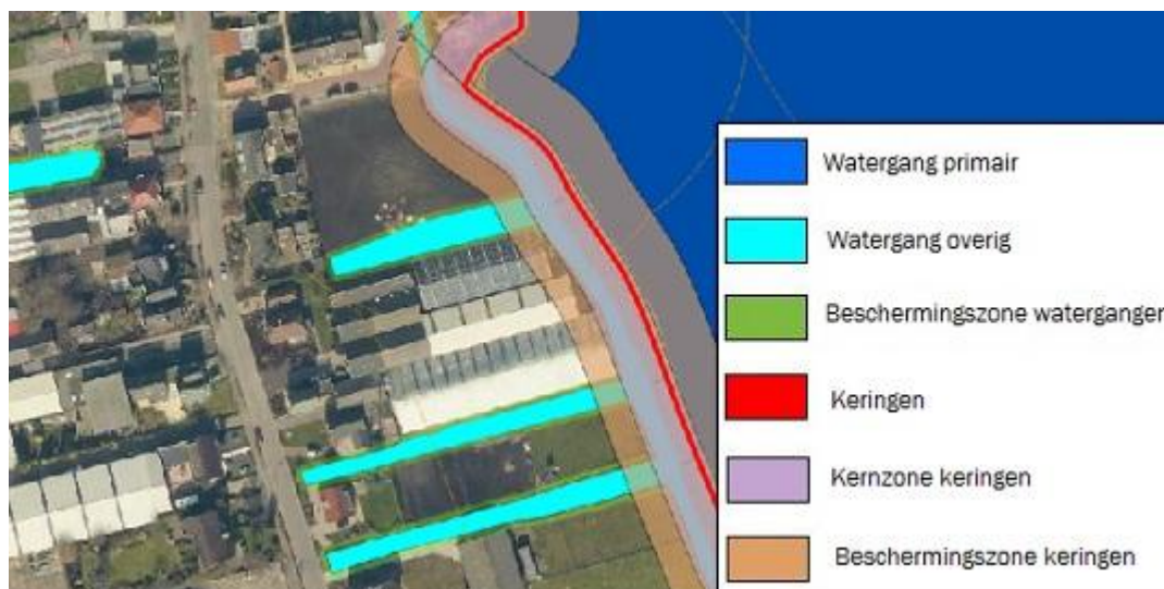
Uitsnede legger hoogheemraadschap

De volgende afbeelding toont een fragment van de legger van het Hoogheemraadschap van Rijnland.