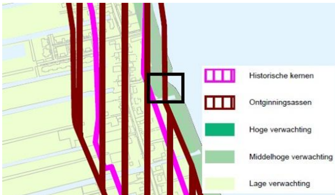
Uitsnede beleidskaart (plangebied binnen zwart kader)

Het plangebied valt grotendeels in een ontginningsas en een gedeelte met middelhoge verwachting. Binnen de ontginningsas geldt een onderzoeksverplichting bij bouwwerken groter dan 150m 2 en 30cm diep. Binnen de middelhoge verwachtingswaarde geldt een onderzoeksverplichting bij bouwwerken groter dan 2.500m 2 en 30cm diep.