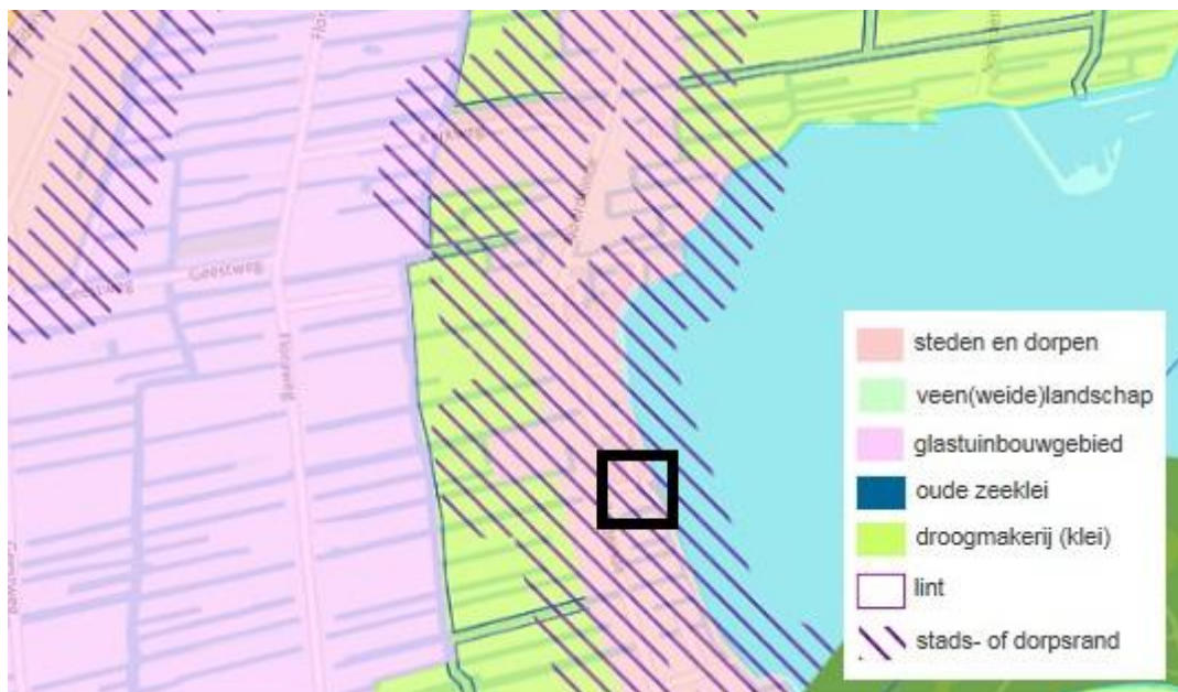
Uitsnede VRM (plangebied binnen zwart kader)

Het plangebied ligt binnen de bebouwde ruimte en in de stads- of dorpsrand. De stads- en dorpsrand is de zone op de grens van bebouwd gebied en landschap. Het is het deel van een stad of dorp met potentie voor een hoogwaardig en geliefd woonmilieu, doordat hier de genoegens van stedelijk en buiten wonen bij elkaar komen. De realisatie van drie vrijstaande woningen en groenzone met speelplaats is goed passend in een dergelijk gebied.