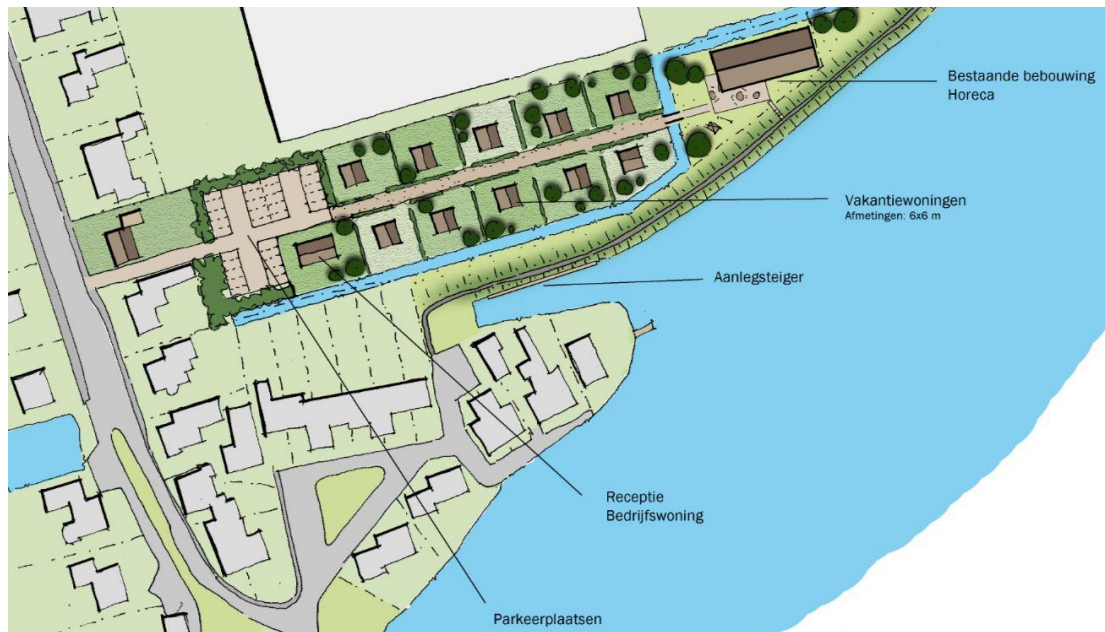
Schets toekomstige situatie (vakantiewoningen, receptie en bedrijfswoning maken geen deel uit van fase 1)