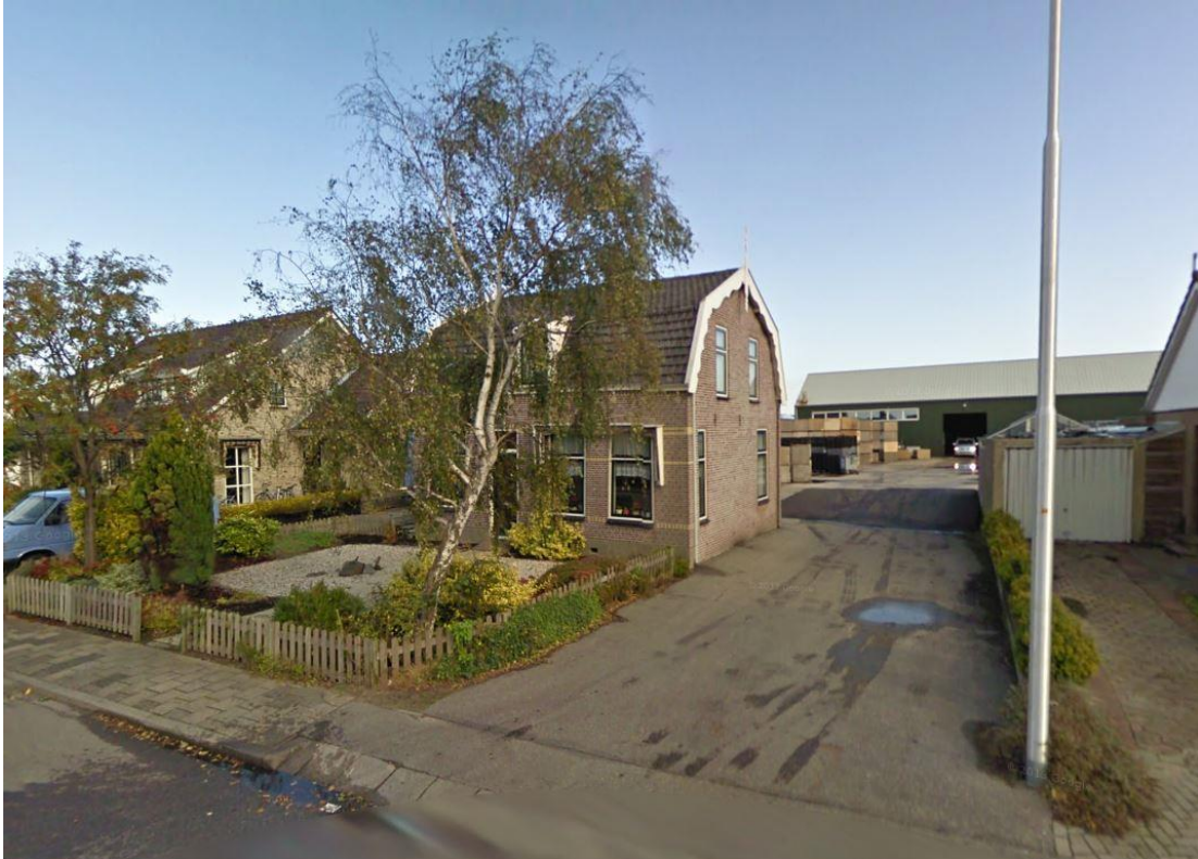
Voorzijde perceel Zuideinde 24

Het perceel aan het Zuideinde 119 is circa 0,7 ha groot. Van oudsher is hier een groot tuindersbedrijf gevestigd, waarbij de woning aan het Zuideinde 119 dient als bedrijfswoning. Langs deze woning vindt de ontsluiting van het plangebied plaats met het Zuideinde.