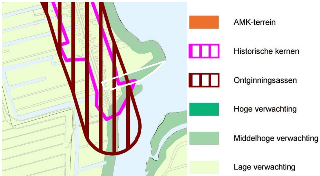
Uitsnede beleidskaart (plangebied witte omkadering)

Uit raadpleging van de archeologische beleidskaart blijkt dat het plangebied onderdeel uitmaakt van historische kernen en ontginningsassen. Tevens geldt er een hoge archeologische verwachting voor een deel van het plangebied. Voor ontwikkelingen binnen het gebied historische kernen en ontginningsassen geldt dat wanneer deze groter zijn dan 150 m 2 en dieper dan 0,3 m onder maaiveld, archeologisch onderzoek noodzakelijk is. Voor ontwikkelingen binnen een gebied met een hoge archeologische verwachting, geldt dat archeologisch onderzoek noodzakelijk is wanneer bodemingrepen groter zijn dan 500 m 2 en dieper dan 0,3 cm onder maaiveld.