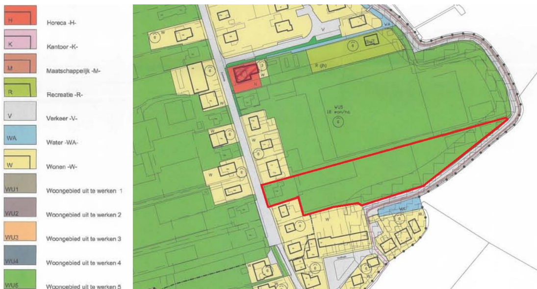
Uitsnede geldend bestemmingsplan (globale begrenzing plangebied: rode omkadering)

Het plangebied ligt binnen de plangrenzen van het geldende bestemmingsplan 'Braassemerland'. Dit bestemmingsplan is op 1 oktober 2008 vastgesteld door de raad van de voormalige gemeente Alkemade en op 9 juni 2009 gedeeltelijk goedgekeurd door Gedeputeerde Staten van Zuid-Holland. De volgende afbeelding toont een fragment van de verbeelding van het geldende bestemmingsplan.