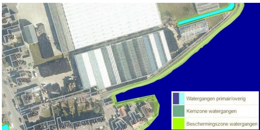
Uitsnede legger hoogheemraadschap van Rijnland

Uit raadpleging van de legger van hoogheemraadschap van Rijnland blijkt dat het plangebied naast een primaire watergang ligt. Derhalve is sprake van een beschermingszone van 5 meter. Voorliggend initiatief bevat onder andere de aanleg van een steiger. Het aanleggen van steigers is toegestaan in de beschermingszone, mits voldaan wordt aan de voorwaarden onder de voorwaarden onder de algemene regel van regel 6 van de keur.