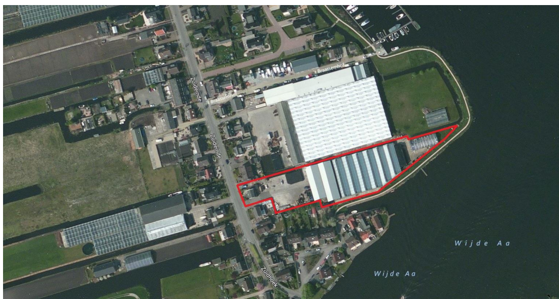
Globale begrenzing plangebied rode omkadering

Het plangebied wordt voornamelijk omgeven door woningen en enkele glastuinbouwbedrijven. De woningen zijn met name aan de zuid- en westzijde van het plangebied gesitueerd, langs het Zuideinde. De tuinbouwbedrijven bevinden zich voornamelijk aan de noordelijke- en westelijke zijde van het plangebied. Aan de oostzijde grenst het plangebied aan het Braassemermeer, daar waar deze via het Paddegat overloopt tot de Wijde Aa.