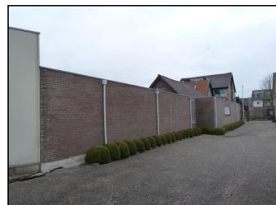
Figuur 8. Achterzijde garageboxen.