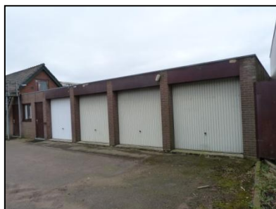
Figuur 7. Garageboxen.