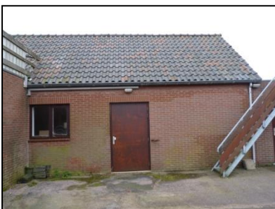
Figuur 6. Schuur op onderzoekslocatie.