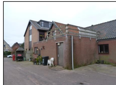
Figuur 5. Berging met ervoor een bijgebouw aan de noordzijde.