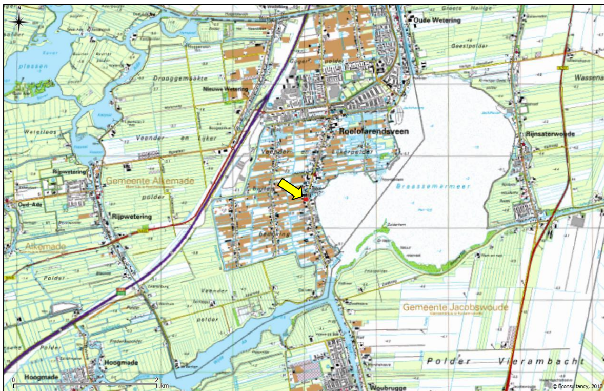
Figuur 1. Topografische ligging van de onderzoekslocatie.

Volgens de topografische kaart van Nederland, kaartblad 31 A (schaal 1:25.000), zijn de coördinaten van het midden van de onderzoekslocatie X = 103.012 , Y = 467.398 . In figuur 1 is de topografische ligging van de onderzoekslocatie weergegeven.