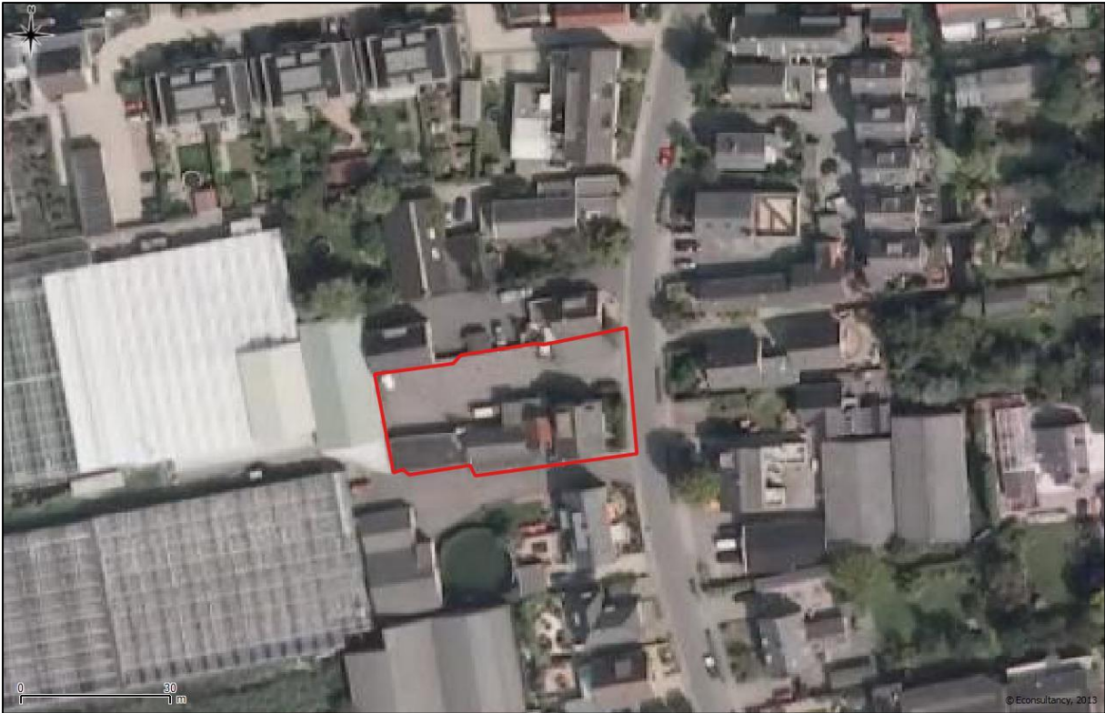
Figuur 2. Luchtfoto onderzoekslocatie en directe omgeving.