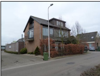
Figuur 3. Woonhuis op onderzoekslocatie.