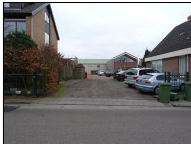
Figuur 4. Verhard terrein aan noordzijde.