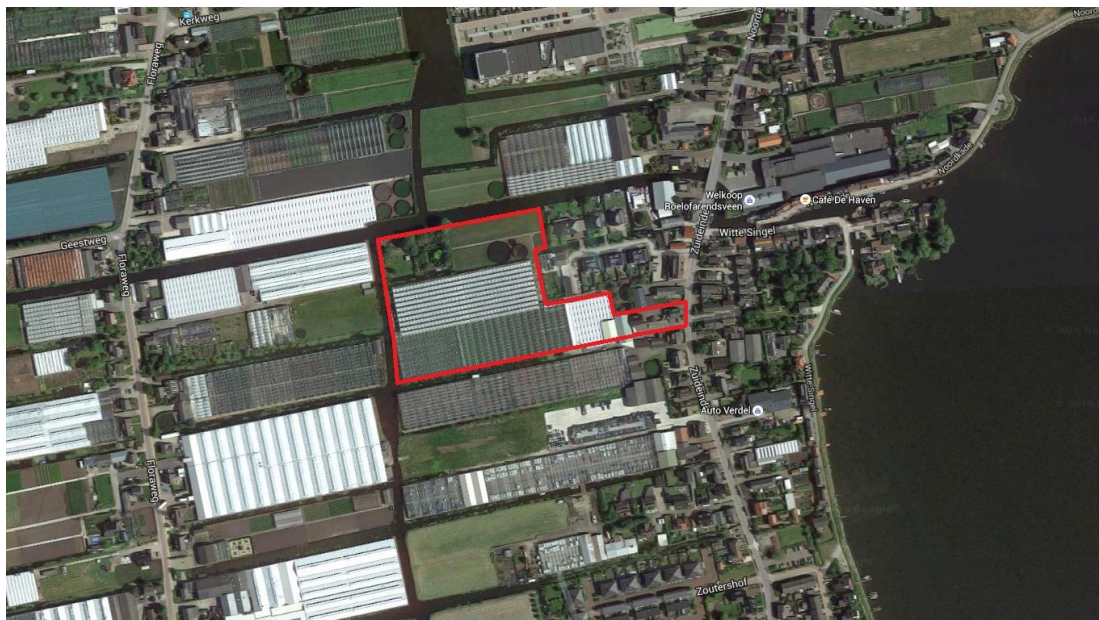
Globale begrenzing plangebied rode omkadering

Het plangebied wordt voornamelijk omgeven door woningen en enkele glastuinbouwbedrijven. De woningen zijn met name aan de oostzijde van het plangebied gesitueerd, langs het Zuideinde. De tuinbouwbedrijven bevinden zich voornamelijk aan de westelijke zijde van het plangebied.