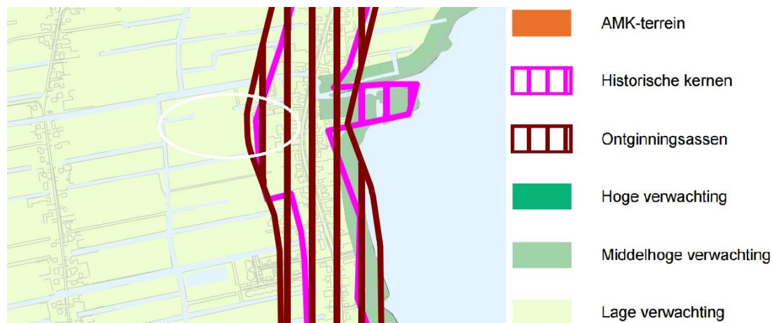
Uitsnede beleidskaart (plangebied witte ovaal)

In mei 2011 is het archeologiebeleid van de gemeente Kaag en Braassem vastgesteld. In het kader van een aantal bestemmingsplanprocedures en het voornemen tot vaststellen van een erfgoedverordening is het archeologiebeleid van de gemeente Kaag en Braassem geëvalueerd. Op basis van deze evaluatie zijn de ondergrenzen herijkt en de archeologische verwachting op bepaalde plaatsen in de gemeente aangepast. Vervolgens heeft de gemeenteraad op 13 mei 2013 deze herziening van het beleid vastgesteld.