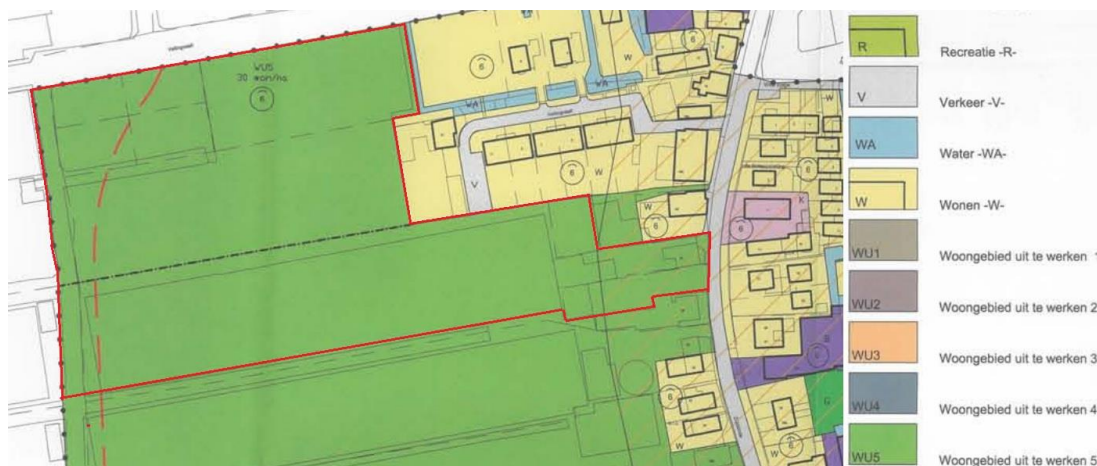
Uitsnede geldend bestemmingsplan (globale begrenzing plangebied: rode omkadering)

Het plangebied ligt binnen de plangrenzen van het geldende bestemmingsplan 'Braassemerland'. Dit bestemmingsplan is op 1 oktober 2008 vastgesteld door de raad van de voormalige gemeente Alkemade en op 9 juni 2009 gedeeltelijk goedgekeurd door Gedeputeerde Staten van Zuid-Holland. De volgende afbeelding toont een fragment van de verbeelding van het geldende bestemmingsplan.