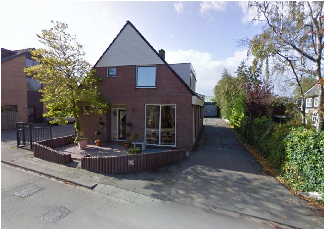
Voorzijde perceel Zuideinde 24

Het perceel aan het Zuideinde 24 is circa 2,4 ha groot. Van oudsher is hier een groot tuindersbedrijf gevestigd, waarbij de woning aan het Zuideinde 24 dient als bedrijfswoning. Langs deze woning vindt de ontsluiting van het plangebied plaats met het Zuideinde.