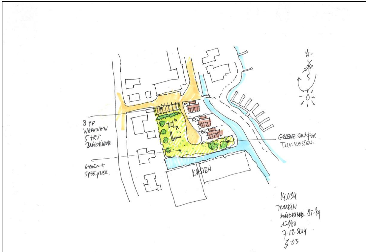
Figuur 7. Inrichtingsschets van de toekomstige situatie.

De initiatiefnemer is voornemens op de onderzoekslocatie drie woningen te realiseren met bijbehorende tuinen. Daarnaast zal aan de zuidwestzijde een speelveld te realiseren en aan de noordwestzijde 8 parkeerplaatsen. In figuur 7 is een inrichtingsschets weergegeven van de toekomstige situatie.