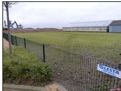
Figuur 4. Perceel vanaf noordwesten.