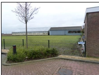
Figuur 6. Westgrens onderzoekslocatie.