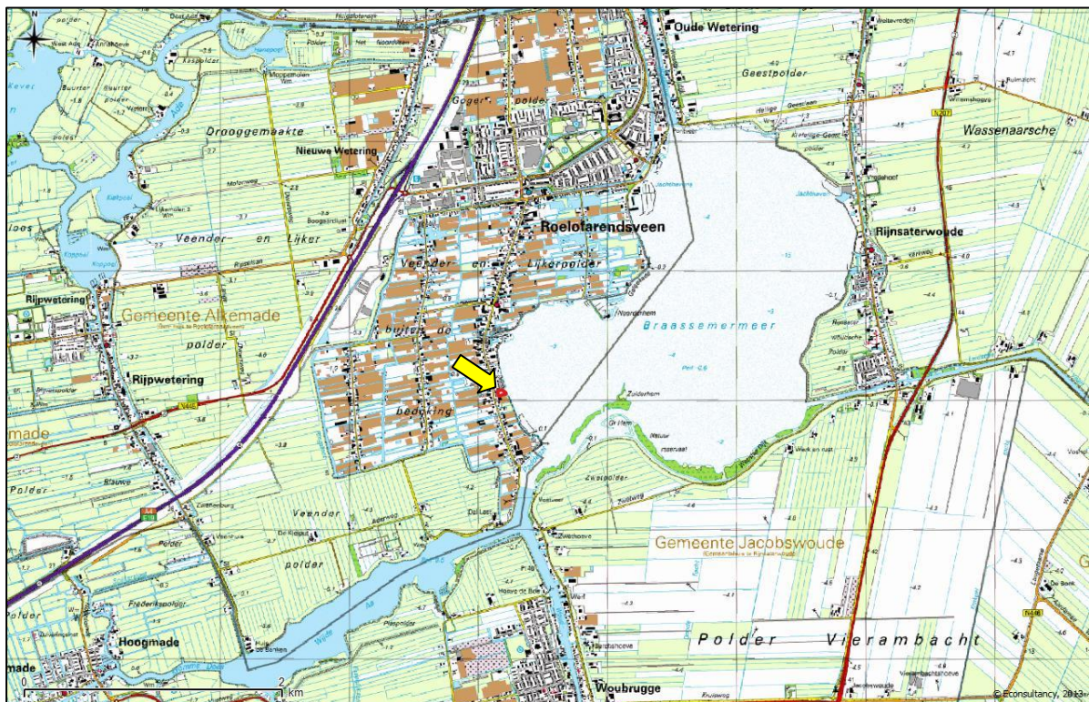
Figuur 1. Topografische ligging van de onderzoekslocatie.

Volgens de topografische kaart van Nederland, kaartblad 31 A (schaal 1:25.000), zijn de coördinaten van het midden van de onderzoekslocatie X = 103.175 , Y = 467.057 . In figuur 1 is de topografische ligging van de onderzoekslocatie weergegeven.