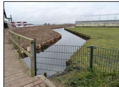
Figuur 5. Oostelijk gelegen waterloop.