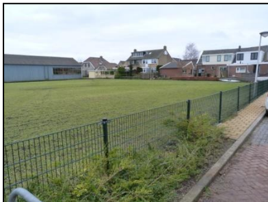
Figuur 3. Onderzoekslocatie vanaf noordoosten.