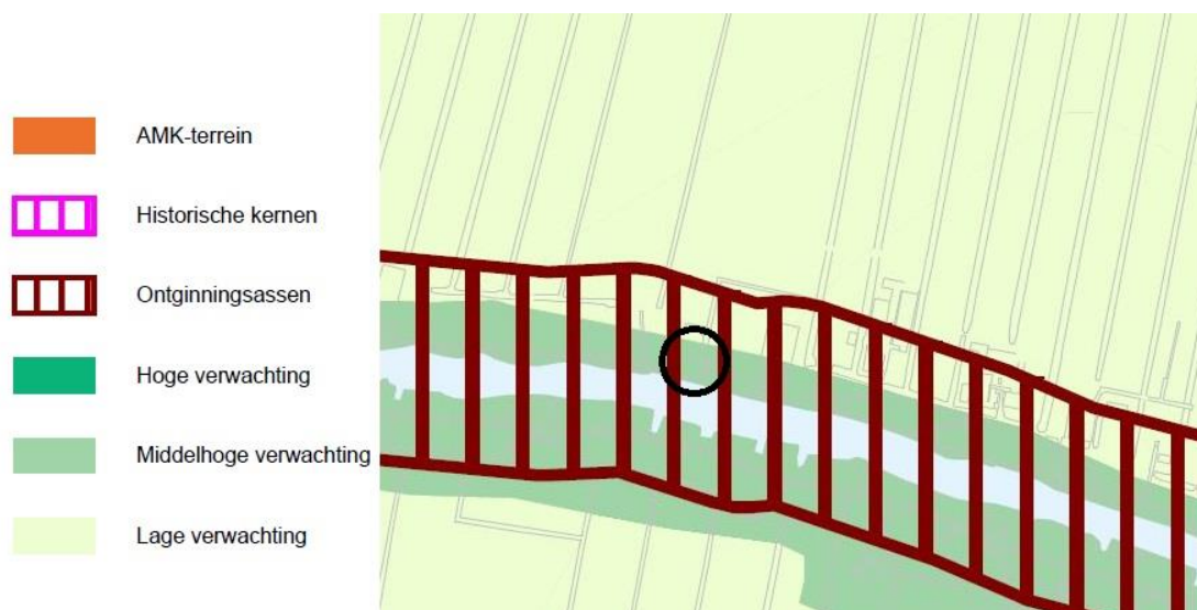
Uitsnede archeologische beleidsadvieskaart (plangebied zwart omcirkeld)

Navolgende afbeelding toont een uitsnede van de archeologische beleidsadvieskaart van Kaag en Braassem.