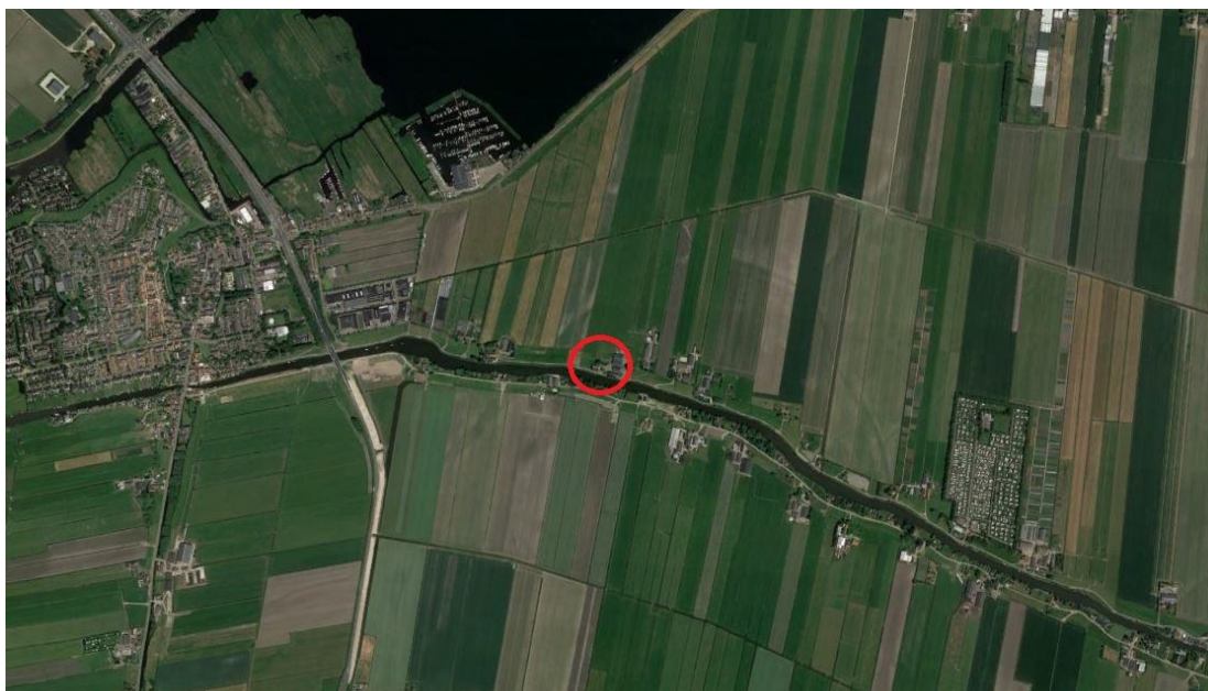
Globale ligging plangebied (rood omcirkeld)

De navolgende afbeeldingen geven de globale ligging en de globale begrenzing van het plangebied weer.