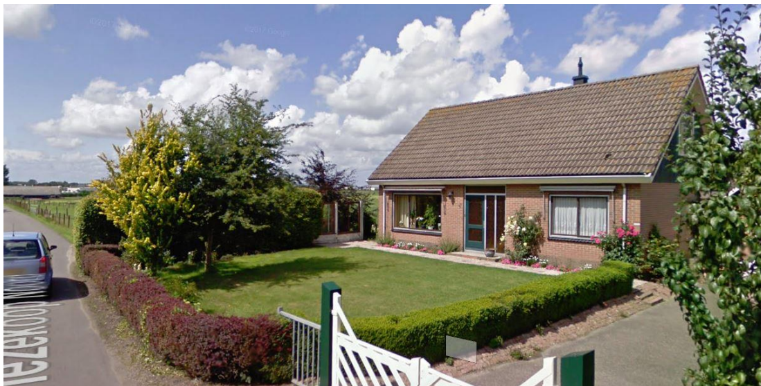
Huidige situatie woning en tuin Vriezeloop Noord 4b