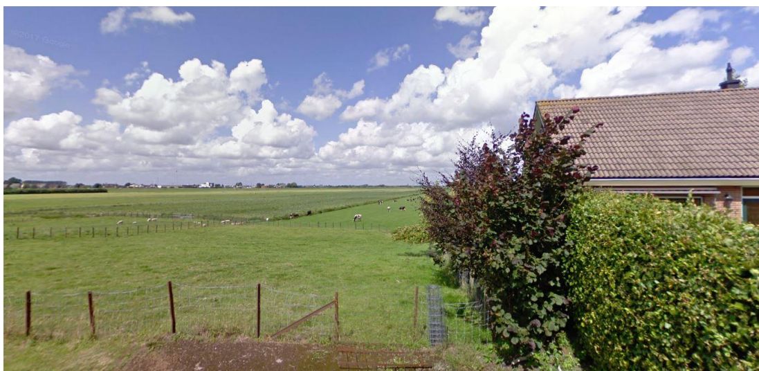
Planlocatie gezien vanaf Vriezeloop Noord met aan de rechterzijde de woning aan de Vriezeloop Noord 4b

Navolgende afbeeldingen tonen de huidige situatie van het plangebied en de woning met tuin aan de Vriezeloop Noord 4b.