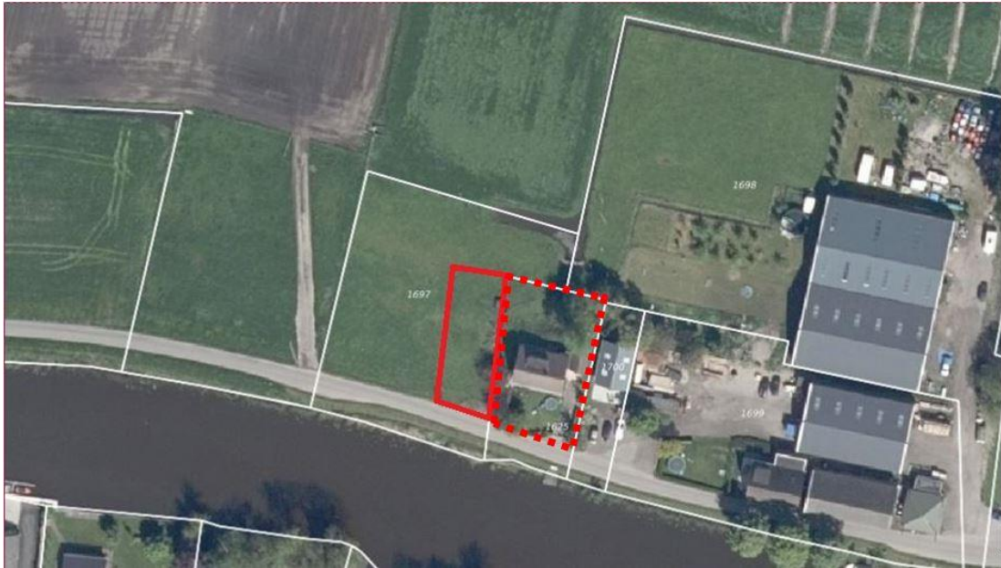
Globale begrenzing plangebied

Voorgaande afbeelding toont de planlocatie. Het rood omlijnde gebied betreft de grond die omgezet dient te worden naar een woonbestemming. Deze wordt betrokken bij het gebied dat reeds bestemd is voor wonen (omkaderd met rode stippellijn).