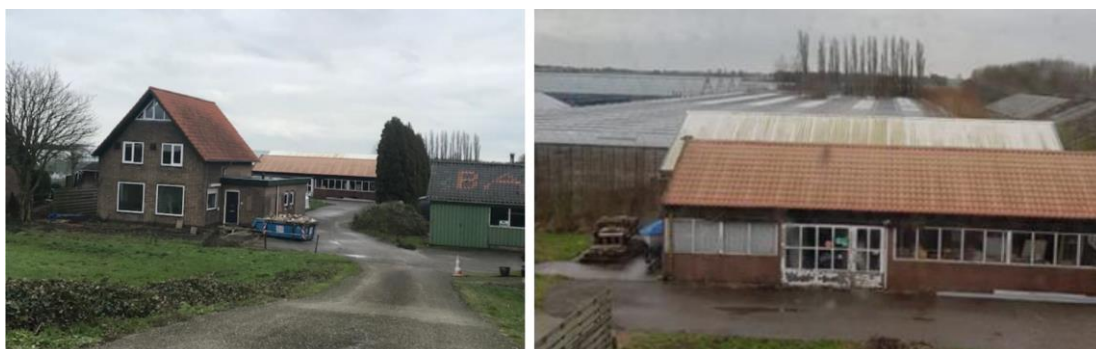
Impressie huidige situatie

De navolgende afbeelding toont een impressie van het plangebied in de huidige situatie.