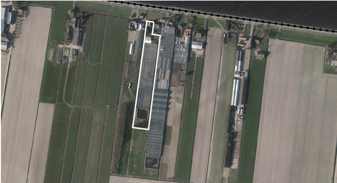
Globale begrenzing plangebied (witte omkadering, bron: ruimtelijkeplannen.zuid-holland.nl)