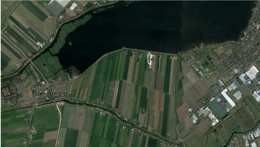
Globale ligging plangebied (witte ovaal, bron: Google Earth)