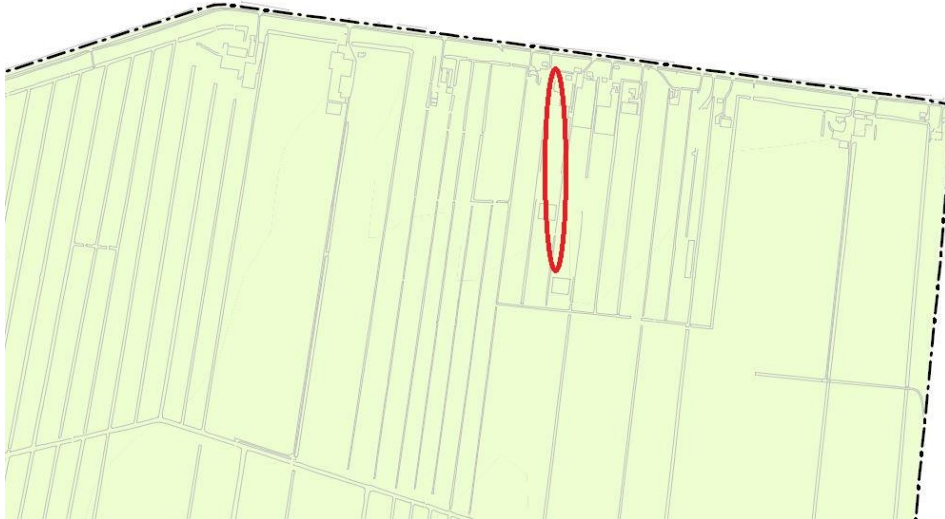
Uitsnede archeologische beleidsadvieskaart (plangebied rood omcirkeld)

Op de archeologische beleidsadvieskaart van de gemeente Kaag en Braassem hebben de gronden van het plangebied een lage verwachtingswaarde voor archeologie. In dit gebied worden geen eisen gesteld ten aanzien van archeologie.