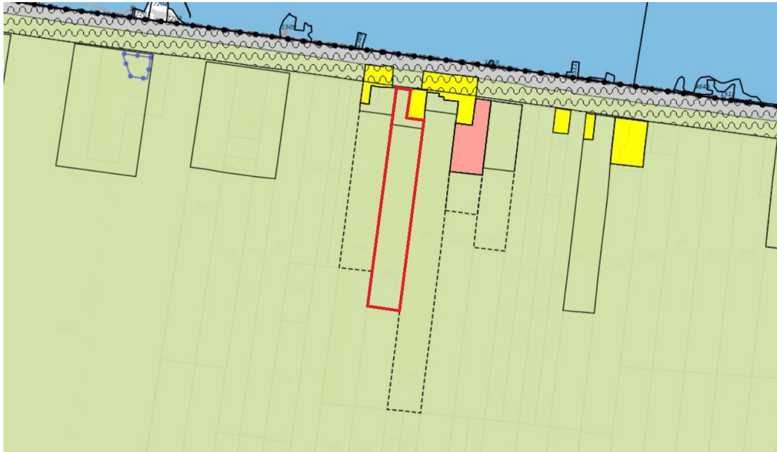
Uitsnede geldend bestemmingsplan 'Buitengebied Oost' (globale begrenzing plangebied is rood omlijnd)

Het plangebied is voorzien van de bestemming 'Agrarisch met waarden - Landschapswaarden' met de functieaanduiding 'glastuinbouw'. Ter plaatse van de aanduiding 'glastuinbouw' is de uitoefening van een glastuinbouwbedrijf toegestaan. Aan de noordzijde is het plangebied voorzien van een bouwvlak. Per bouwvlak is één bedrijfswoning toegestaan.