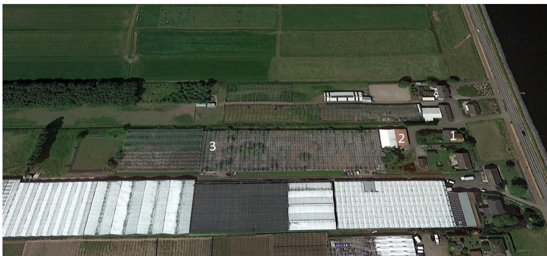
Luchtfoto huidige situatie

Het plangebied betreft een perceel dat is ingericht ten behoeve van een glastuinbouwbedrijf. Het perceel voldoet niet meer aan de hedendaagse eisen van een glastuinbouwbedrijf en is niet meer in gebruik als zodanig. In het plangebied zijn verschillende opstallen aanwezig, te weten een (bedrijfs)woning aan de Herenweg 17, kassen en een schuur. Op de navolgende afbeelding zijn de bestaande (bedrijfs)woning, schuur en kassen genummerd en in de navolgende tabel worden deze toegelicht.