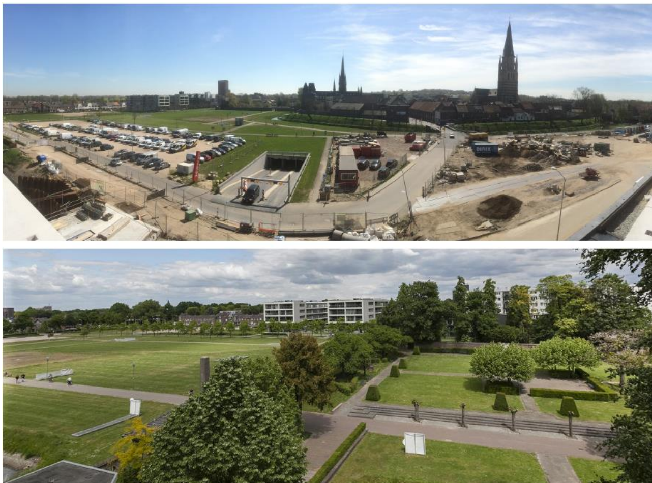
Figuur 2 Zicht van schootveld op stad (boven) en vice versa (onder)

De binnenstad van Sittard zelf is sinds 1972 2 aangewezen als beschermd stads- en dorpsgezicht en daarmee beschermd in het kader van de Monumentenwet (figuur 3). Het zuidelijk deel van het schoots/zichtveld en de Ursulinentuin vallen binnen de begrenzing en maken daarmee onderdeel uit van het beschermde stads- en dorpsgezicht. In de toelichting bij het aanwijzingsbesluit worden schoots-/zichtveld en Ursulinentuin echter niet genoemd. In het beschermde stads- en dorpsgezicht liggen diverse Rijksmonumenten. Deze zijn echter niet gelegen in het plangebied voor het evenemententerrein. Het schoots-/zichtveld en de Ursulinentuin hebben geen rijks- of provinciaal beschermde status.