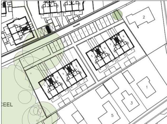
Schematische weergave van de gewijzigde situatie van het plangebied.

Het voornemen bestaat om acht nieuwe woningen in het plangebied te bouwen (2x4 woningen). Om de bouw van de woningen mogelijk te maken, dient de aanwezige bebouwing gesloopt te worden en dient (opgaande) beplanting gerooid te worden. Op onderstaande afbeelding wordt de gewijzigde situatie schematisch weergegeven.