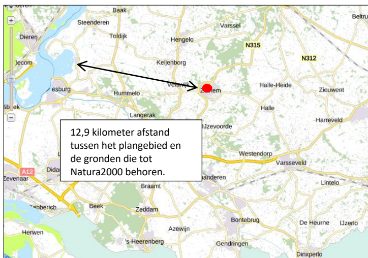
Ligging van Natura2000-gebied in de omgeving van het plangebied. Natura2000-gebied wordt met de lichtblauwe en groene kleur aangeduid. De ligging van het plangebied wordt met de rode stip aangeduid (bron pdok.nl).

Het plangebied behoort niet tot Natura2000. Het plangebied ligt op minimaal 12,9 kilometer afstand van het Natura2000-gebied Rijntakken (bron: Pdok.nl). Op onderstaande afbeelding wordt de ligging van Natura2000-gebied in de omgeving van het plangebied weergegeven.