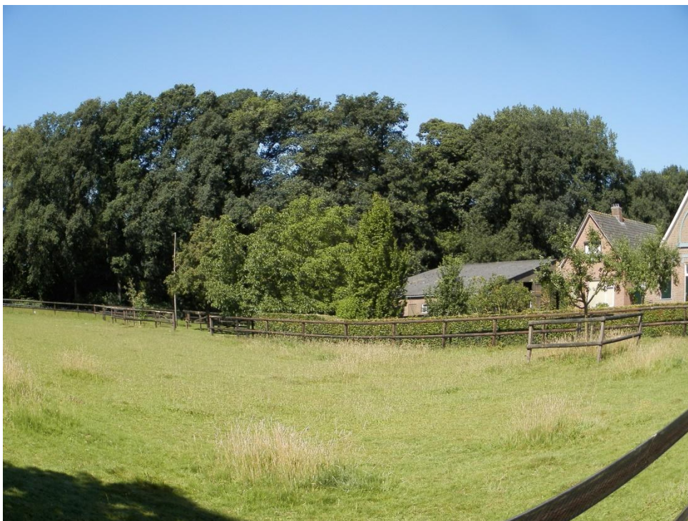
Westelijk wekje met solitaire bomen, op achtergrond de heg als afscheiding van de tuin.