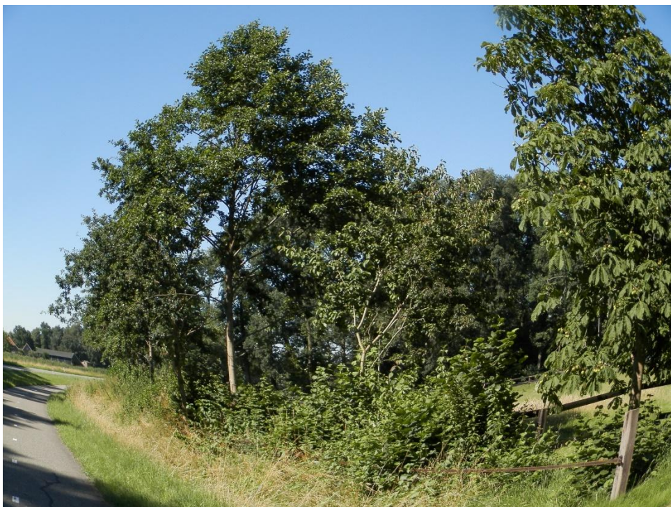
Singel langs westelijk weilje langs fietspad van openbare weg.