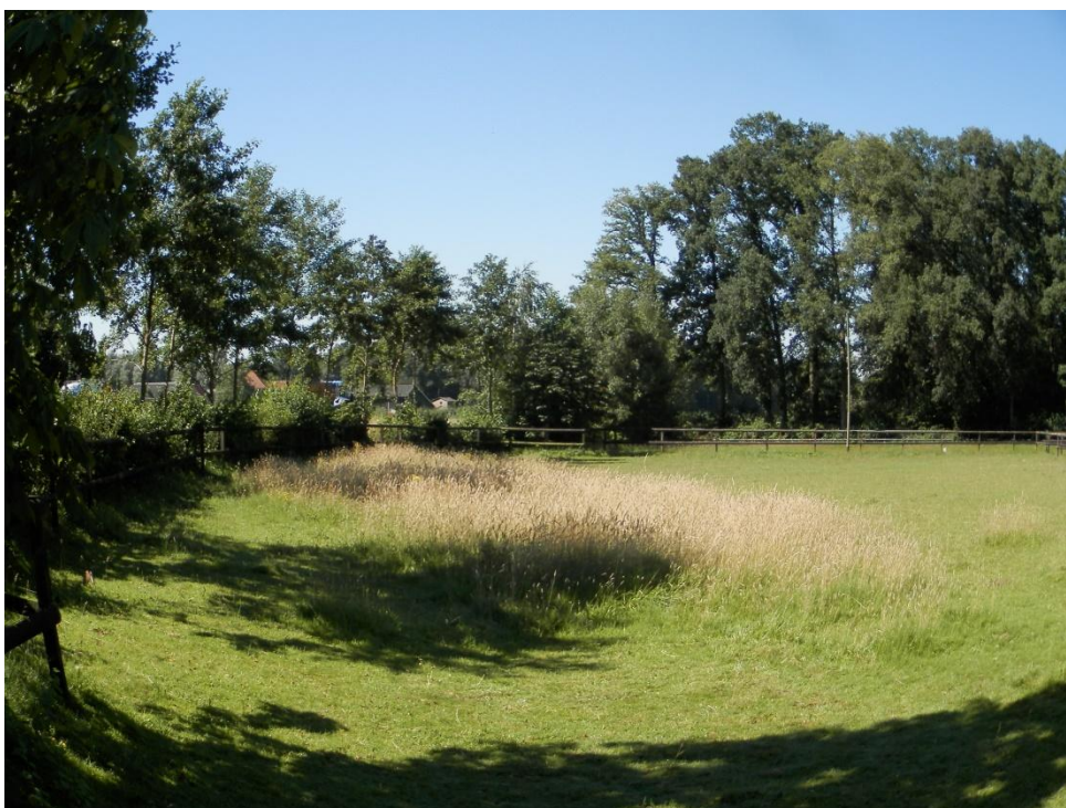
Westelijk weilje met singel