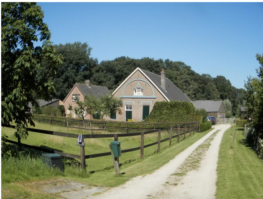
Foto: De woning van de familie Weijers, waarvan het het gedeelte met de karakteristieke gevel gemeentelijk monument is.