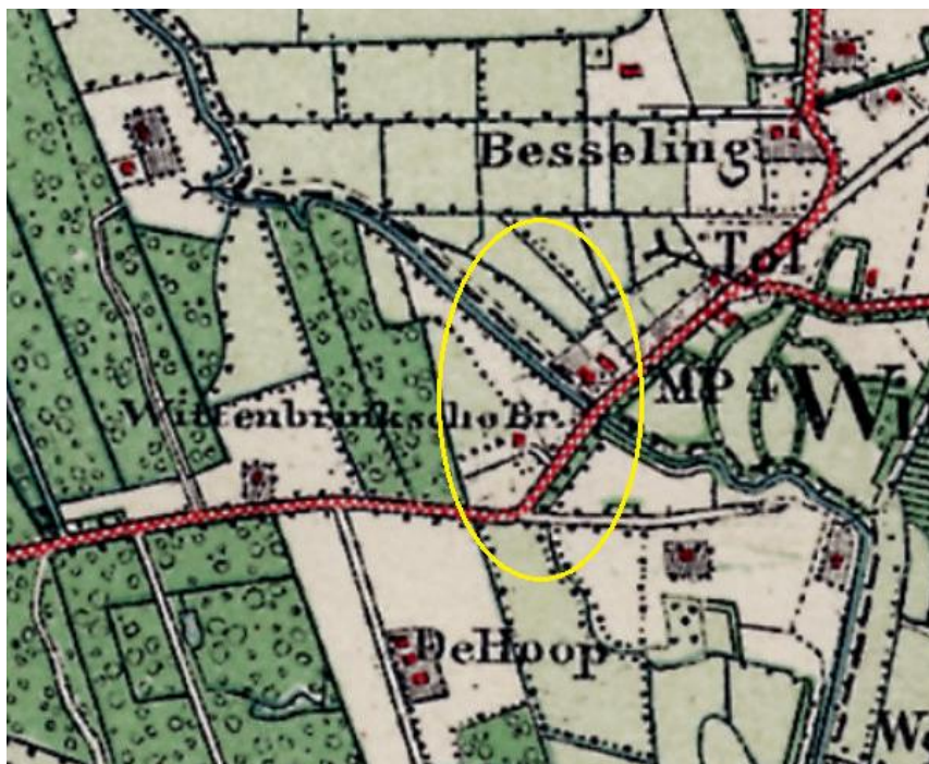
Historische kaart 1925

De ontwikkeling van het gebied in de afgelopen eeuw over de periode 1925 – 2015 wordt met onderstaande kaarten inzichtelijk gemaakt.