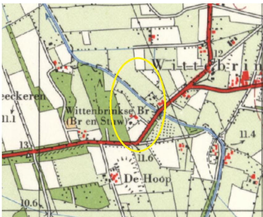
Historische kaart 1970