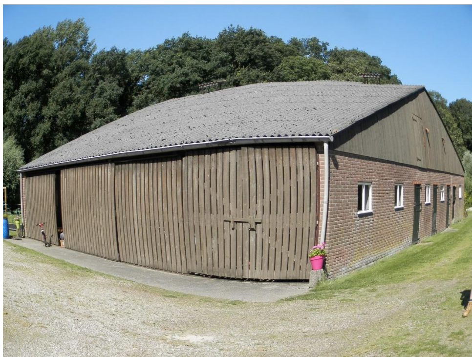
Foto: schuur die aangepast zal worden.