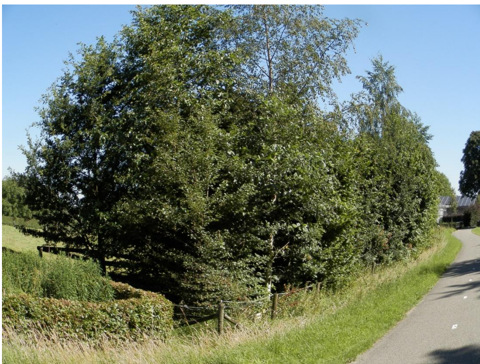
Singel langs oostelijk weitzje langs het fietspad van de openbare weg.