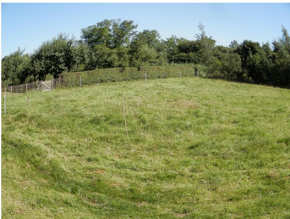
Oostelijk weitje, op de achtergrond de hoogstamboomgaard, rechts deel van de singel.