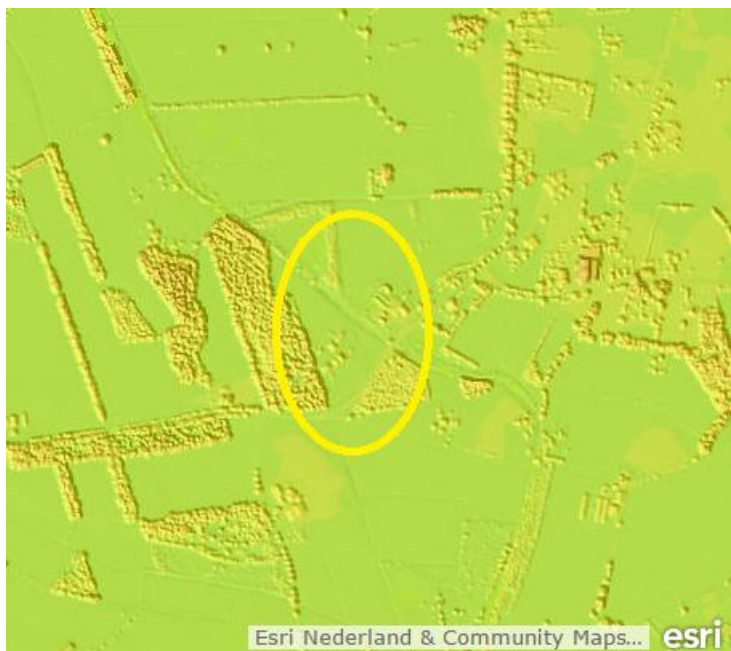
Kaart: hoogtekaart van het plangebied.

Ter plekke bestaat de grond uit zand overgaand richting Groote Beek naar lichte zwavel met een diepe grondwaterstand. De Grondwatertrap is VII met een gemiddelde hoogste grondwaterstand > 80 cm en gemiddelde laagste grondwaterstand > 160 cm.