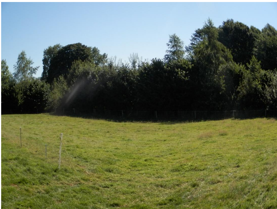
Singel langs oostelijk weitzje