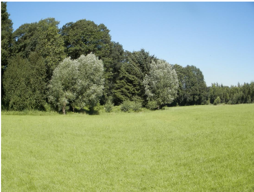
Bosrand waarlangs struweelrand gerealiseerd kan worden.