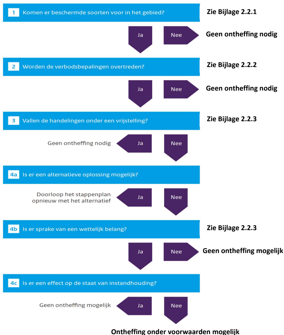
Figuur 2. Stappenplan procedure ecologisch onderzoek en ontheffing

negatieve effecten kunnen optreden, is vervolgonderzoek noodzakelijk.