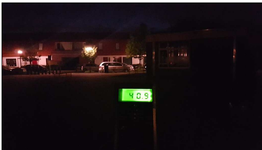
Nachtelijk onderzoek naar vleermuizen met behulp van een batdetector.

In afwijking van het vleermuisprotocol is geen direct onderzoek naar winterverblijven uitgevoerd. In de winterperiode zijn winterverblijven zeer moeilijk vast te stellen. Het gaat vaak om diepe holtes, spouwmuuren en ruimtes die aanwezig zijn in daken die niet of zeer slecht bereikbaar zijn en waar het risico bestaat dat (bij daadwerkelijke aanwezigheid) verstoring optreedt. Door te letten op het optreden van middernachtzwermaactiviteit en de (late) aanwezigheid van (paar) verblijven of activiteit is onderzocht of mogelijk sprake is van winterverblijven in het plangebied.