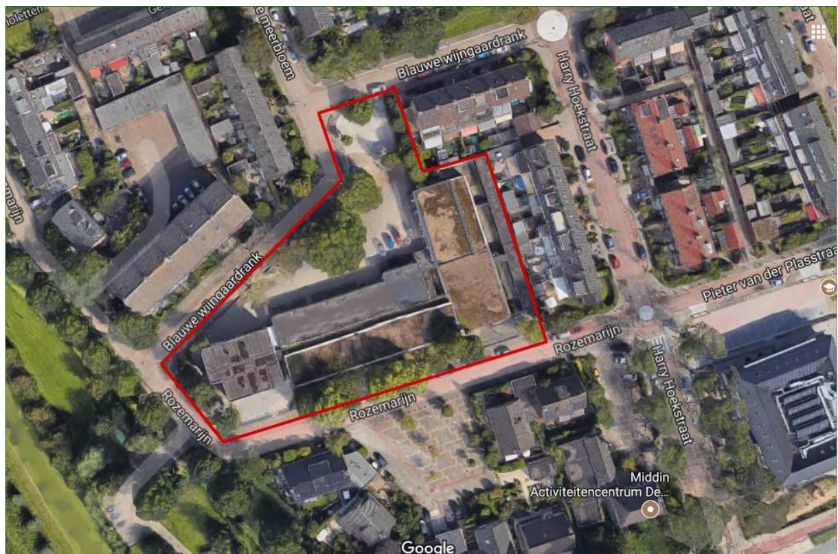
Figuur 1. Ligging van plangebied Rozemarijn 1 te Wateringen.

Doel van het onderzoek is om inzicht te krijgen in het voorkomen en de verspreiding van vleermuizen binnen het plangebied.