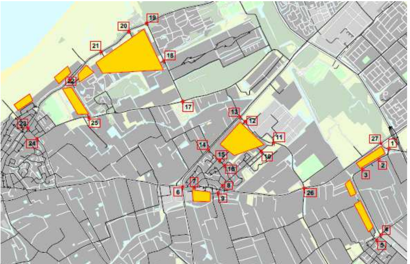
Figuur B1.1: Overzicht bouwlocaties en kruispunten