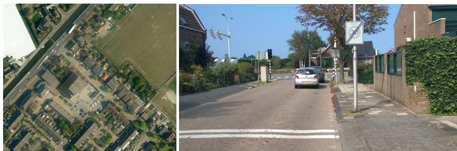
Figuur 3.2: Huidige situatie Doctor Weitjenslaan