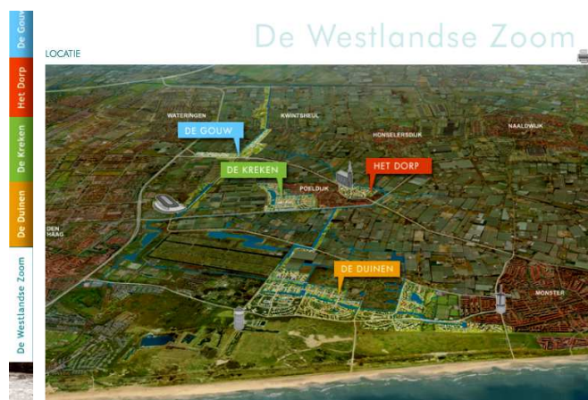
Figuur 1.1: Overzicht bouwlocaties De Westlandse Zoom