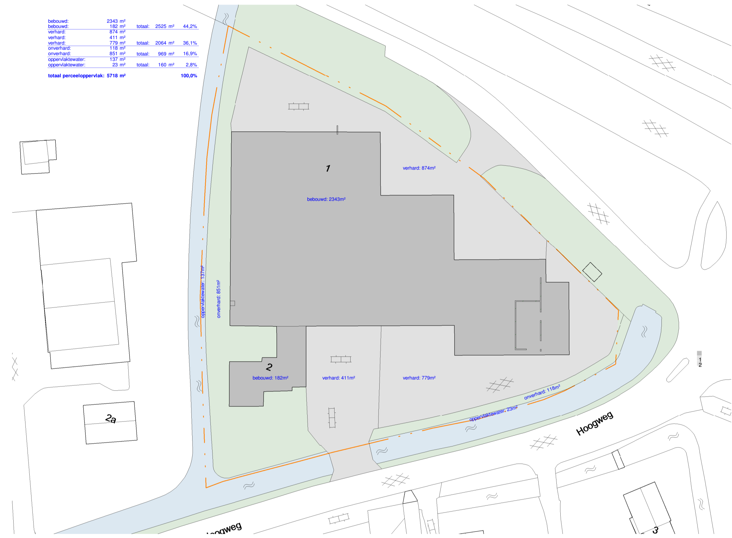
Watersleutel - BESTAAND