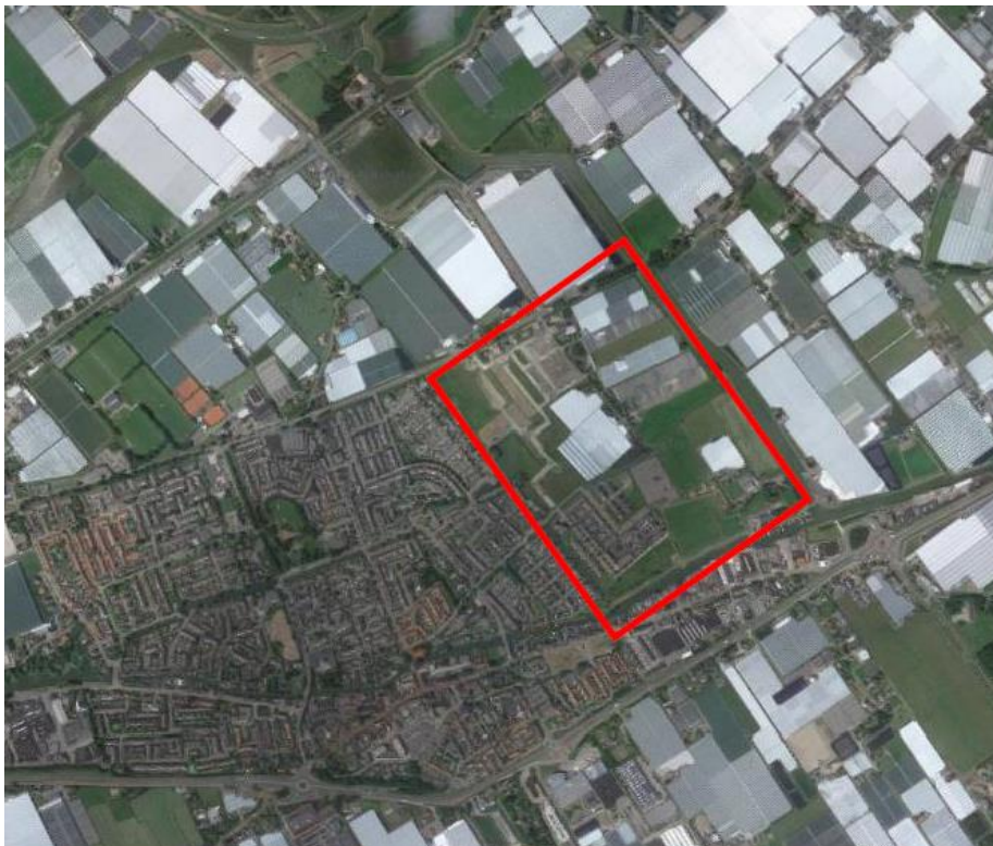
Figuur 1: Ligging plangebied Liermolen - Molensloot

Het plangebied van Liermolen – Molensloot (figuur 1) ligt in oorspronkelijk veen- en zeekele gebied landinwaarts van de duinen van Zuid-Holland.