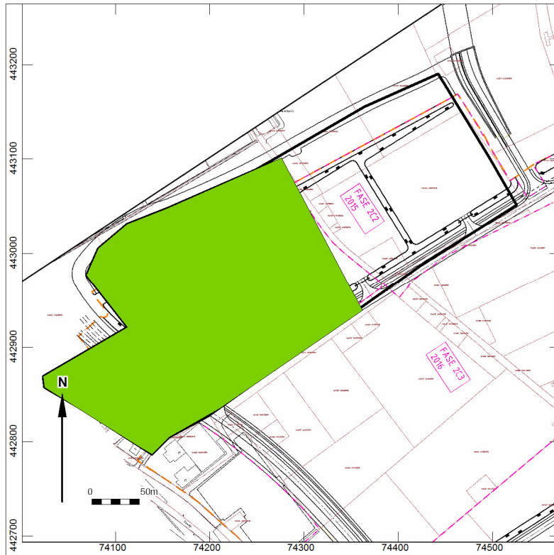
Afb. 9. Onderzocht gebied door proefsleuven en boringen. Groen: advies vrijgave.