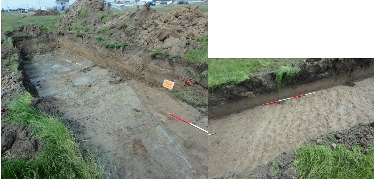
Afb. 6. Rechts op de linkerfoto een nww-zoo georiënteerde greppel in werkput 2, rechterfoto de akker.

handgevormd aardewerk afkomstig. De greppels zijn opgevuld met sterk zandig materiaal en schelp. De bodem bestaat hier uit sterk zandige klei. De aanwezigheid van deze sporen heeft er toe geleid dat er meerdere putten ten noorden van werkput 1 zijn aangelegd ter toetsing op aanwezigheid van archeologische sporen (wp 3 t/m 6). Vooral in de dwarsseuven putten 5 en 6 zijn sporen aangetroffen. Het betreft naast greppels een akker. De akker is geploegd in vermoedelijk één ploeggang, althans de ploegvoren liggen fraai evenwijdig aan elkaar. De oriëntatie hiervan is gericht op de aangetroffen greppels. De bodem en een deel van de akker bleken het fraaist geconserveerd in werkput 5. Hier is een profielopname gedaan en een pollenbak geslagen. Verder vondstmateriaal ontbreekt, zodat een datering van de akker niet gegeven kan worden. Op basis van de overspoelingen in het profiel kan verwacht worden dat deze ofwel Romeins is, ofwel middeleeuws.