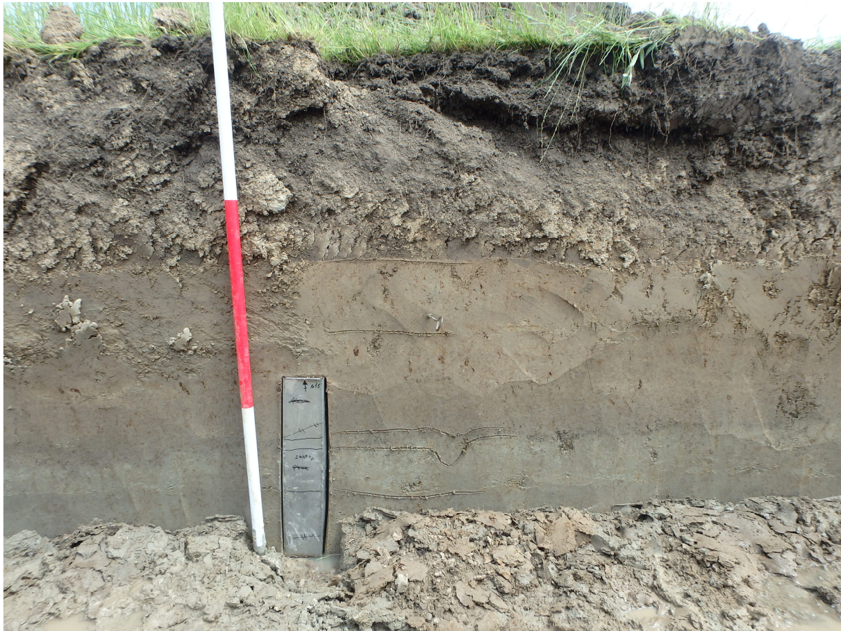
Afb. 8. Profielopname met pollenbak en akkersporen.

Als laatste is werkput 7 aangelegd, het voorgraven van een waterpartij. De put was 4m breed en 33 m lang. Het op dat moment bestaande beeld van de locatie werd bevestigd. Over een grotere oppervlakte konden de sporen van de akker worden opgetekend. Hier bleek dat meerdere greppels aanwezig zijn in dezelfde oriëntatie als de ploegsporen. Onderzoek naar de greppels heeft opgeleverd dat deze slechts een twintigtal tot dertigtal cm diep zijn.