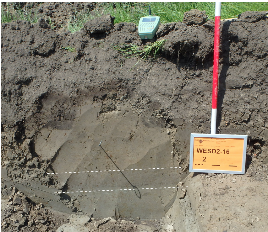
Afb. 7. Bodemvorming in werkput 2 onder een opgespoeld pakket sterk zandige klei, profielopname.