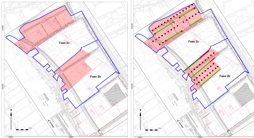
Afb. 2. Locaties onderzoek met rechts puttenplan en boorplan deze fase.