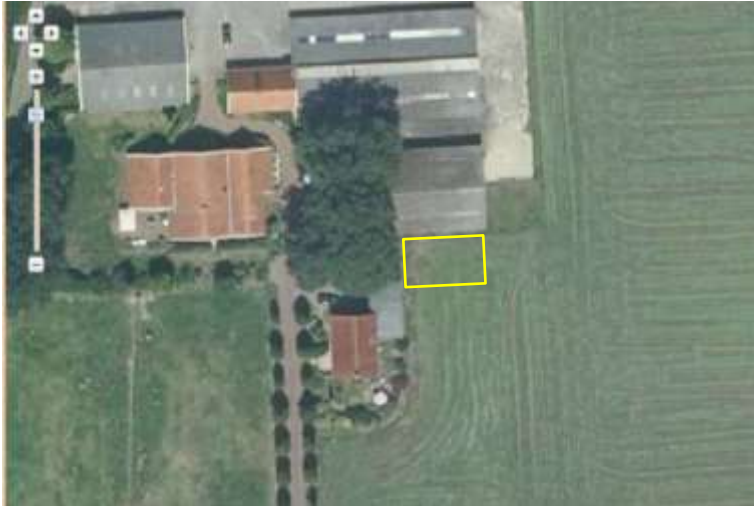
Ligging en begrenzing van deelgebied Latropperstraat.

Het plangebied vormt een deel van een bestaand woonerf en bestaat volledig uit grasland met een monocultuur van raaigras. Aan de noordzijde grenst het plangebied aan een bakstenen gevel van een stal. Het grasland wordt intensief landbouwkundig gebruikt en was tijdens het veldbezoek kort gemaaid. Op onderstaande luchtfoto wordt de ligging van het plangebied weergegeven.