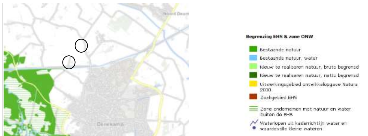
Ligging van Natuurnetwerk Nederland in de omgeving van het plangebied. De ligging van het plangebied wordt met de cirkel aangeduid

Het plangebied behoort niet tot Natuurnetwerk Nederland. Gronden die tot het Natuurnetwerk Nederland behoren liggen op minimaal 223 meter afstand van het plangebied. Op onderstaande afbeelding wordt de ligging van het Natuurnetwerk Nederland in de omgeving van het plangebied weergegeven.