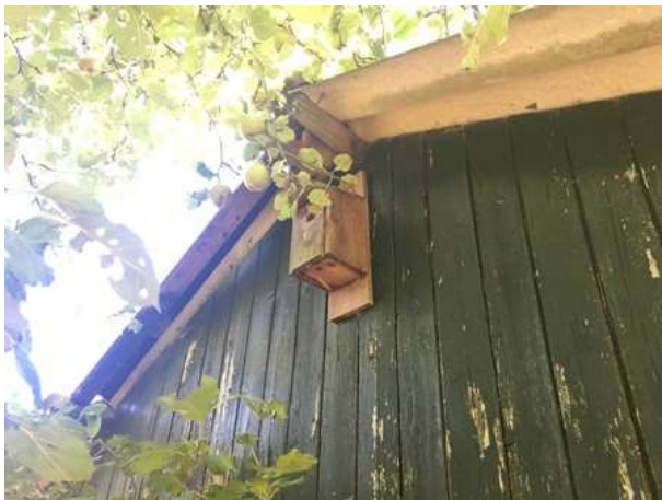
Mezenkast aan de buitenzijde van de kapschuur.

Door het slopen van de schuur tijdens de voortplantingsperiode worden mogelijk bezette vogelnesten beschadigd of vernield. Door het bouwen van de schuur wordt de functie van het plangebied als foerageergebied aangetast.