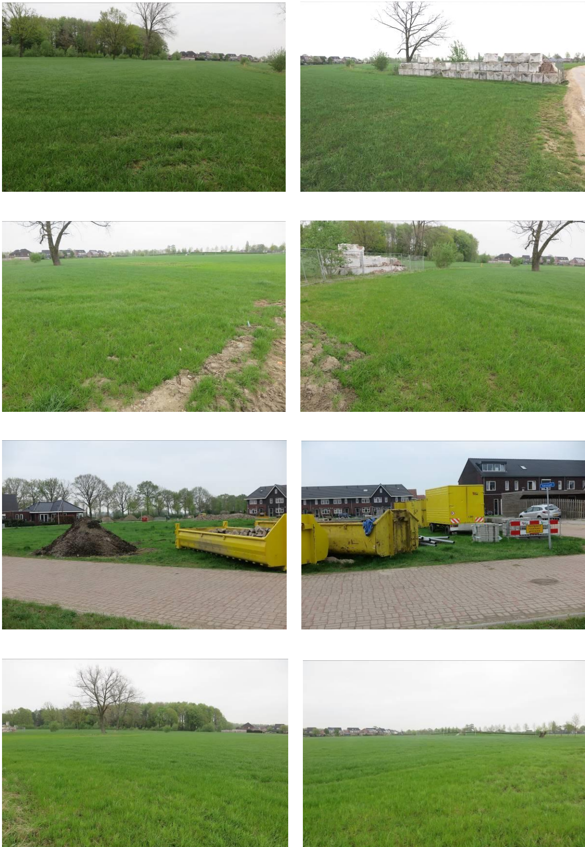
Figuur 2. Foto-impresie van de plangebieden aan de Noorder Koeslag te Wijhe.