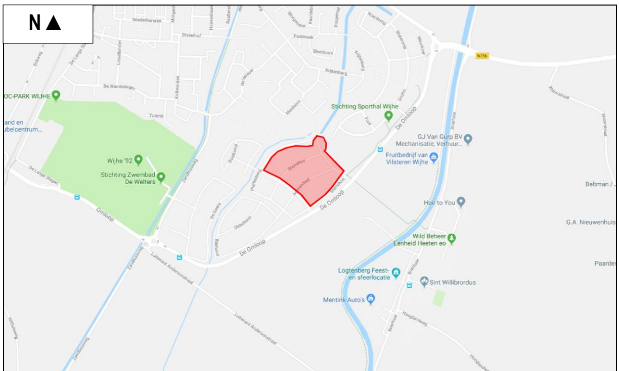
Figuur 1. Globale ligging van het plangebied aan de Noorder Koeslag te Wijhe.

Er is het voornemen voor de stedelijke uitbreiding van Wijhe (gemeente Olst-Wijhe) (zie figuur 1 voor de globale ligging). De aanwezigheid van beschermde planten- en diersoorten vormt een te onderzoeken aspect omdat met de plannen effecten kunnen ontstaan op soorten die beschermd zijn via de Wet natuurbescherming. Op grond hiervan is aan Adviesbureau Mertens B.V. uit Wageningen gevraagd om een verkennend veldonderzoek uit te voeren naar de aanwezigheid van wettelijk beschermde soorten en indien aanwezig, aan te geven hoe hiermee dient te worden omgegaan. In dit rapport worden de resultaten van deze verkenning gepresenteerd.