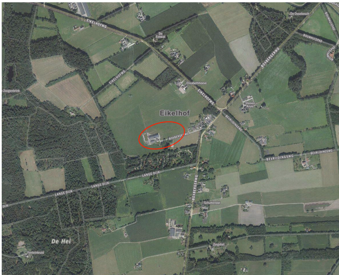
Afbeelding 1. Plangebied: rood

Het plangebied betreft de te amoveren schuren en een deel van het agrarische perceel. Op het perceel staan naast deze bebouwing, een woonhuis en een klein opslagschuurtje. Het terrein is grotendeels verhard, aan de voorzijde van de woning is een gecultiveerde siertuin aanwezig.