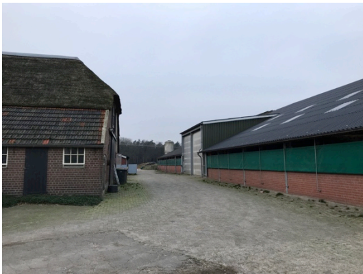
Erf met bijgebouwtje (opslagschuurtje)