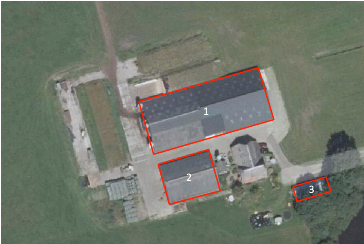
Afbeelding 2. Plangebied: rood te amoveren bebouwing. 1: loopstal, 2: jongveestal, 3: kapschuur