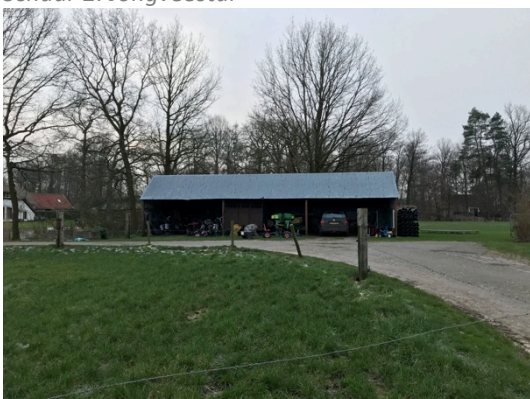
Schuur 3: Kapschuur