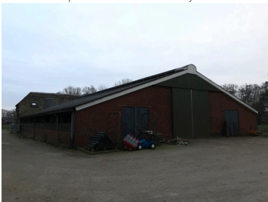
Schuur 2: Jongveestal