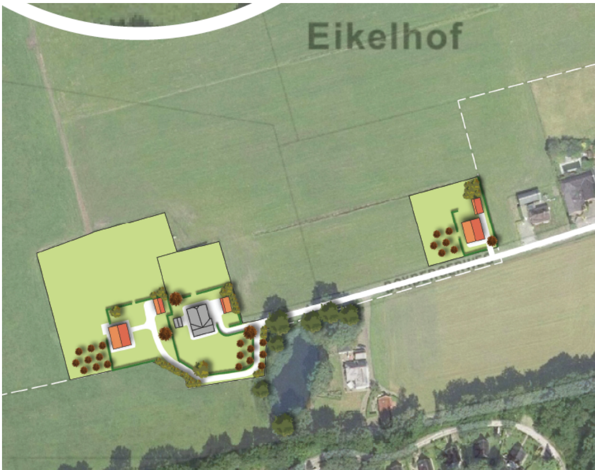
Afbeelding 3. Nieuwe ontwikkeling op de planlocatie