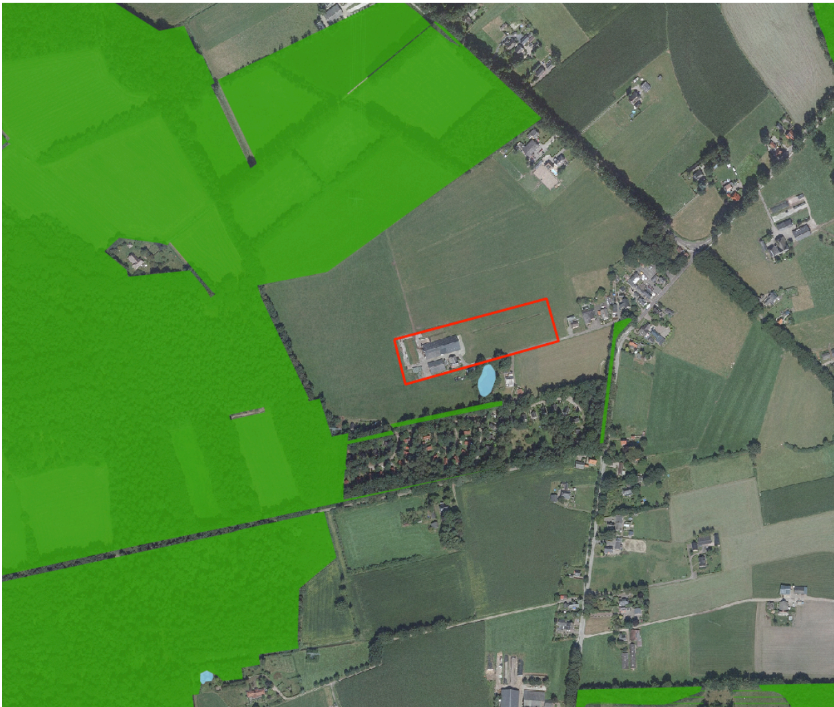
Afbeelding 3, Plangebied: rood, NNN: groen, Zone ondernemen met natuur en water buiten het NNN: Groen gestreept

Het is niet te verwachten dat de ruimtelijke ontwikkeling een negatief effect heeft op de NNN. Een negatief effect is op voorhand uit te sluiten.