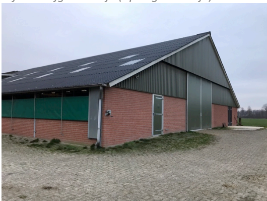
Schuur 1 loopstal voor- en achterzijde