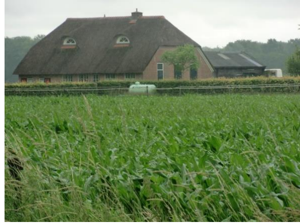
Foto's bestaande boerderij

Een belangrijk kwaliteitsaspect is om voor de nieuwbouw een samenhang en harmonie te vinden. Hierbij is belangrijk om qua architectuur bijpassende gebouwen te ontwerpen. Eenvoud, ingetogen en schuurvorm zijn belangrijke sleutelbegrippen in de ontwikkeling. De nieuwe ontwikkeling moet ondergeschikt zijn aan de bestaande boerderij.