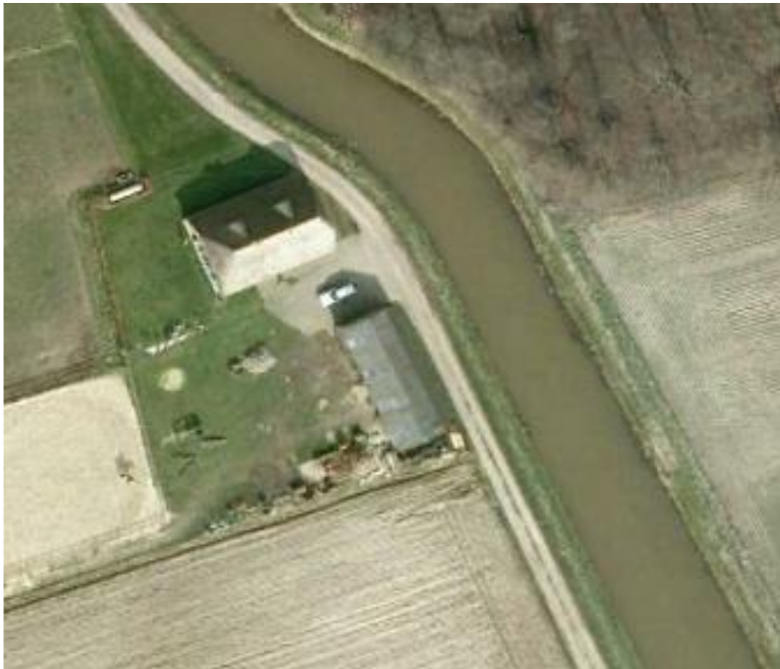
Luchtfoto van het bestaande erf