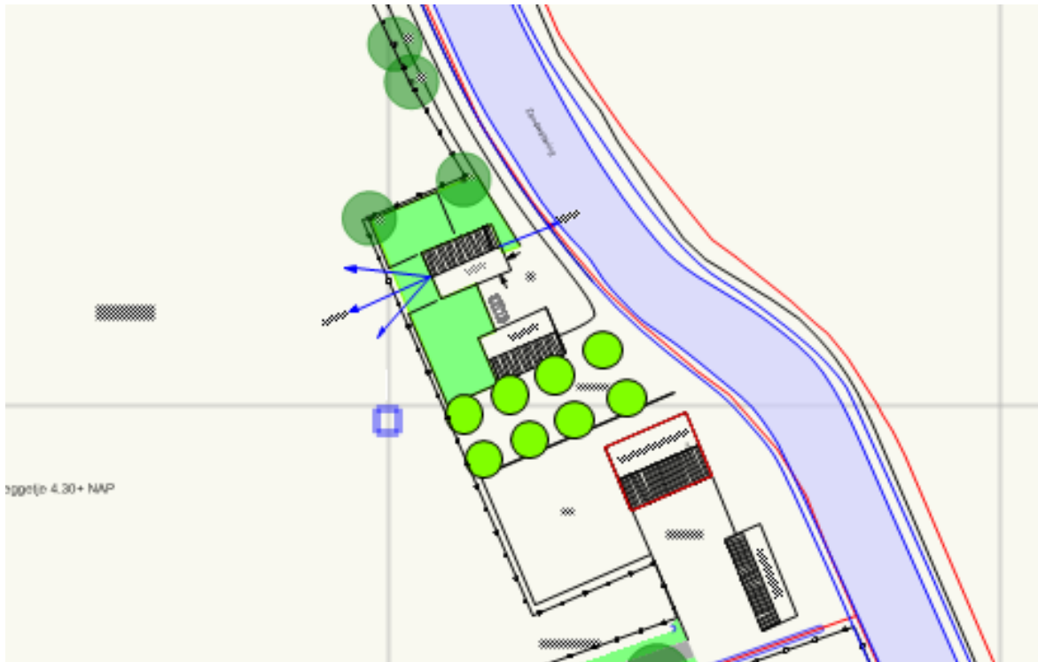
Schetsplan nieuw erf

De woonzijde, de woonkamer, is aan de westelijke zijde en de oostzijde is het erf. Het erf heeft een 'open' verbinding met de Soestwetering.