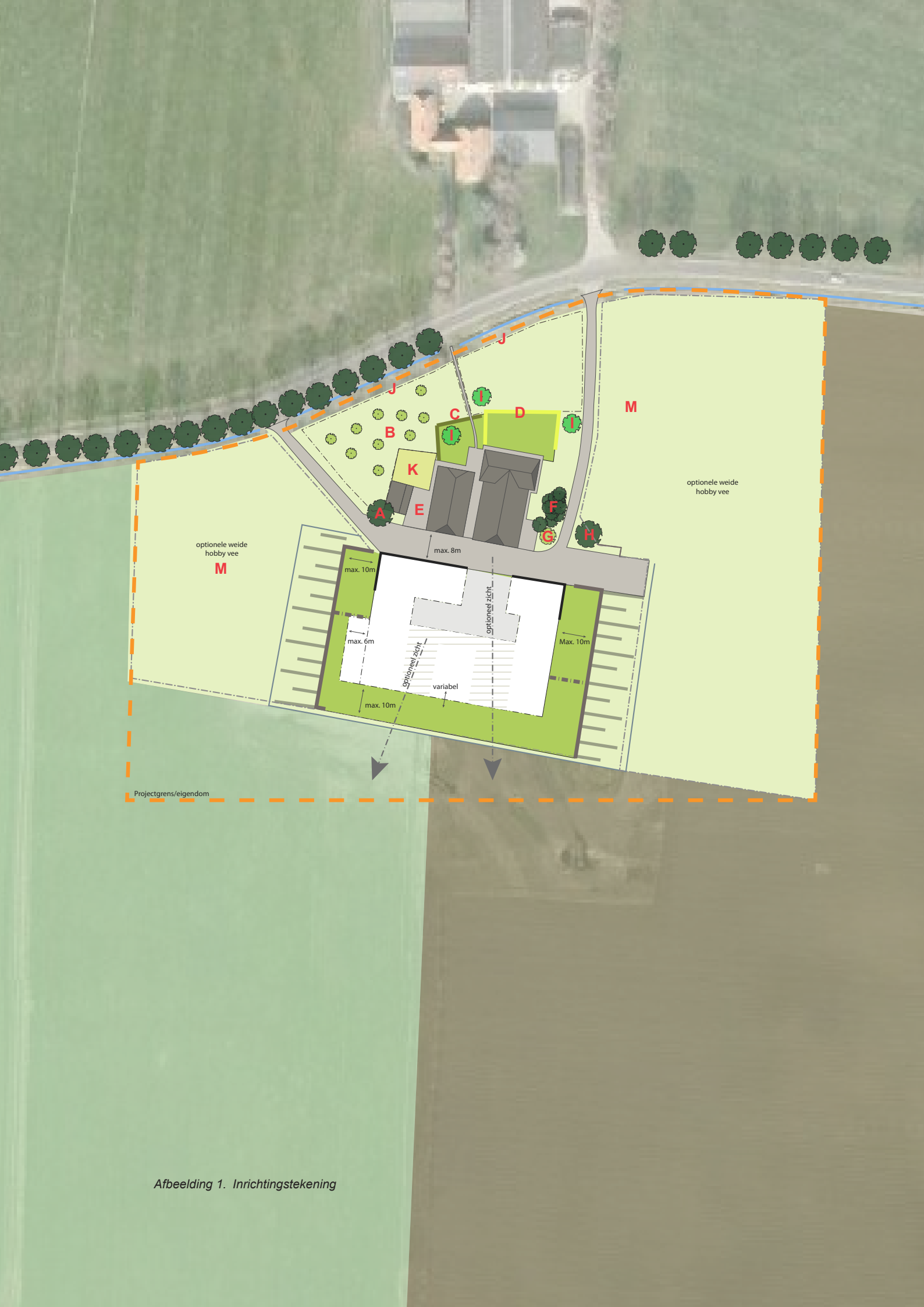
Afbeelding 1. Inrichtingstekening