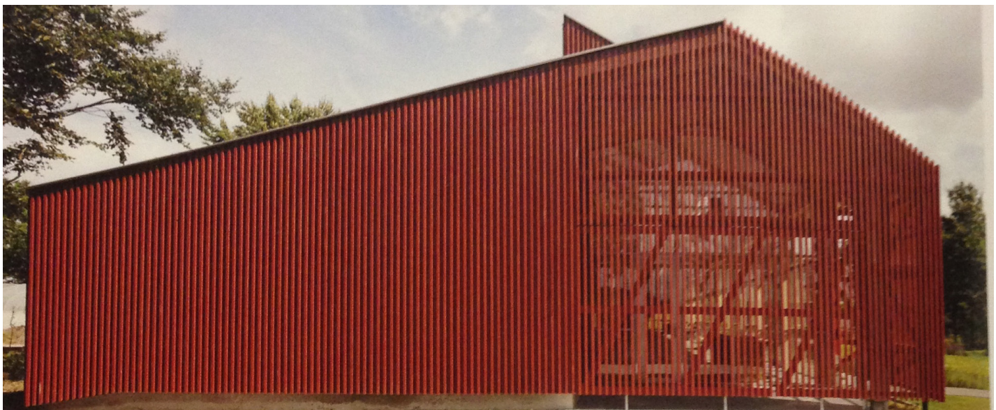
Afbeelding 3. Referentiebeelden van simpele agrarische vormen en eenvoudig materiaalgebruik