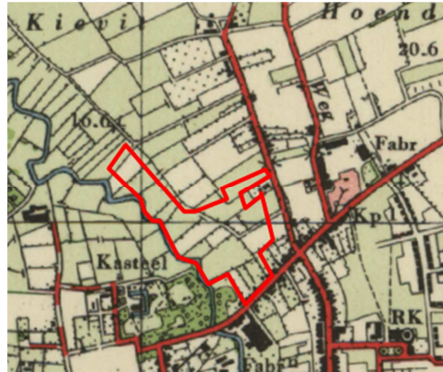
Uitsnede historische kaart 1970