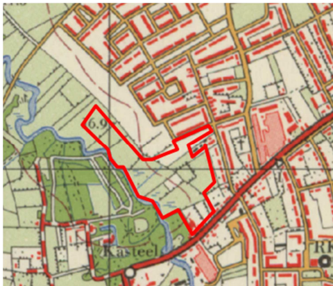
Uitsnede historische kaart 1970