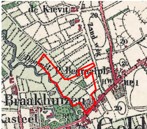
Uitsnede historische kaart 1925