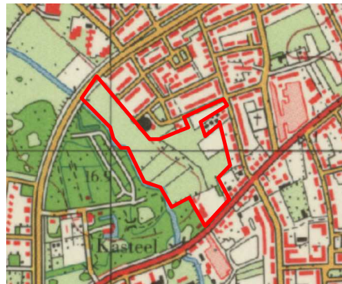
Uitsnede historische kaart 1980