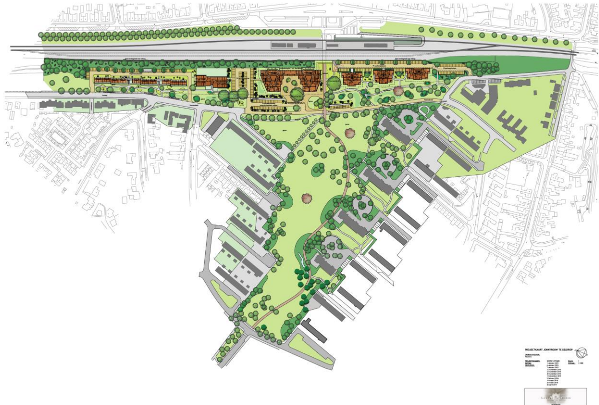
Figuur 2. Schets van de toekomstige situatie.

In het plangebied wordt een groot aantal woningen gebouwd (zie figuur 2).