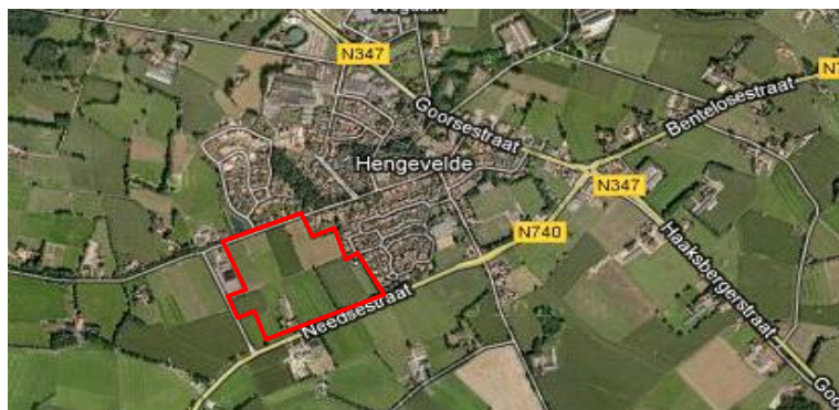
Figuur 1. Ligging van het plangebied

De ligging van het plangebied is weergegeven in de onderstaande figuur.