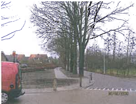
Goorseweg 11 zomereiken Ruimersdijk links