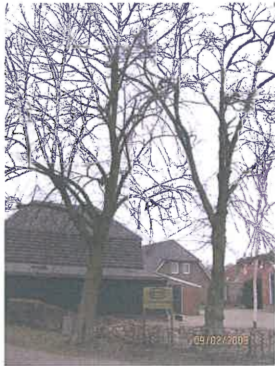
Bomen staan wat scheef