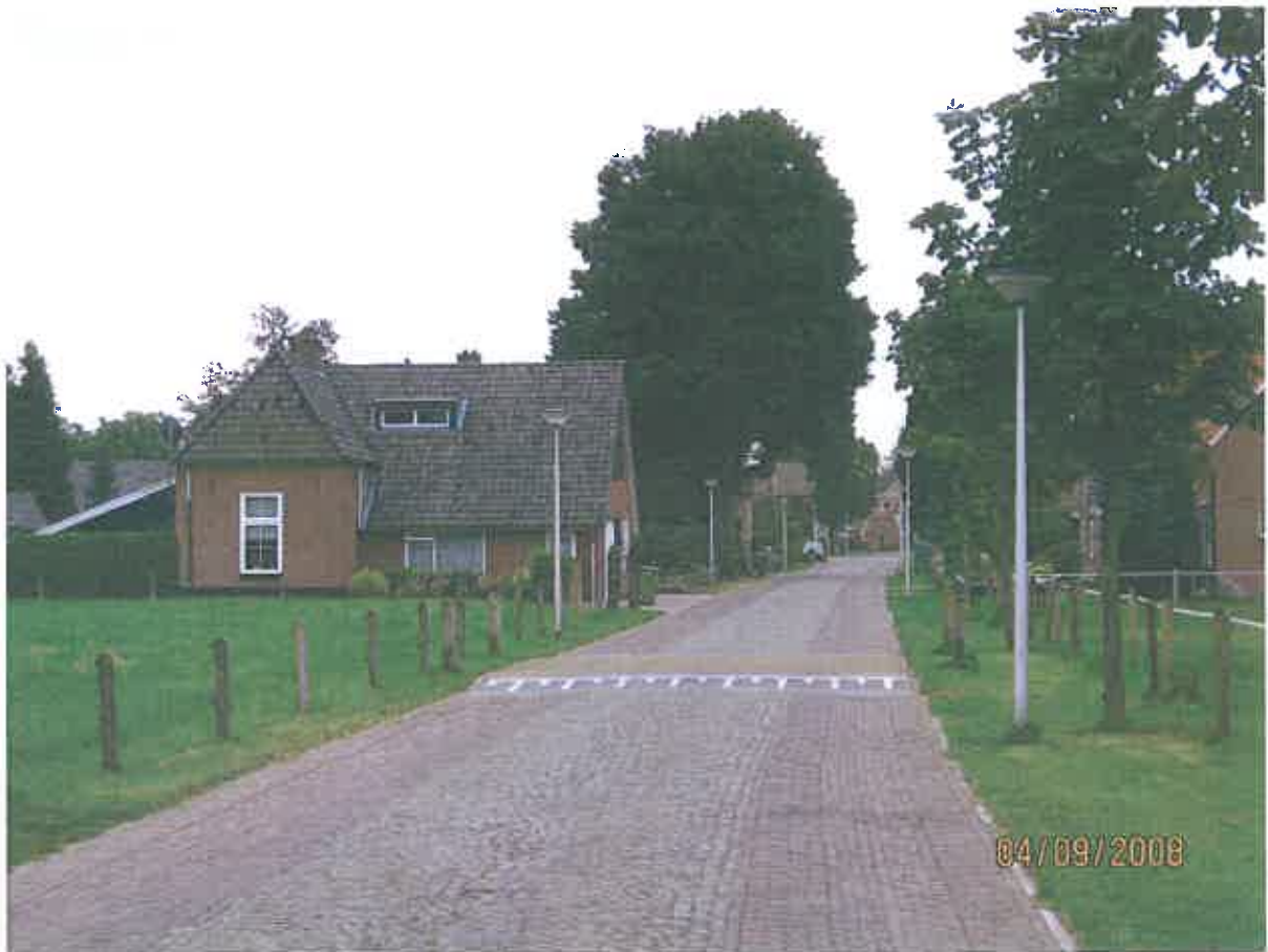
Duidelijk aanwezig in het straatbeeld