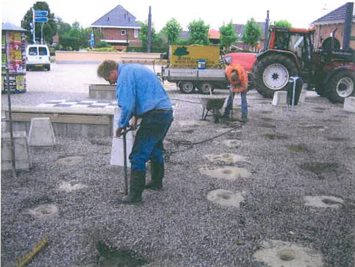
Bemesting Platanen 03-07-2007