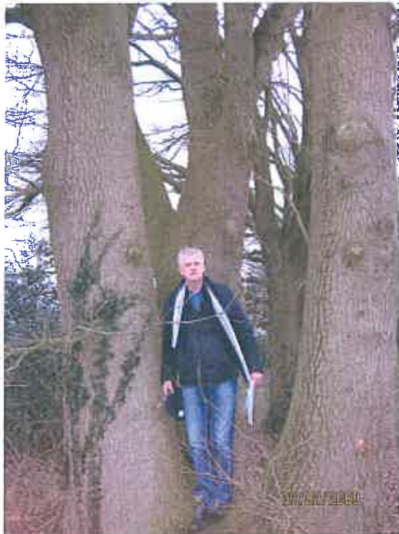
Driestammige oude eik