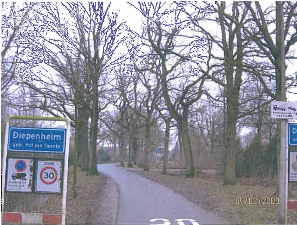
Van de komgrens bij de sportvelden tot aan de Ruimersdijk