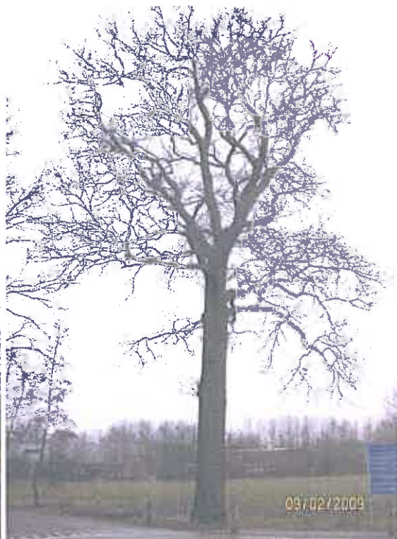
Goorseweg 1 zomereik rechts