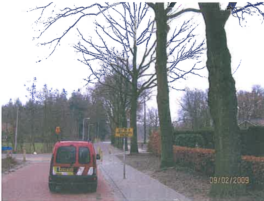
Peckedammerstraat richting Goorseweg