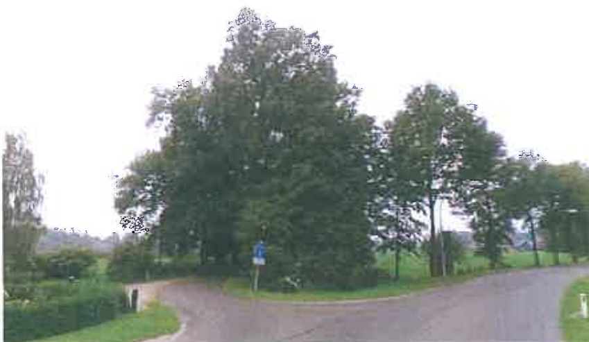
2007 ingang Odammerweg