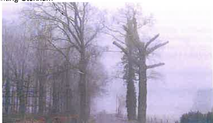
2003 De rechter zomereik voor de Regge werd gekapt