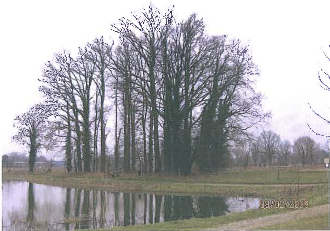
Eikenbos (zomereiken) aan de rand van de woonwijk. Waardevol groenelement in de omgeving, die gelet op de uitbreidingsplannen in "waarde" toeneemt.