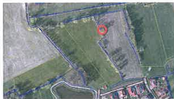
De eik blijft gehandhaafd in de nieuwe plannen van Plan Diepenheim Noord Fase 2.

In 2009 wordt het terrein bouwrijp gemaakt.