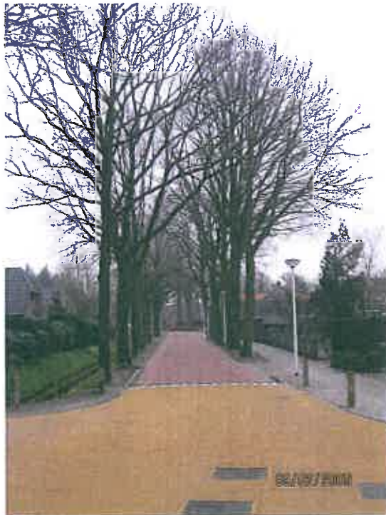
Tussen Dr.Quantstraat en Lindelaan