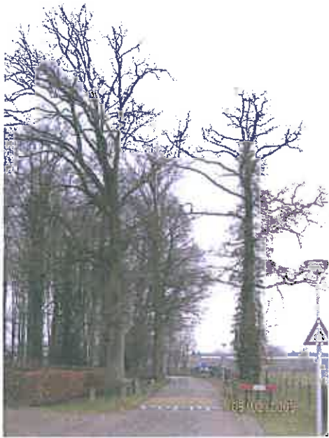
2009 de eik links klink hol aan de woningzijde, aan de bast is echter niets te zien