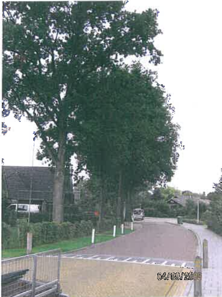
1 e zomereik tuin van nr.26 (gemeenteground)