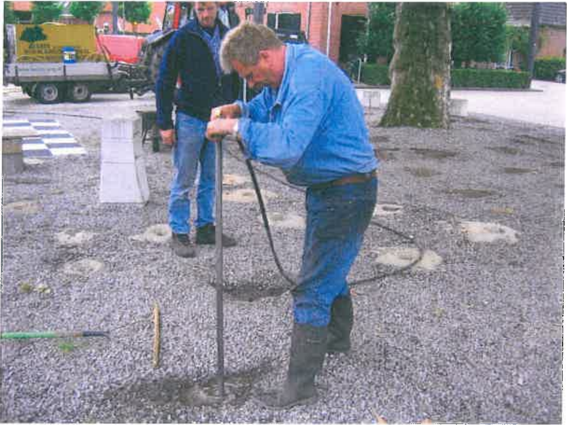
Bemesting Platanen 03-07-2007