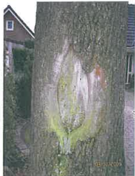
Stambeschadiging bij nr.24