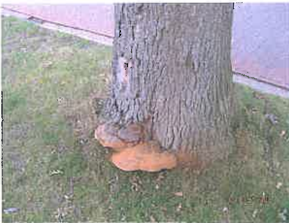
Door zwam aangetast bij nr.18