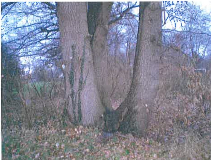
Mogelijk zeer oud hakhout ?