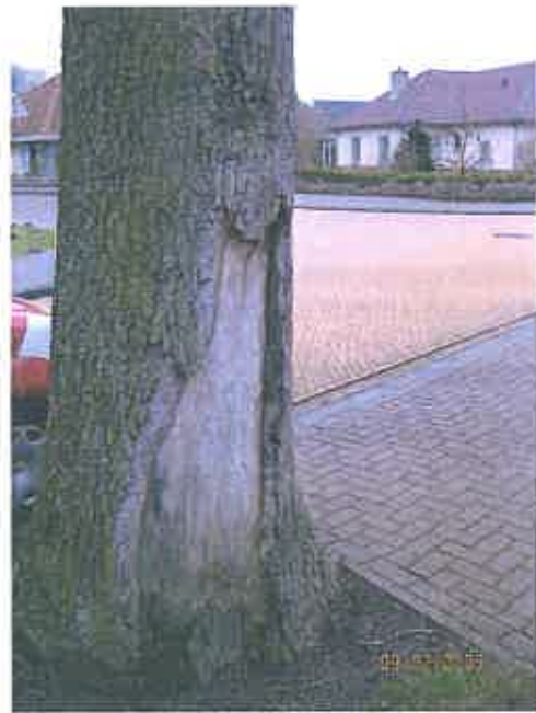
Stambeschadiging bij nrs. 18-20