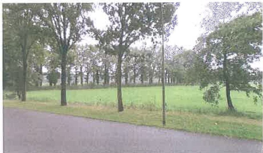
2007 eikenbomenrij op de achtergrond