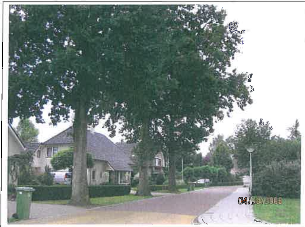
Ruimersdijk - totaal 36 zomereiken (foto bij huisnrs.18-20)

Objectnr :Di011 Datum inventarisatie: 1-02-2009 A.P.