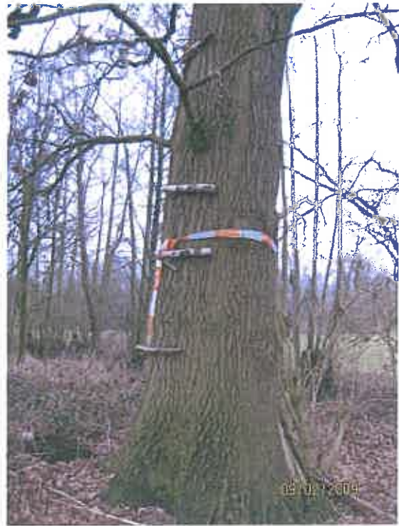
Latten aan gespijkerd