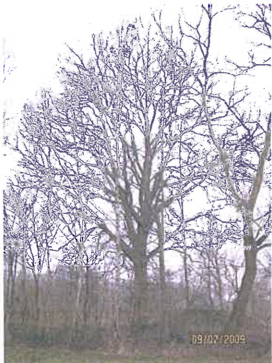
Solitaire eik in een houtsingel

In 2009 wordt het terrein bouwrijp gemaakt.