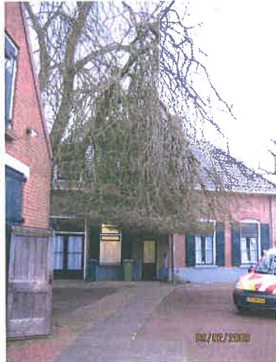
laaghangende dichte takken