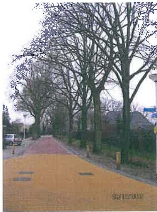
Tussen Lindelaan en Goorseweg