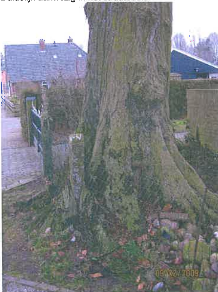
De paal van de oude afrastering is volledig ingegroeid