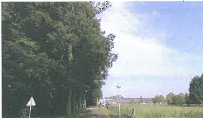
2007 Zomer eiken na de Regge richting Stokkum