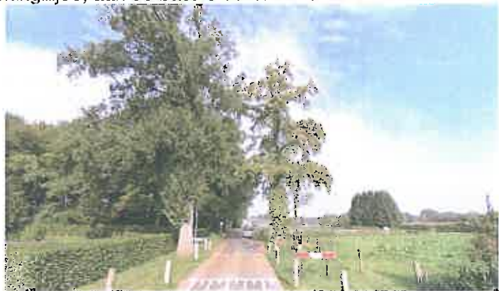
2007 Groeiwijze heeft te maken met eerder gekapte eik