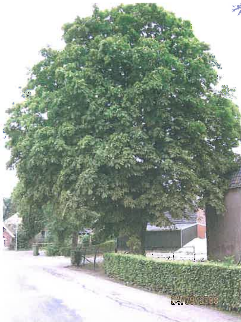
Foto vanaf de Hagen