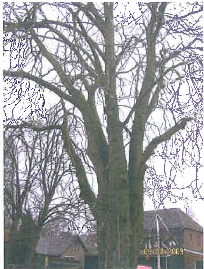
Vijf zware gesteltakken vormen de kroon