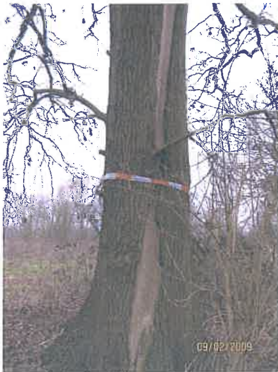
Bastschade door bliksemsinslag