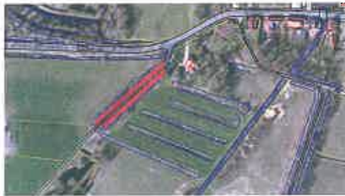
Dubbele rij eiken