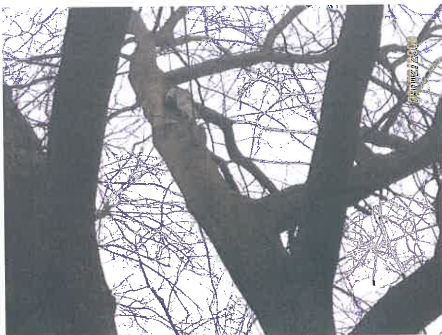
In de kroon een oude wond, als gevolg van een stormschade