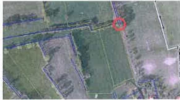
Buitenrand uitbreiding Diepenheim noord fase 2