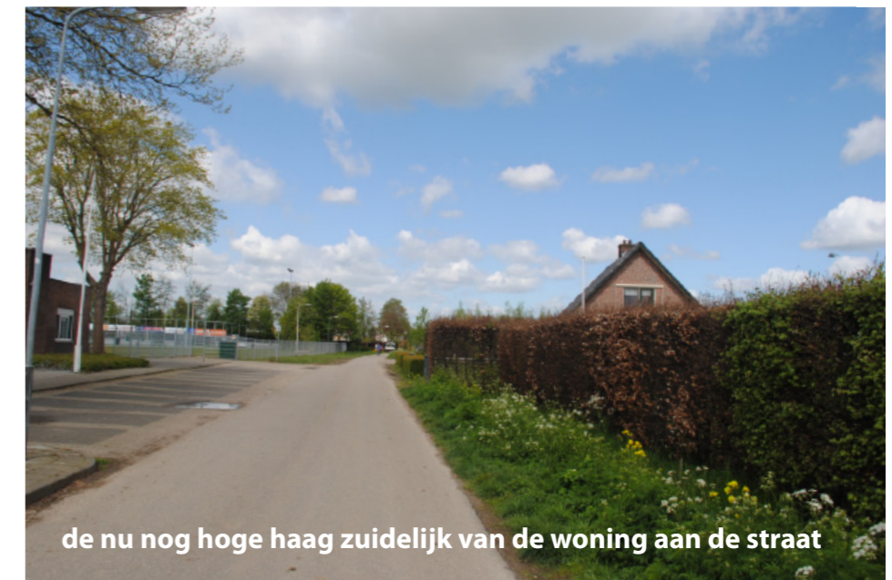
de nu nog hoge haag zuidelijk van de woning aan de straat

Op Zandakkers 30 gaat het zoals bekend slechts om het wijzigen van een bestemming en om het deels verwijderen van de laagstamboomgaard.