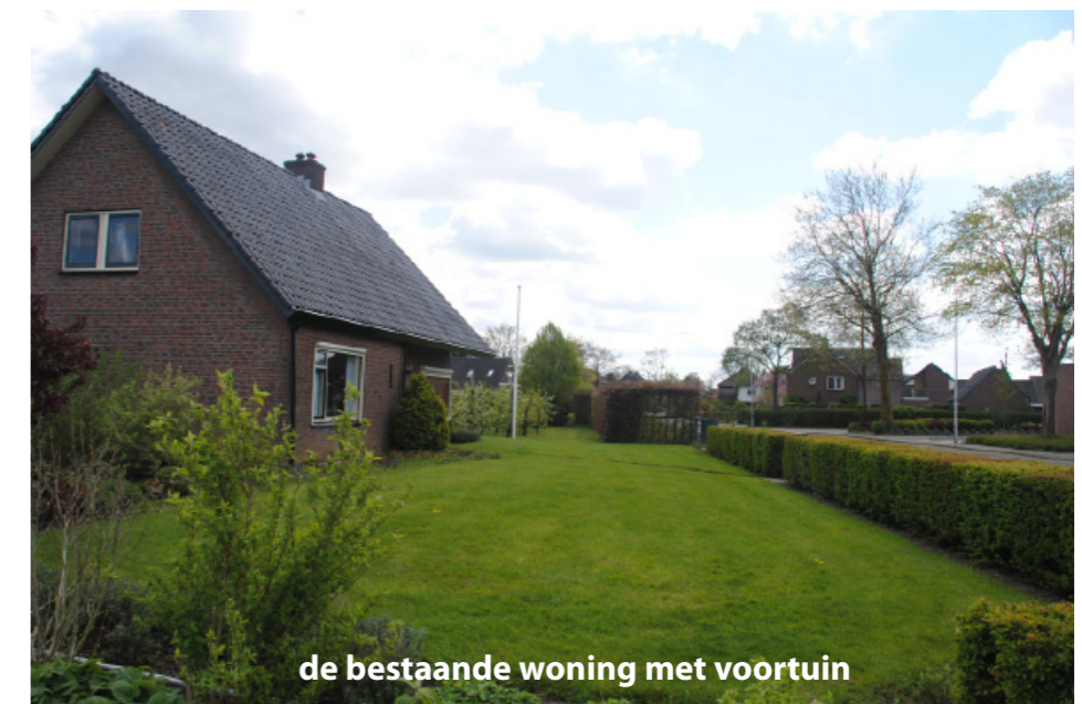
de bestaande woning met voortuin