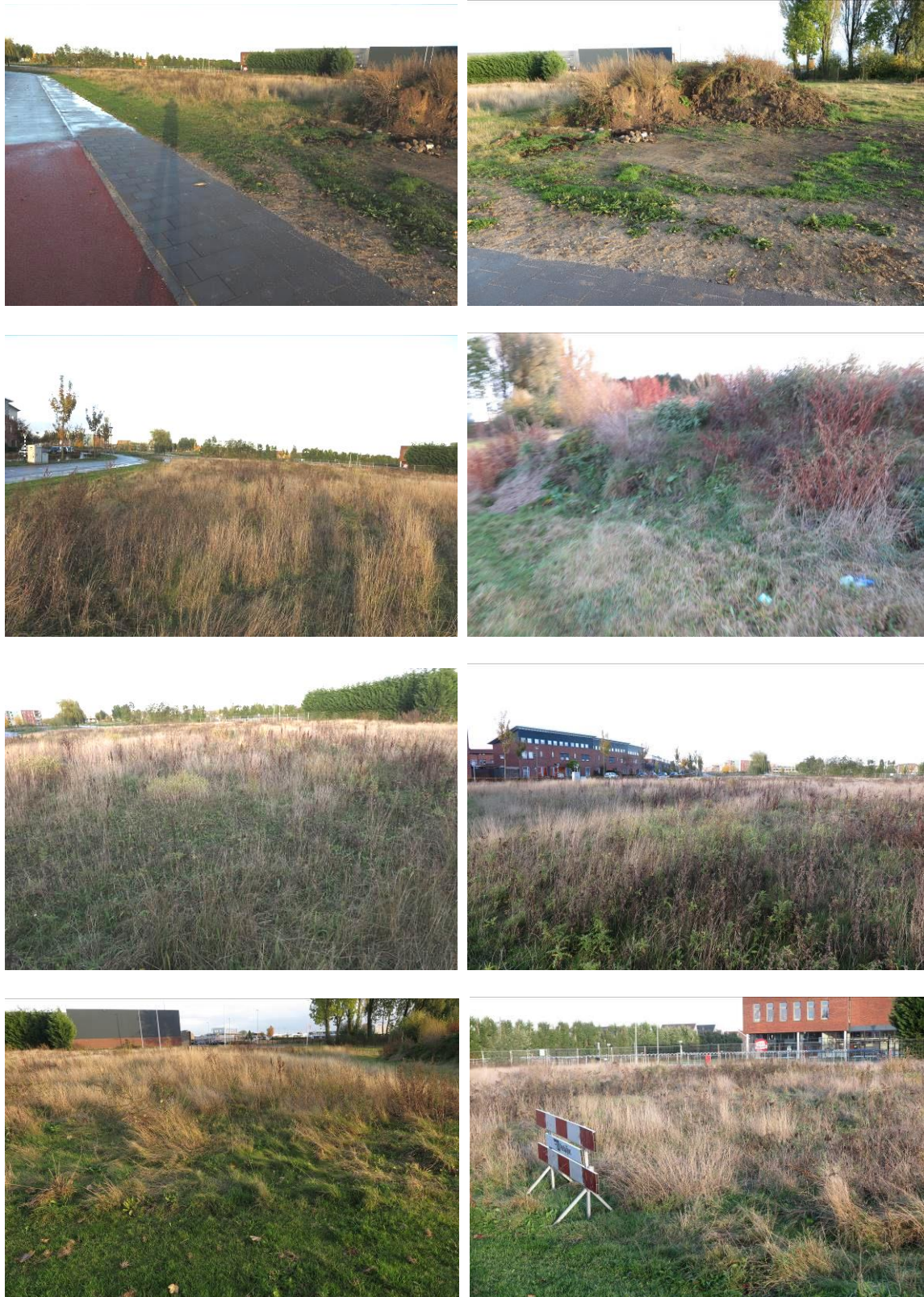
Figuur 2. Aanzicht van het plangebied Regenboog te Elst.