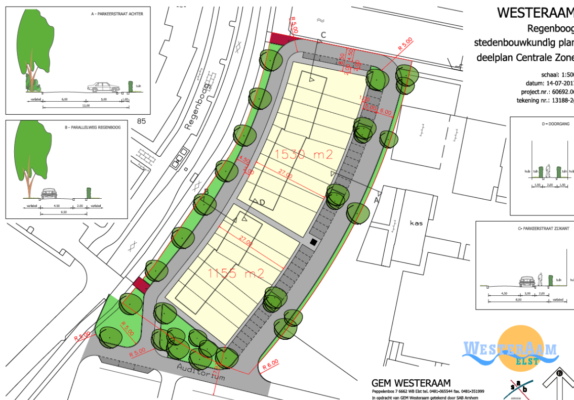
Figuur 3. Impressie van de plannen Regenboog te Elst.