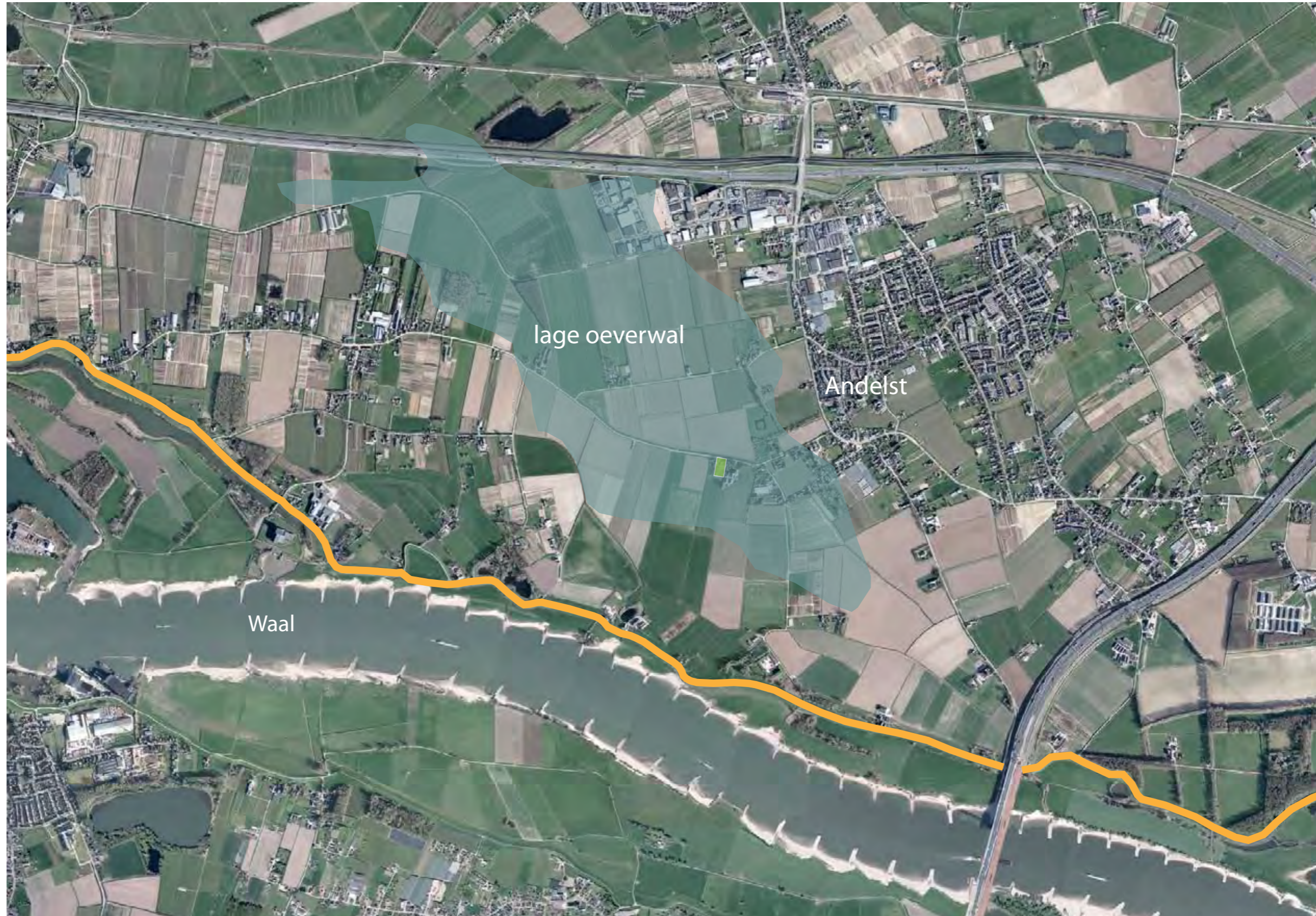
Ligging locatie in Rivierenlandschap op lage oeverwal