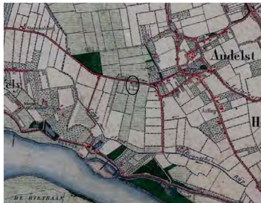
Historische kaarten: Kaart 1871