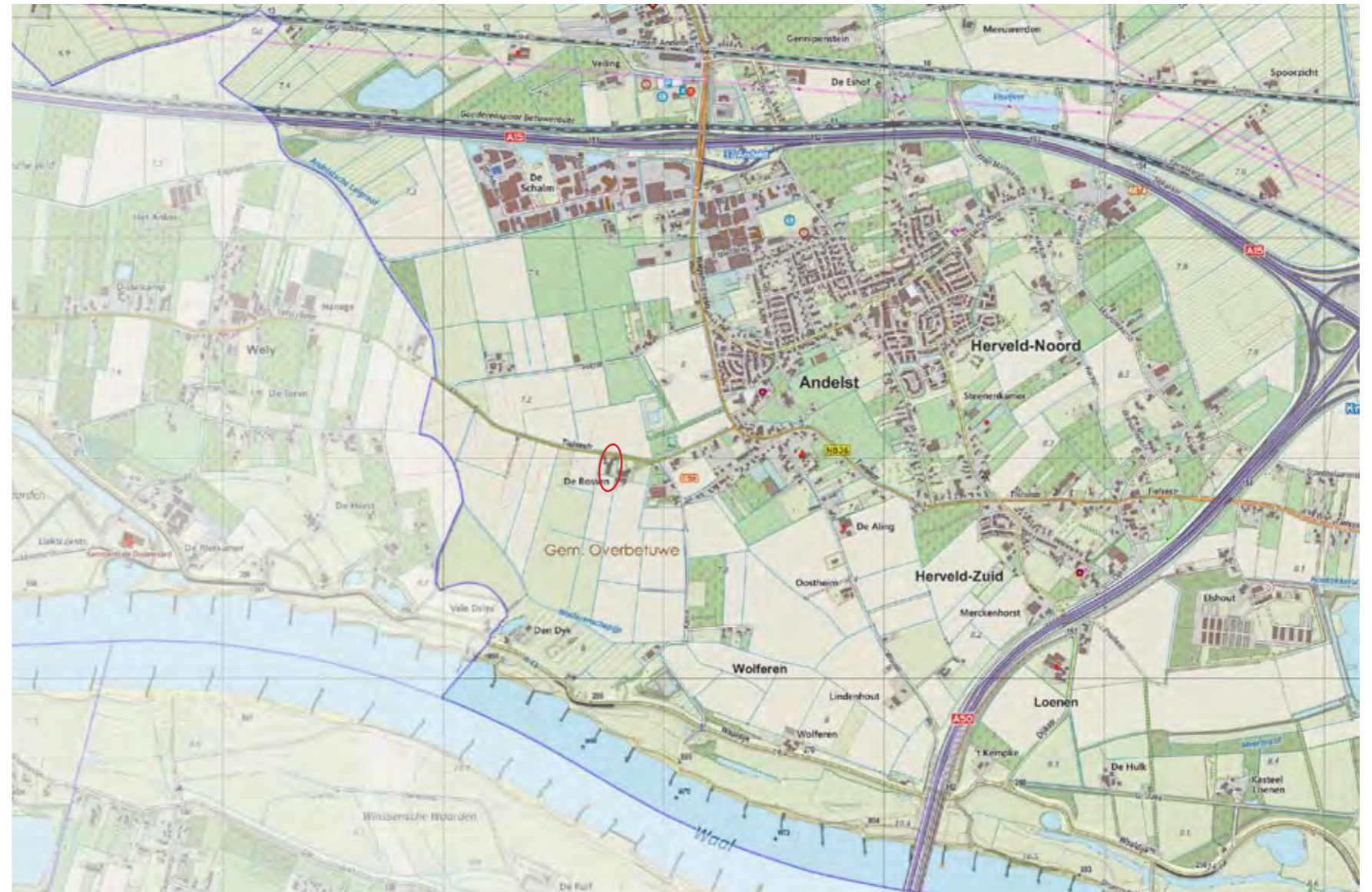
Topkaart gebied, met de projectlocatie ten zuid-westen van Andelst, rood omkaderd