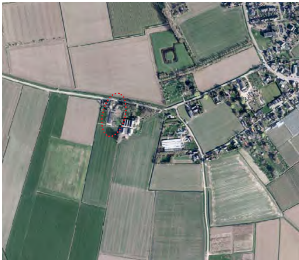
Luchtfoto met locatie

In de bestaande situatie is circa 1.000 m 2 aan agrarische opstallen op het erf aanwezig. Het plan bestaat er uit dat alle overbodige opstallen gesloopt worden waarbij alleen het achterste deel van een bestaande schuur blijft staan. Hier zullen de bedrijfsactiviteiten plaatsvinden. Voorliggend plan geeft een toelichting op het landschap, de visie van de ondernemers en de inrichting van de projectlocatie.