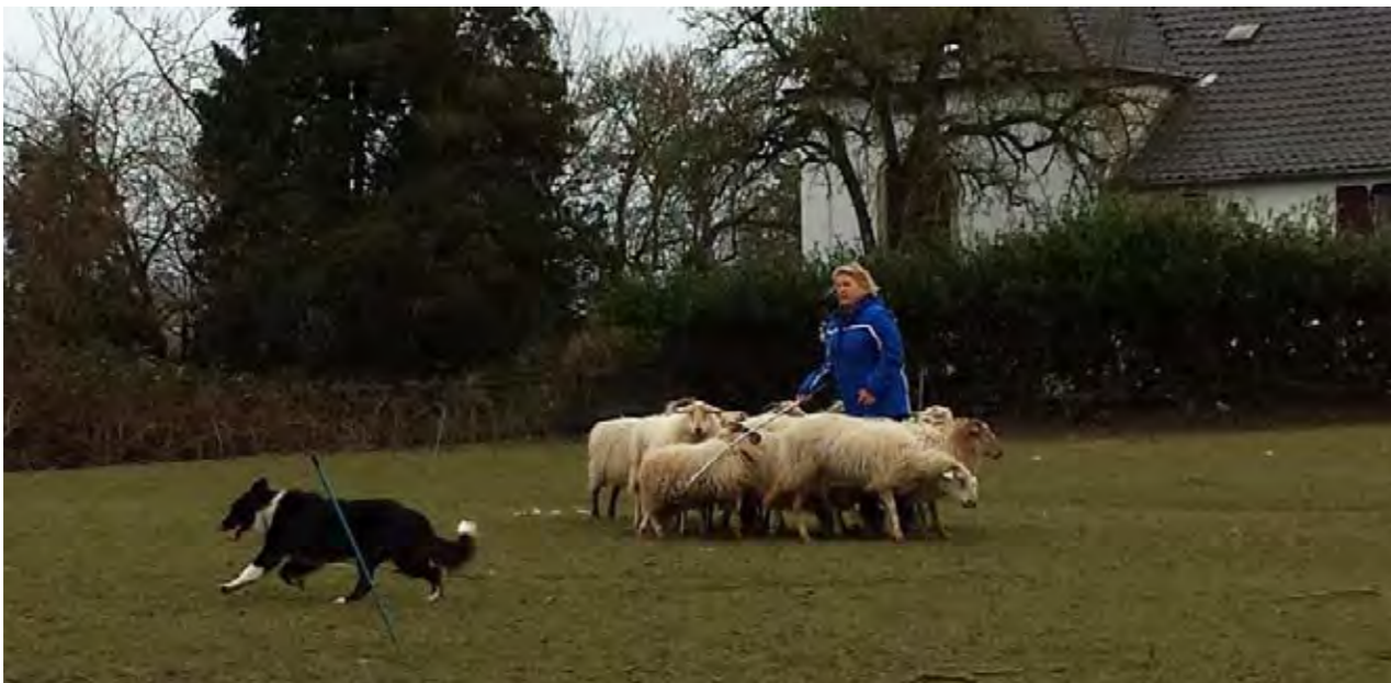
Training met Sheepdogs

In dit stadium, zijn wij als bedrijf aan het onderzoeken aan welke voorwaarden moet worden voldaan en welke aanpassingen binnen ons bedrijf benodigd zijn om mensen met een PGB te kunnen ontvangen en ze een plek te bieden binnen ons bedrijf.