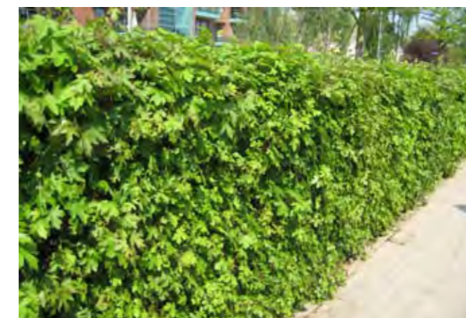
haag van veldesdoorn