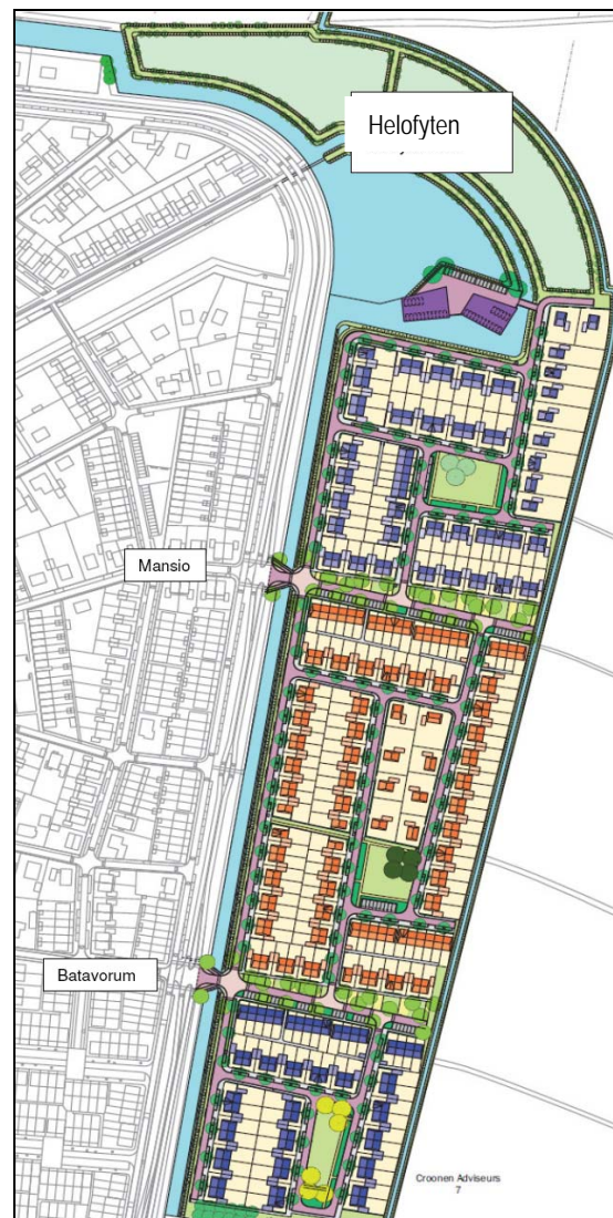
Figuur 3. Plansituatie Krekenbuurt te Elst.