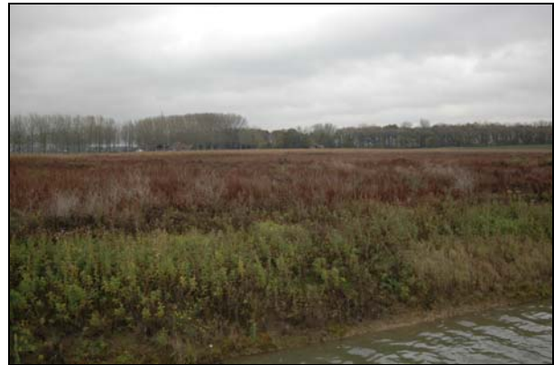
Figuur 2. Foto-impressie van het plangebied van de Krekenbuurt te Elst.

De plansituatie bestaat uit de aanleg van een woonwijk met in het noorden een helofytenfilter. In figuur 3 wordt een beeld gegeven van de plansituatie.