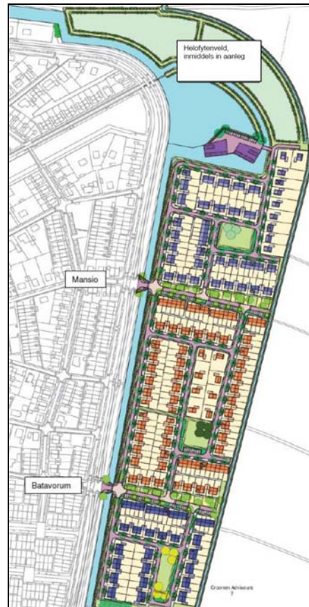
Figuur 2. Plansituatie Vierslag.

De plansituatie bestaat uit het realiseren van een woonbuurt conform figuur 3. Het betreft een woonwijk met woningen met tuin en enig openbaar groen.